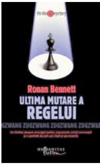
Ronan Bennett, „Ultima mutare a regelui” Editura Humanitas Fiction, 2008

și reluată de câte ori povestea o cere e aproape o bijuterie. Există și pete în soare: greu de admis o societate de psihanaliză la ora aceea, iar mahalalele rusești seamănă teribil cu Dublinul contemporan... dar, dacă există talent, nu se pune. Pe scurt, în orașul cu pricina se confruntă aproape toate forțele obscure ale putredului imperiu. Teroriști, Ohrana, partide, lideri, rătăciți, misionari, feministe, evrei, polonezi populează paginile într-un ritm amețitor. În mijlocul vântorii e un ins nevinovat pe care complotiștii se încapățânează să îl strivească. Repede, lectura capătă ritmul și răsuflarea tăiată care caracterizează un bun thriller. Iar curiozitatea stărnită a cititorului face restul.