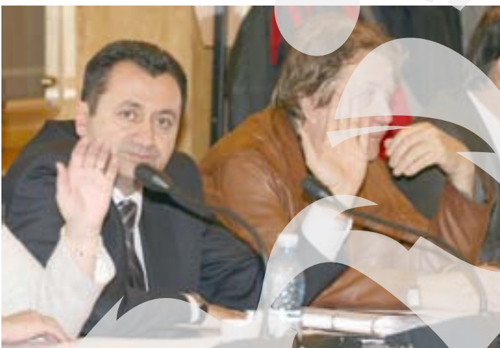
Foști candidați și actuali deputați au votat umăr la umăr