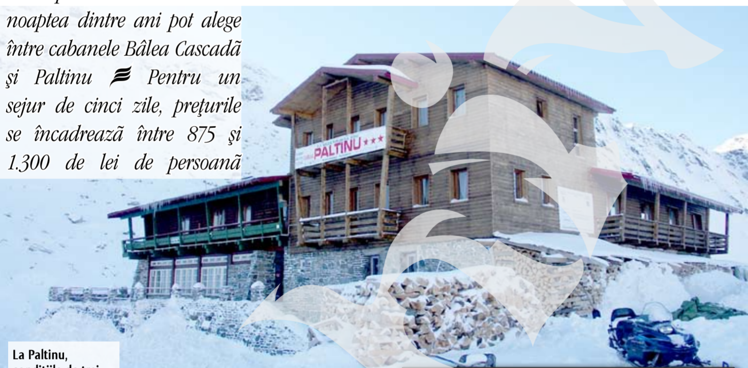
La Paltinu, condițiile de trei stele sunt pe placul tuturor turiștilor

Iubitorii peisajelor montane brăzdate de omăt au ocazia să își petreacă sărbătorile de iarnă într-un cadru ideal: zona Bâlea. Cine nu și-ar dori să poșească, pentru câteva zile măcar, în fosta cabană de vânătoare a lui Nicolae Ceaușescu, în locul în care dictatorul venea să se relaxeze și să împuște capre negre? La cota 2.044 m, turiștii vor fi primiți cum se cuvine în Cabana Paltinu. Încă din 1995, aici sunt organizate anual Serbările Estivale ale Zăpezii, în iunie. Dacă nu vor să-și amintească de Ceaușescu, oaspeților le-ar putea face cu ochiul frumoasa Nora, zăna de la Bâlea Lac.