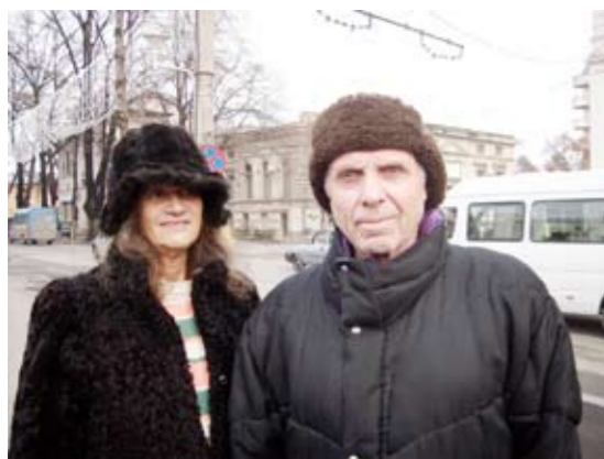
Primul om care a intrat în Județana de Partid este sprijinit doar de soție