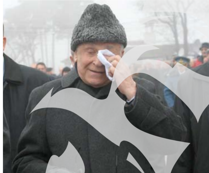
Fostul șef al statului Ion Iliescu a participat la toate manifestările legate de comemorarea Revoluției, chiar dacă a trecut prin clipe neplăcute

Fostul președinte Ion Iliescu a fost huiduit din nou, ieri dimineață, la manifestările de comemorare din Piața Revoluției din Capitală, de un bătrân, care a încercat să se apropie de el, fiind oprit de forțele de ordine. Bătrânul i-a reproșat fostului președinte că este responsabil