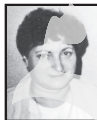
PALADE VETA. Odihna veșnică. Cuscarii Elisei. (009536/NC-154860)

• Cu adâncă durere în suflet anunț trecerea în neființă după o lungă și grea suferință a bunei noastre cuscre