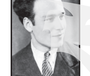
PALADE VETA. Odihna veșnică. Cuscarii Elisei. (009536/NC-154860)

• Cu durere în suflet anunțăm trecerea în neființă a celui mai scump și drag tată,