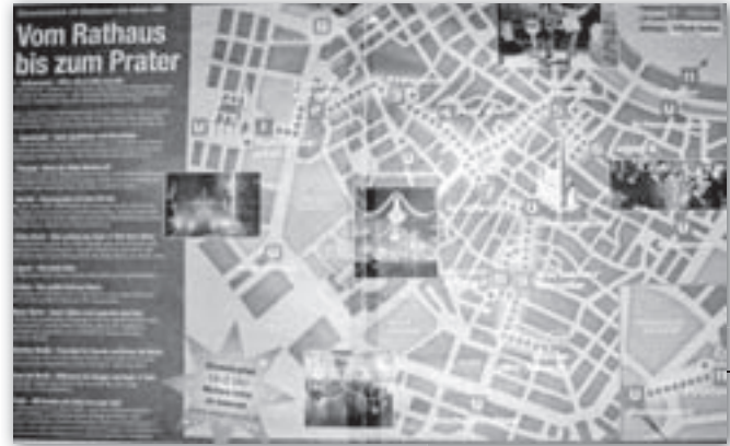
Harta petrecerilor de Revelion

Nimeni nu se putea plânge că nu poate cânta alături de orchestră câtă vreme versurile erau afișate pe un ecran uriaș