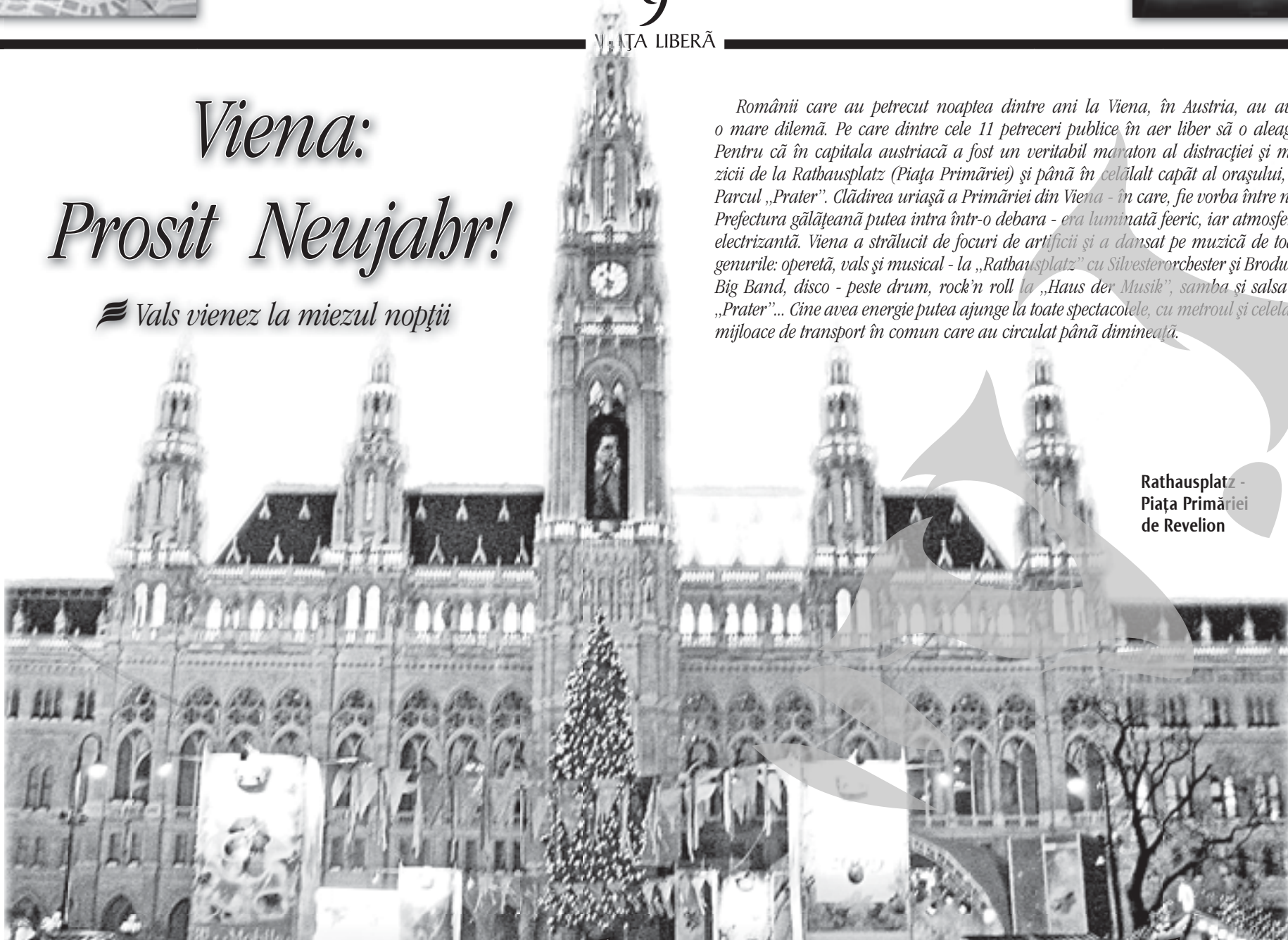
Rathausplatz - Piața Primăriei de Revelion