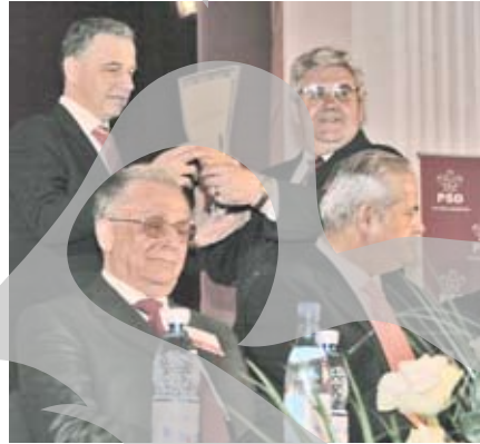
Diplome pentru PSD

Greii PSD, președintele Mircea Geoană, președintele de onoare, Ion Iliescu, și președintele Consiliului Național PSD, Adrian Năstase, au descălecat la Galați în martie, încurcându-și drumurile cu premierul României, Călin Popescu Tăriceanu care, în aceeași zi, vizita Brăila.