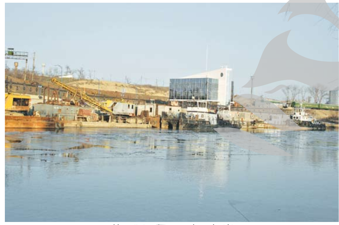
Moldovenii și-au făcut portul repede și bine

Probabil că nu mulți gălățeni știu că pe malul stâng al Prutului, chiar la confluența cu Dunărea, vecinii noștri din Republica Moldova au construit Portul Giurgiulești. Știu însă asta cei care merg la pescuit la „Scurta”. Obiectivul de vizavi e, cu siguranță, de o importanță covârșitoare pentru autoritățile moldovene, din moment ce a fost ridicat, în doar câțiva ani, cu eforturi financiare considerabile. Motivul este clar: acest port reprezintă, de fapt, singura ieșire a Republicii Moldova către Dunăre, Marea Neagră, către lume, care poate