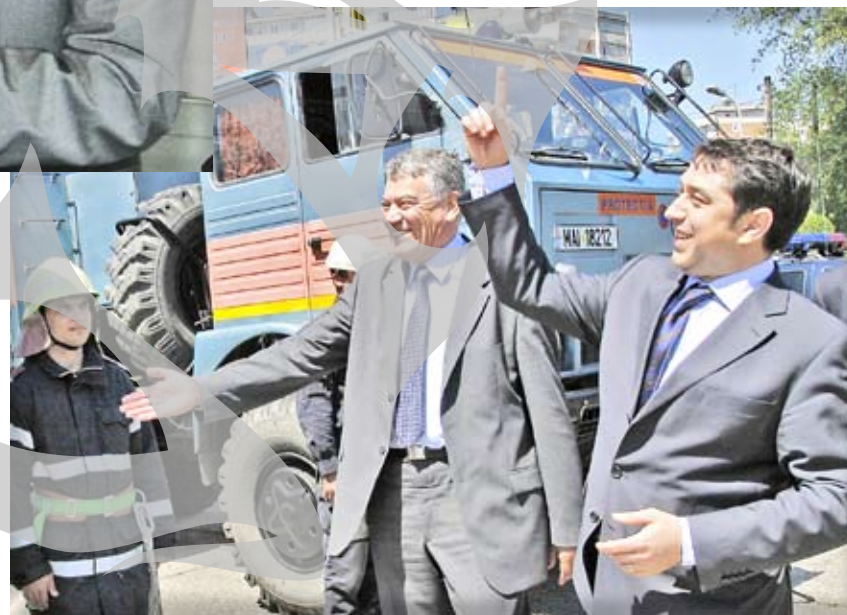
De sus vine ajutorul, de la Guvern, pare să spună ministrul David

Seria vizitelor de rang înalt a fost încheiată de președintele Traian Băsescu, care, cu prile-