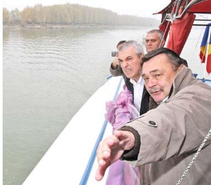
Premier pe valuri

Premierul Călin Popescu Tăriceanu: o dată, de două ori, de trei ori, adjudecat! Periplul său a debutat la Liga Alesilor Locali PNL. A revenit, în campania alegerilor locale, la un concert „Phoenix”, în deschiderea căruia liberalii și-au prezentat candidații. În toamnă, la ceas de seară, în faimoasa stație „La două Babe”, Tăriceanu a susținut un discurs în stradă, alături de candidații liberali gălățeni. A doua zi, cu tot cu presă, Tăriceanu a făcut o plimbare (plătită de PNL), cu vaporul, pe Dunăre, până la Isaccea. Acolo, premierul a participat la un miting electoral și la întâlnirea cu guvernatorul Deltei Dunării. În ce calitate s-a perindat premierul pe la Galați? În februarie, la Liga Alesilor Locali, Tăriceanu a mărturisit că se află „în calitate de președinte al PNL, dar înainte am venit în calitate de premier, acum mi-am schimbat ecusonul din piept. Înainte de a ajunge aici, am fost la APIA care