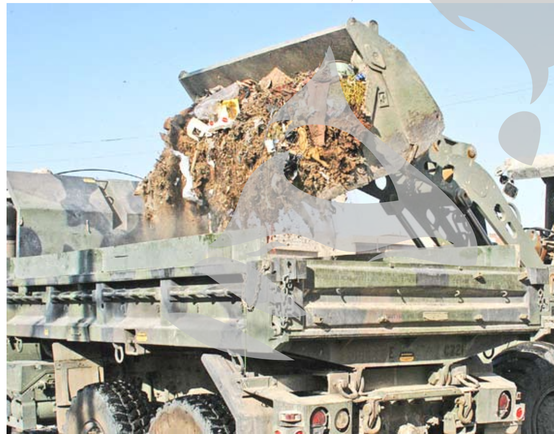
Desființarea rampelor de gunoi a început în județul Galați

de gunoi actuale din comună, primarul ne-a dat asigurări că vor fi acoperite cu pământ și că se va semăna gazon acolo.