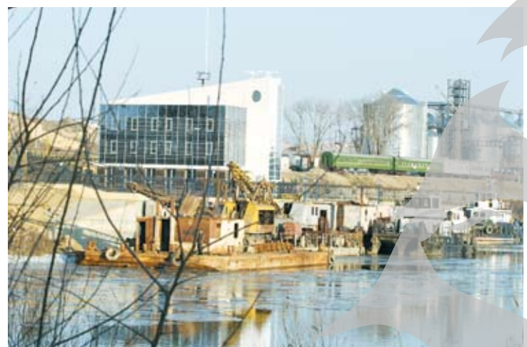
Pe malul românesc sunt doar bălării

Până una alta, după cum ați sesizat probabil, moldovenii de peste Prut ne-au demonstrat că știu să se mobilizeze mai bine când e vorba să construiască un obiectiv de importanța celui amintit.