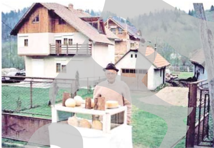
Cu autorizație, se poate vinde orice

► Documentul se obține de la Direcția Sanitar-Veterinară și pentru Siguranța Alimentelor