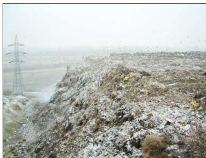
Actuala groapă de gunoi a Galațiului se va închide în această toamnă

„Am citit un articol scris în «Viața liberă» cu gropile de gunoi din județ și subscriu la articol. Ce nu știu eu sunt soluțiile. Dacă ați observat, la Liești, ca să îți ia gunoiul se percepe o taxă de 60 de lei pe an (de fapt, lișteștii nu au făcut contract cu firma de salubritate din cauza tarifului ridicat), iar noi plătim până în 40 de lei [de fapt, taxa de habitat anuală pentru persoană este de 45 de lei] și e oraș... Problema gunoierului trebuie lămurită. Acum se gândesc proiectele pentru etapa 2015 și cred că trebuie gândit la nivelul județului și niște colectări comune ale gunoierului. Știm că în septembrie 2009 groapa pe care o avem trebuie închisă și că noua groapă va fi deschisă, însă aceasta nu va rezista mai mult de zece ani, cu tot cu sistemul de sortare...”, a declarat primarul