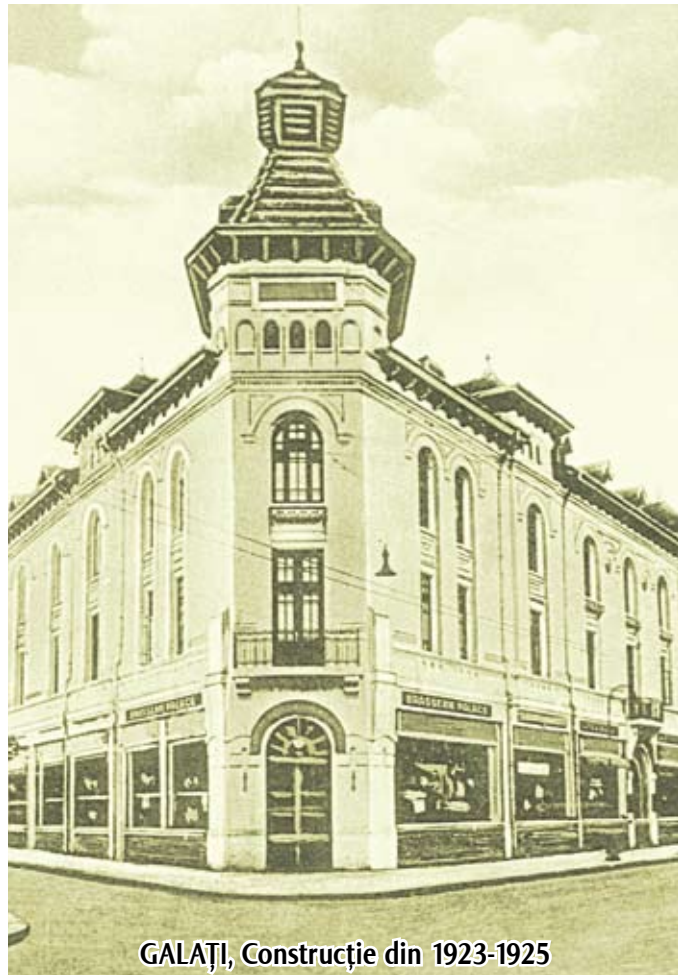
GALAȚI, Construcție din 1923-1925