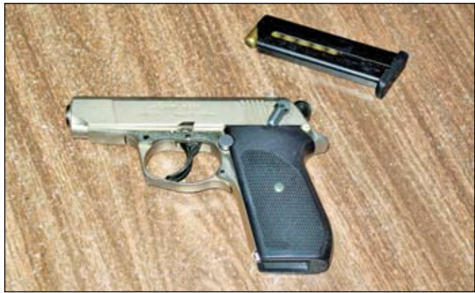
Pistolul marca Rohm RG 88, calibru 10x22 T, găsit în mașină