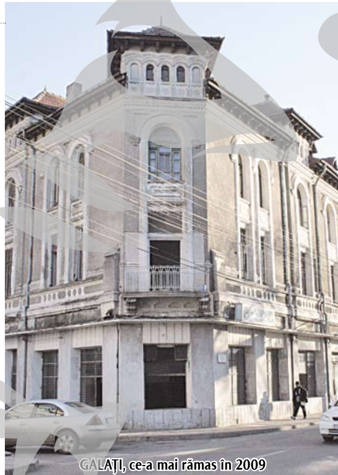
GALAȚI, ce-a mai rămas în 2009