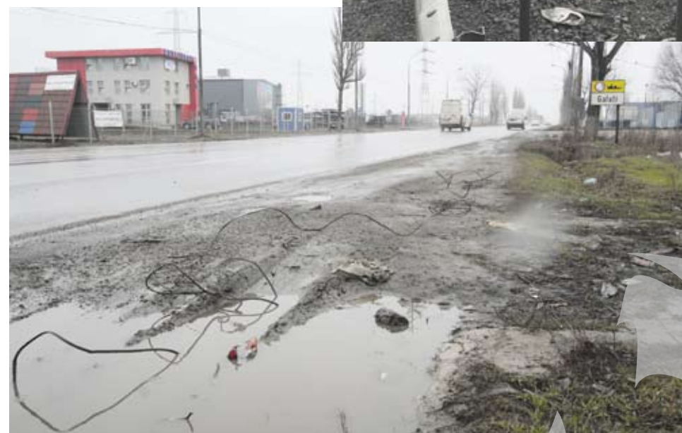
Intrarea în Galați, dinspre Vânători

trărilor în municipiul de pe malul Dunării sunt triste și nu prea invită la revenirea pe aceste meleaguri. Pe oricare drum ai lua-o ca să vii în Galați, prima impresie este deplorabilă. Cu toate asigurările că este și oraș european și că s-a înfrățit cu unii sau alții. Spune-mi unde locuiești ca să-ți spun cine ești, ar putea fi motto-ul pentru o eventuală ofertă turistică. La care vă invităm să participați prin imagini sugestive și dumneavoastră. Deocamdată, intrați pe www.viata-libera.ro și vizionați și filmul postat de noi. Cu siguranță veți avea o mulțime de idei, pe care abia așteptăm să ni le împărtășiți.