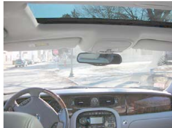
Convorbirea din habitaclul mașinii a fost ascultată

De la procurorul Sorin Leau, purtătorul de cuvânt al Parchetului de pe lângă Tribunalul Galați, am aflat amănunte interesante cu privire la un caz (flagrant cu dare de mită) relatat în numărul de alaltăieri al ziarului nostru.