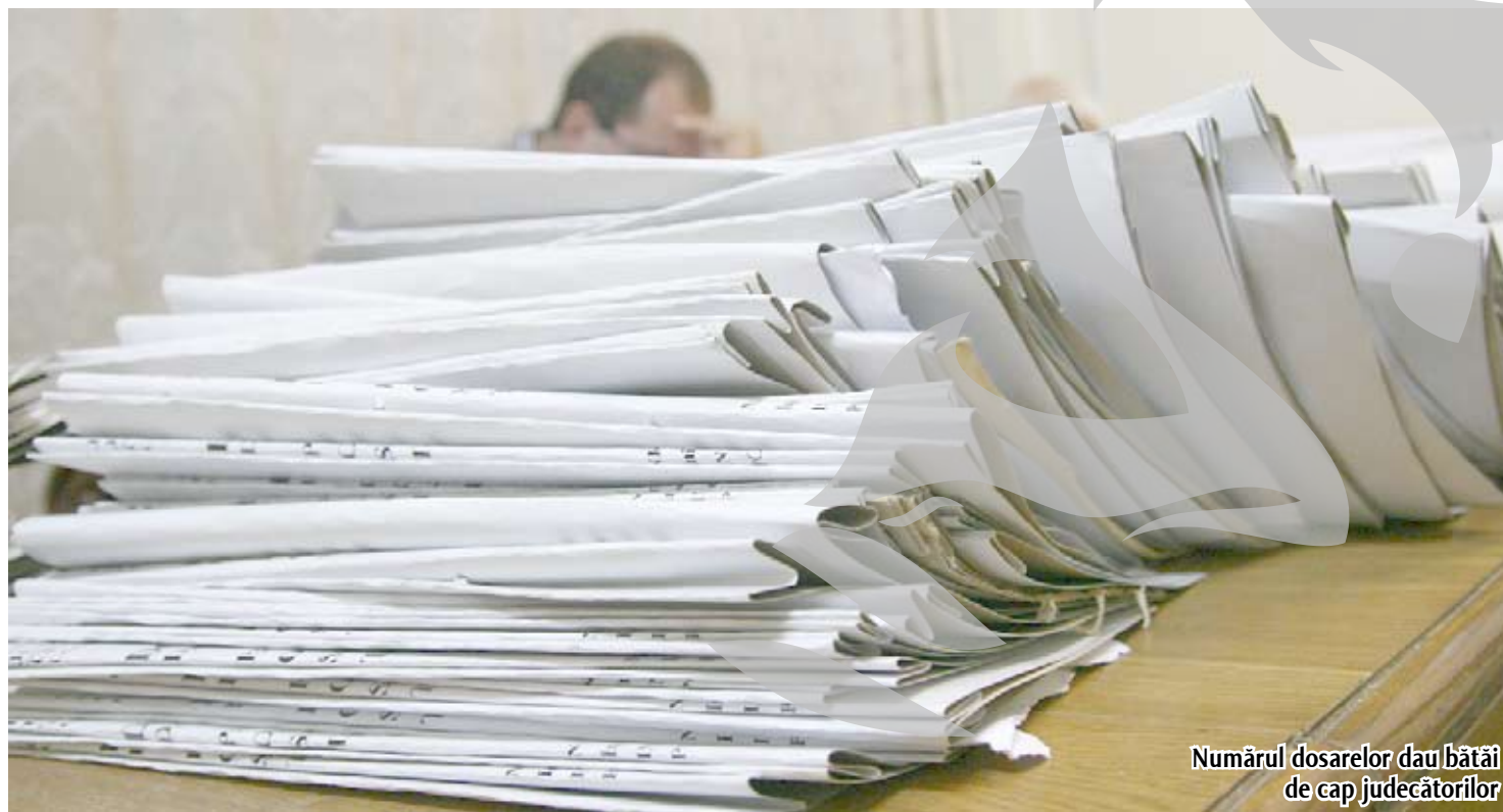
Numărul dosarelor dau bătăi de cap judecătorilor

Principala problemă a Judecătoriei Galați în anul 2008, la fel ca și cea din perioada 2004 - 2007, a fost cea a numărului insuficient de judecători. Anul trecut, la această instanță au intrat în ședințe de judecată 22 de magistrați (în medie), dintre care unul delegat la Penitenciarul Galați și unul suspendat din activitate, fiind în concediu de creștere a copilului. Prin urmare, un număr de aproximativ 20 de magistrați au fost alocați activității de judecată, restul de nouă posturi fiind vacante. Fluctuația de personal de la această instanță (au plecat 13 judecători și au fost numiți în funcție doar opt) a dus la disfuncționalități în realizarea actului de justiție. „Scăderea numărului de judecători, fluctuația permanentă a acestora, aproape jumătate din numărul total, au fost factori de o reală importanță și care nu pot fi supliniți prin nicio politică de management, nu pot crea o practică unitară și în final niciun act de justiție care să se ridice la nivelul cerințelor europene”, se arată în raportul Judecătoriei.