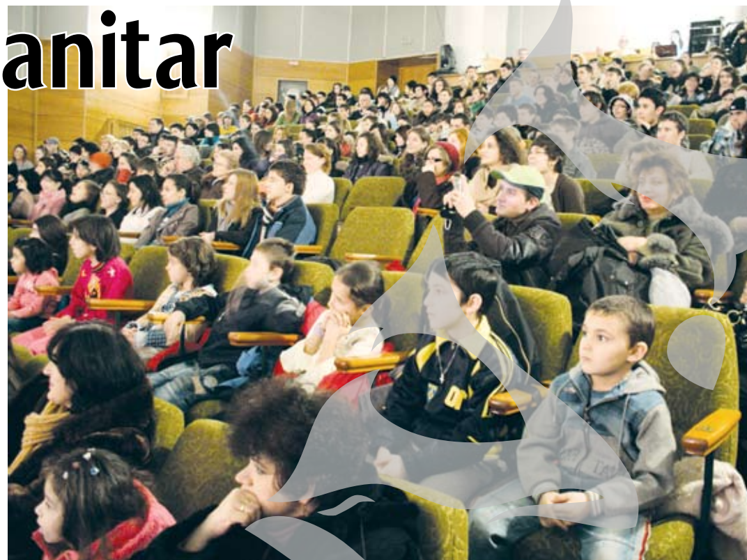
Copiii au organizat un spectacol pentru copii