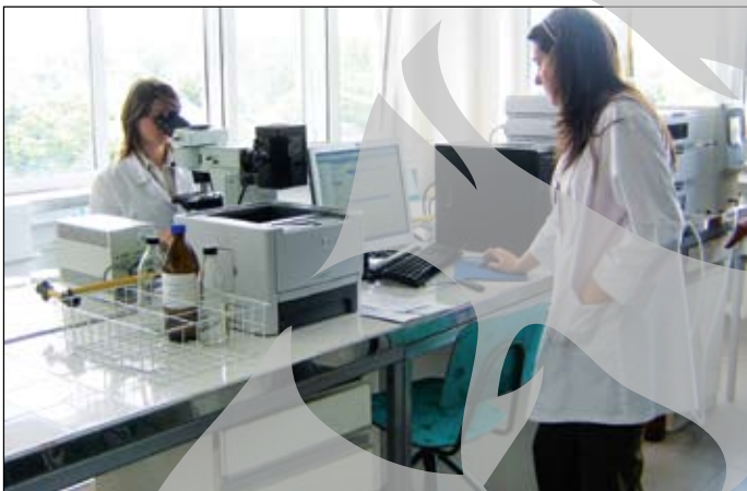
Cercetătorii vor beneficia de aceleași sume ca și anul trecut

Cercetarea va primi, până la urmă, aceeași sumă de bani ca și anul trecut, adică tot 0,8 la sută din PIB. Asta după ce numeroase instituții au contestat intenția Guvernului de a reduce la jumătate sumele destinate cercetării în anul 2009. Sub presiunea cercetătorilor, Comisiile de Învățământ ale Camerei Deputaților și Senatului au hotărât să ofere o suplimentare cu 620 de milioane