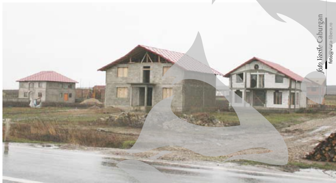
Câteva dintre vilele care se construiesc în noul cartier al Munteniului

Comuna Munteni, a treia din județul Galați ca număr de locuitori (9.648 de oameni, potrivit ultimului recensământ), este probabil unul dintre cele mai interesante conglomerate sociale din această parte a țării. În cele patru sate ale comunei (Munteni, Frunzeasca, Ungureni și Țigănești) trăiesc laolaltă și oameni care de-abia au din ce trăi, dar și oameni „cu stare”. Între locuitorii comunei se numără și săteni care au în urmă zece de generații trăite în aceeași vatră, dar și rromi semi-nomazi, care de-abia acum deprind „tainele” statorniciei. Însă nu despre mozaicul social ne propunem să scriem în articolul de față, ci despre explozia rezidențială ce a „lovit” Munteniul în ultimii ani.