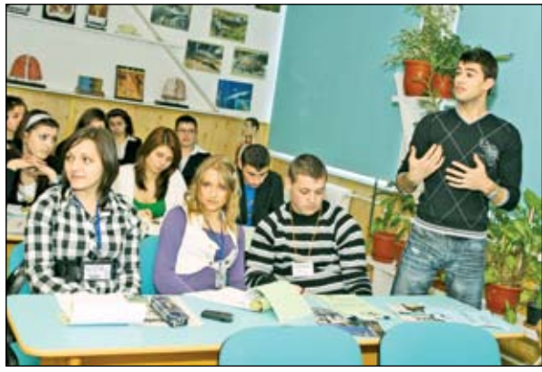
Sala multimedia de la Casa de Cultură