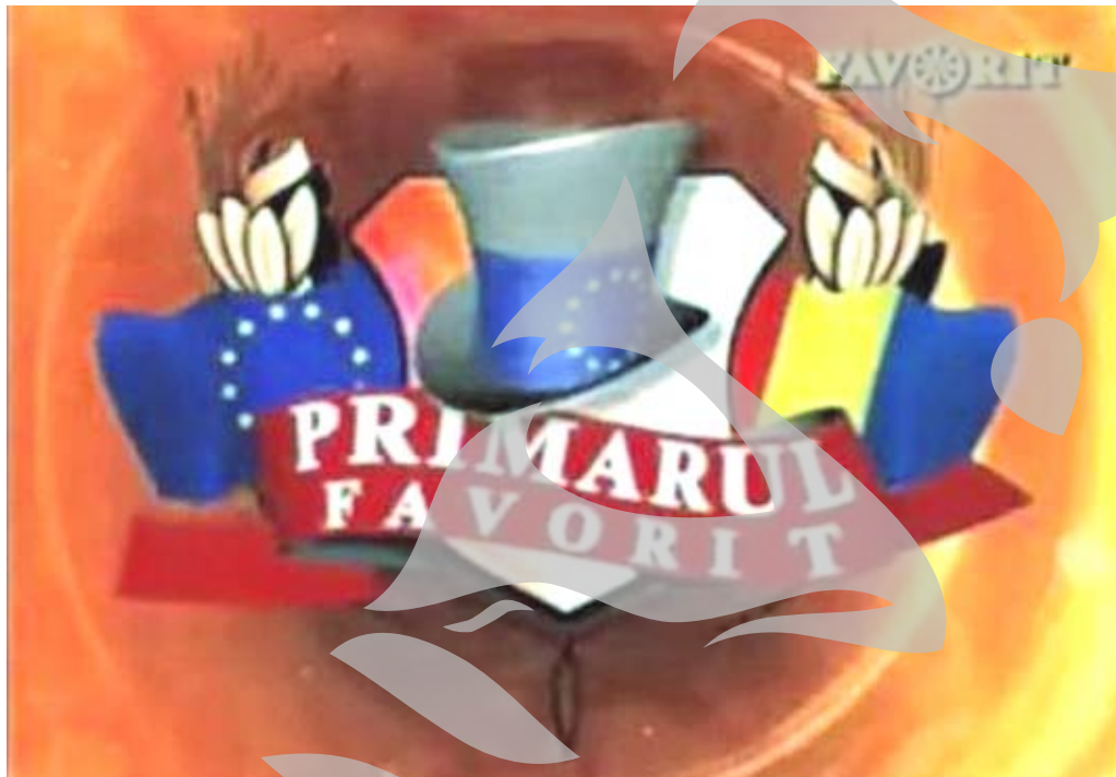
Toți primarii vor să ajungă favoriți

Liberalul Dănuț Codrescu, primarul comunei Cuza Vodă, a făcut recent furori la emisiunea de pe Favorit: „Am acceptat să particip la emisiune pentru a promova localitatea și pe cetățenii ei. În plus, am câteva comori, niște copii foarte talentați în comună, pe care voiam să le fac cunoscute. Aproape o sută de localnici ne-am depla-