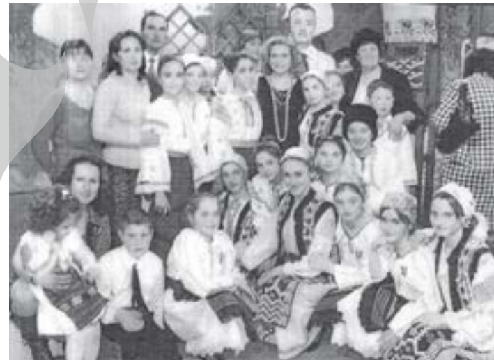
Desfășurare de forțe de la Cuza Vodă