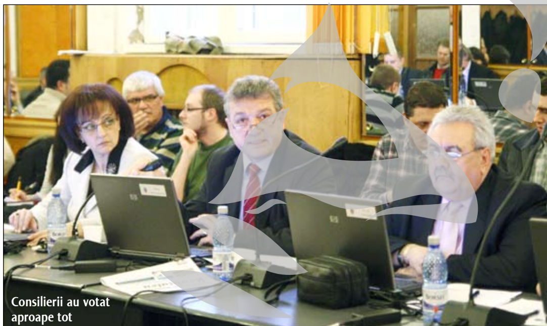
Consilierii au votat aproape tot