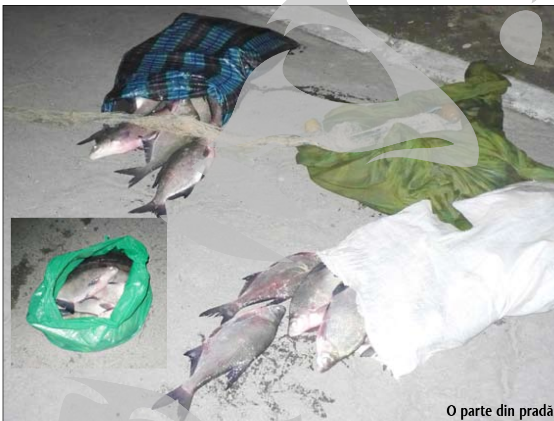
O parte din pradă