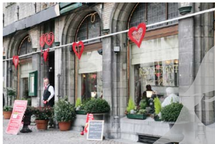
De la gardă la restaurant

Impunătoarea Catedrală Notre-Dame, construită între se-