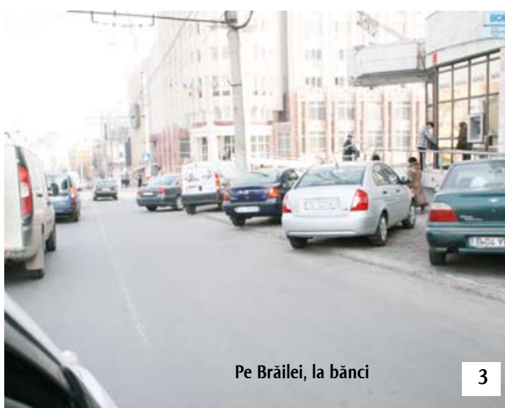
Pe Brăilei, la bănci