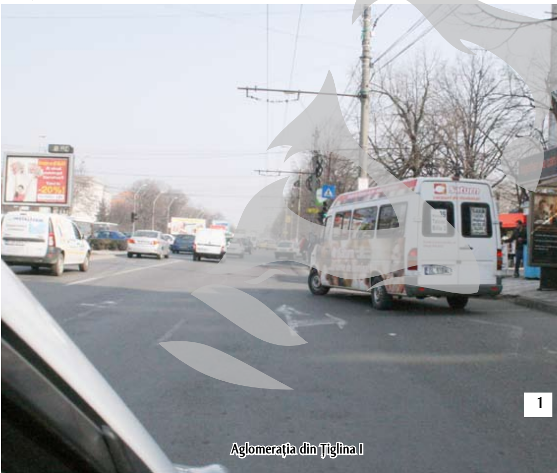
Aglomerația din Țiglina I