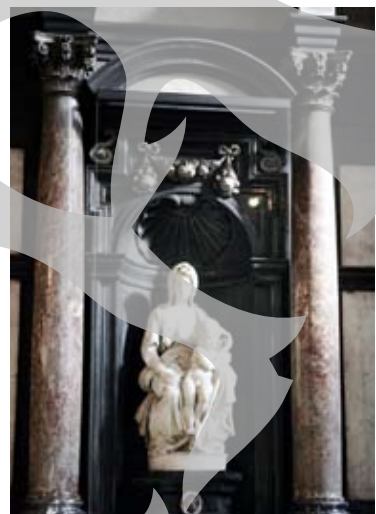
Madona cu pruncul a lui Michelangelo

colul al XIII-lea și al XV-lea, are un impresionant turn de cărămidă înalt de 122 m (cel mai înalt din lume construit din respectivul material) și un patrimoniu artistic de o valoare incomensurabilă. Nava centrală, cea mai veche, datează