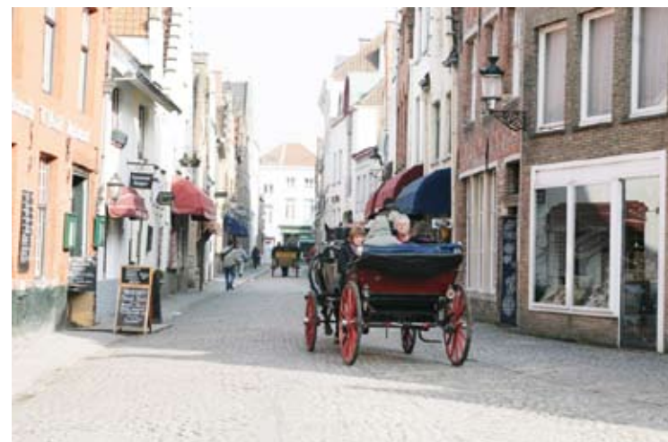
Plimbare cu trăsura