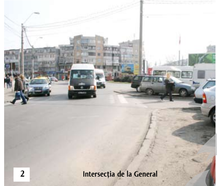
Intersecția de la General