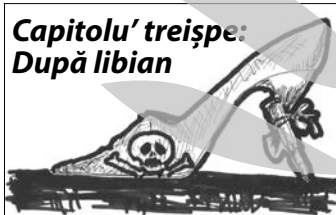
Capitolu' treispe: După libian