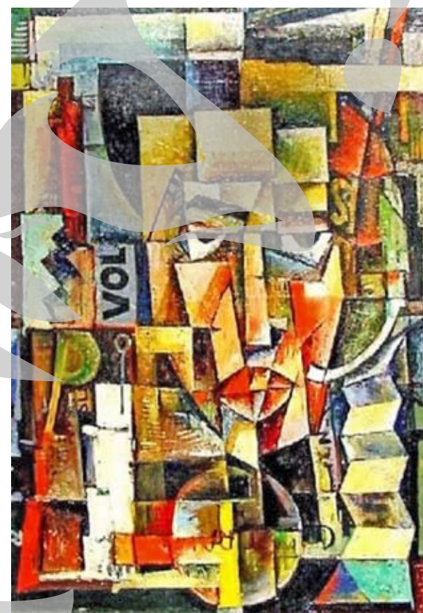
Portretul poetului Ilarie Voronca de Victor Brauner

ticulare. „Culorile avangardei” surprinde exact aceste trăsături caleidoscopice variate ale artei vizuale din acea vreme, care-și aveau rădăcinile în tradiții diferite, dar totodată complementare. Influențele reciproce, emulația, provocările, imitația, atitudinea critică sau parodică au constituit un fundal și un dialog intercultural în acea perioadă, care a condus la formarea unei variate arte vizuale în România interbelică și nu numai”, se spune în prezentarea de pe site-ul Muzeului Do Chiado din Lisabona. Așadar, avem cu ce ne mândri: pânzele din patrimoniul muzeului gălățean vor fi admirate peste tot în Europa și vor reprezenta o întreagă epocă a artei românești. Ceea ce nu e puțin lucru.