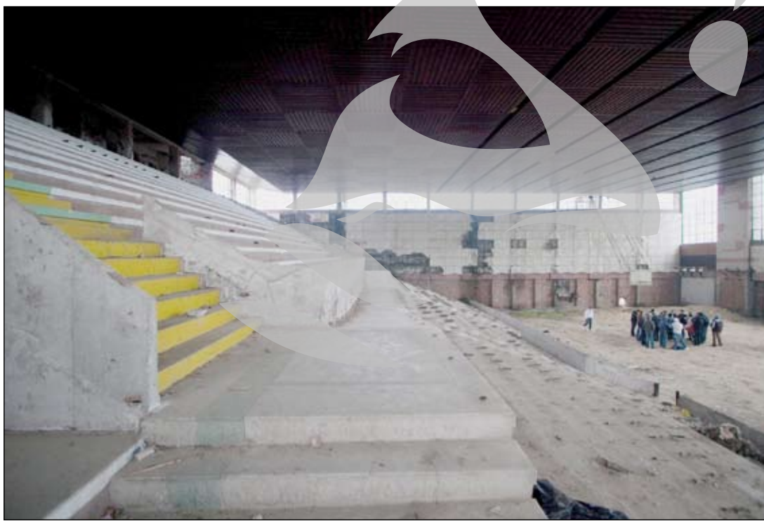
Sala Sporturilor rămâne în paragină