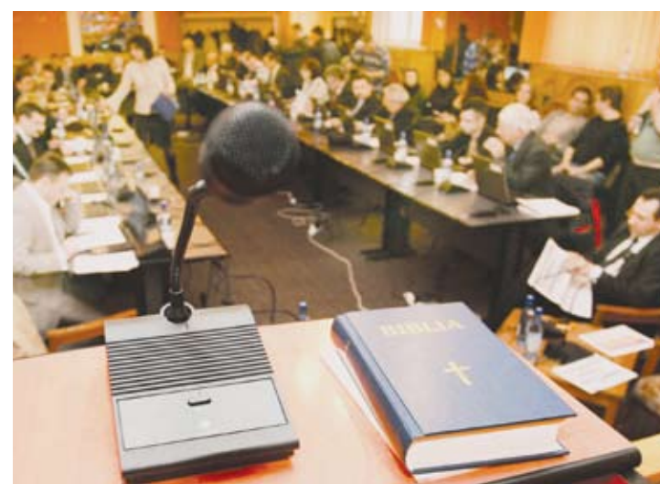
Doar Domnul mai poate opri scumpirile...

În ședința Consiliului Local Galați de ieri, printre cele 46 de puncte ale ordinii de zi, s-a aprobat mărirea prețurilor și tarifelor pentru apa potabilă și serviciul de canalizare furnizate de SC APĂ CANAL SA. Cei șapte consilieri locali PD-L s-au abținut de la vot, considerând că, deși era de așteptat o majorare a prețurilor, aceasta nu a fost justificată în documentele înaintate. ceilalți consilieri au votat pentru aprobarea noilor prețuri. De fapt, s-a votat în principiu, pentru că nu am putut afla prețul exact până când nu l-am întrebat pe primarul Dumitru Nicolae. Astfel, putem să-i informăm pe consumatorii casnici că prețul pe care îl vor plăti pentru apa potabilă a urcat de la 2,37 lei/mc la 2,87 lei/mc, prețul incluzând și TVA. Pentru cheltuielile de canalizare, cetățenii vor plăti de la 0,5 la 0,7 lei/mc, cu TVA inclus. Ca să realizăm cam unde am ajuns în momentul de față, primarul ne-a pus la dispoziție și situația celorlalte societăți de apă-canal din țară, unde prețurile actuale sunt deja mai mari la apa potabilă,