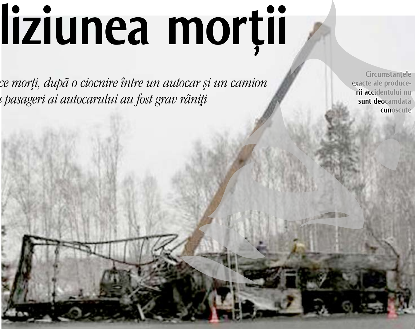
Circumstanțele exacte ale producerii accidentului nu sunt deocamdată cunoscute