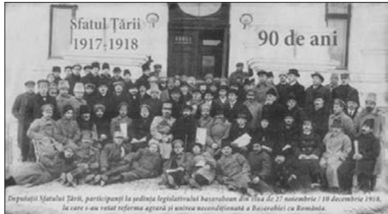
Sfatul Țării, după votarea Unirii