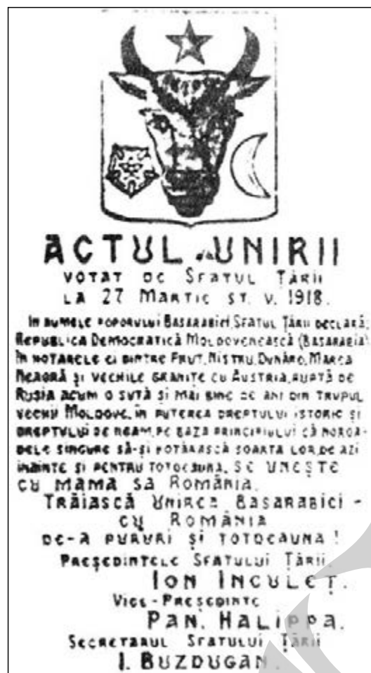
Actul Unirii Basarabiei cu România

Acum 91 de ani, la Chișinău, Sfatul Țării, în care erau reprezentate toate etniile conlocuitorilor, hotărâra că Basarabia „de azi înainte și pentru totdeauna se unește cu mama sa, România”.