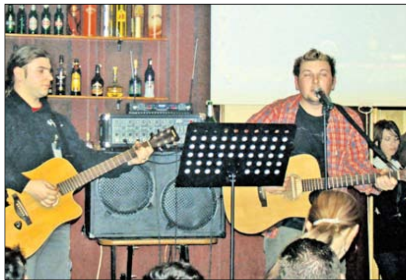
Trupa Greenish Unplugged vă așteaptă și astăzi la o seară de folk

Cafeneaua „Mond'Art Gallery” ne-a obișnuit cu găzduirea a numeroase expoziții de tablouri și picturi care pot fi admirate în timp ce clientela își savurează cafeaua. Ca un element de noutate, în parteneriat cu Queen Company, Clubul „Reactiv” organizează pe parcursul a trei săptămâni evenimente multimedia, expuneri de fotografii, seminarii despre arta fotografică, dar și serate folk, ale trupei Greenish Unplugged. Evenimentul, care se derulează de săptămâna trecută, poartă numele „Recrea(c)tivitate”.