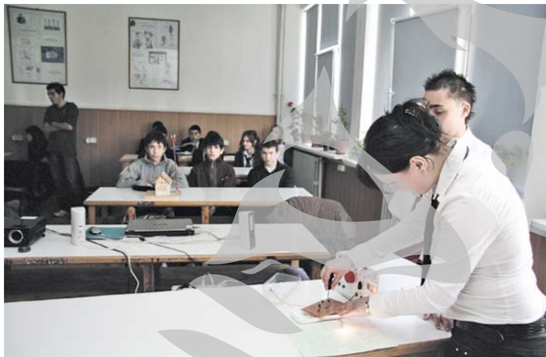
Micii fizicienii au demonstrat că fiecare fenomen are o explicație științifică