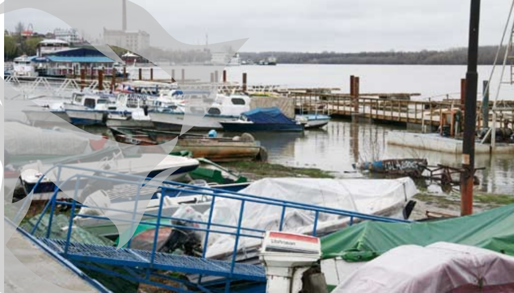
Bărcile își așteaptă noul debarcader

Pe malul brăilean al Dunării, în zona debarcaderului, bărcuțele, mai ochioase ori mai modeste, stau pe mal așteptând finalizarea lucrărilor de modernizare a portului de ambarcațiuni. Paznicul e vigilent și nu lasă pe nimeni să intre în zona de lucru. De la el am aflat că în portul de