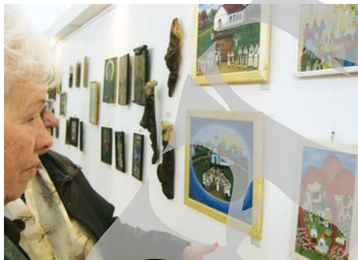
Expoziția rămâne deschisă până la mijlocul lunii mai

≡ Gălățenii sunt invitați să aleagă cea mai frumoasă lucrare