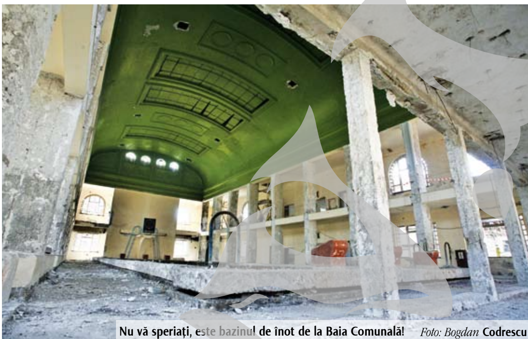
Nu vă speriați, este bazinul de înot de la Baia Comunală!