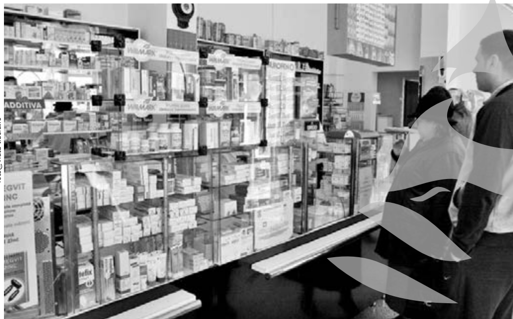
Sorin Pana foto:viata-libera.ro

După un post de șase săptămâni, sărbătorile pascale sunt caracterizate printr-un tradițional abuz alimentară. În fiecare familie se pregătesc bucate alese, tentante, dar greu de digerat, fiind preparate pe bază de carne de miel, ouă, grăsimi etc. Drept urmare, persoanele care dau frâu pornirilor pantagruelice, eventual stimulate de un vin bun, ajung să sufere neplăcerile unor crize de indigestie, iar în cazurile mai grave pot avea nevoie de asistență medicală de urgență. Pentru personalul de la Ambulanță, perioada Sărbătorilor Pascale este una solicitantă, mai cu seamă din cauza abuzurilor alimentare (și a celor bahice). Din fericire însă, majoritatea indigestiilor au consecințe care pot fi rezolvate și fără ajutorul medicului, apelându-se, în primă instanță, la câteva medicamente utile în astfel de situații și pe care este bine să le