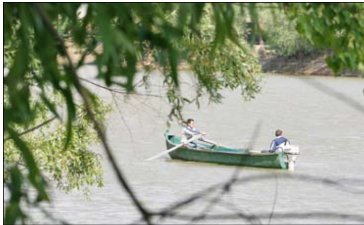
Sălciile - martorii de lângă apel