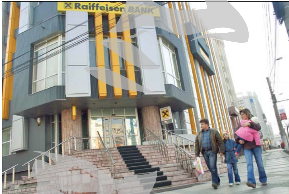
Raiffeisen Bank este din nou atacată de hackeri

Departamentul de Comunicare al băncii amintite ne-a transmis că la mijloc este o mare escrocherie. „Raiffeisen Bank nu trimite sub niciun pretext pe e-mail sau SMS mesaje de verificare sau de alertare conținând formulare, programe atașate sau redirecționări către site-uri care să solicite date personale sau informații confidențiale. Aceste tipuri de mesaje vin de la adrese de mail contrafăcute sau inexistente cu scopul de a fura informații confidențiale în scop de fraudă. Cea mai sigură măsură de prevenire a unei posibile fraude este să nu dați curs solicitărilor dintr-un asemenea mesaj. Clienții care primesc astfel de mesaje sunt rugați să contacteze de urgență Raiffeisen Bank, la numerele de telefon: 021.306.55.55, 021.306.55.56 (numere cu tarif normal, apelabile non-stop din orice rețea), sau prin e-mail: onli-