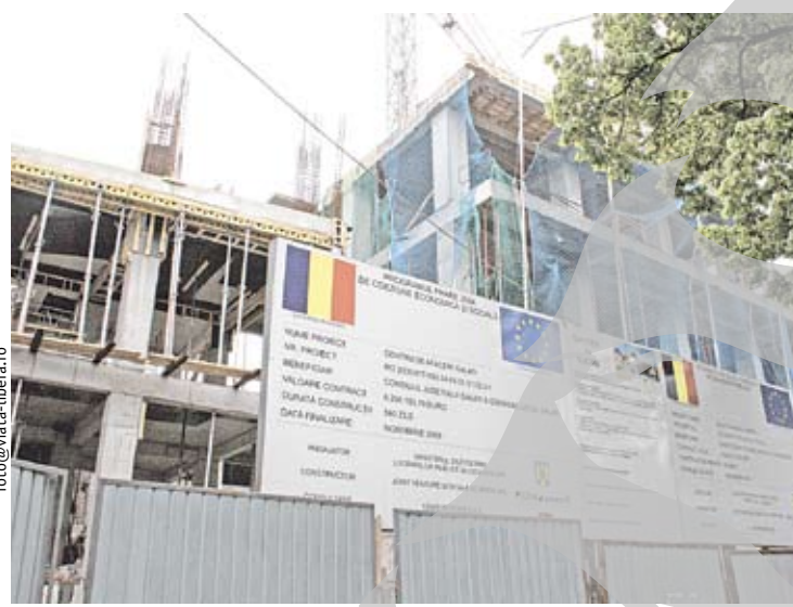
Balada meșterului Manole, în variantă gălățeană