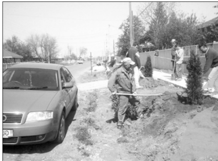
De 1 Mai, la Fârțanești, ceva nou în care să-ți „sprijini” ochii - 1000 de tuia cumpărați din Ungaria