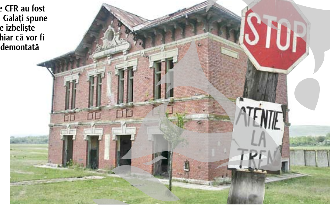
Fantoma haltei Băleni

Halta Chiraftei avea cândva unul dintre cele mai active pezoane de pe toată linia Bârladului. Până prin 1995, sute de oameni din sat făceau naveta la Galați, mai ales la Combinat. Acum halta e doar o clădire amărâtă, gata să se prăbușească, ferecată cu lacăt greu. Între șine, parcă într-un act de revoltă colectivă, câțiva maci