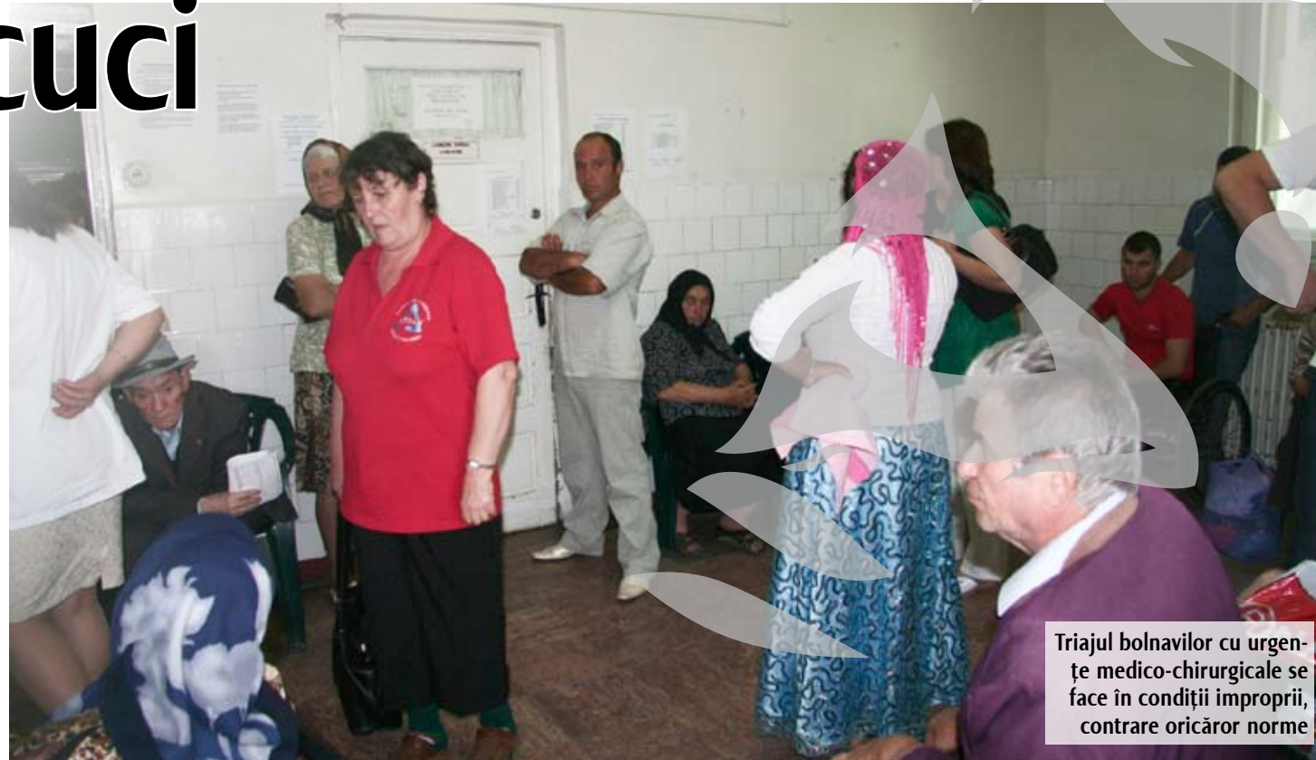
Triajul bolnavilor cu urgențe medico-chirurgicale se face în condiții improprie, contrare oricăror norme

Interpelat de senatorul PSD pe Colegiul 1 Laurențiu Chirvăsuță, ministrul Sănătății, Ion Bazac, și-a dat acordul pentru înființarea și dotarea unui Centru de Primiri Urgențe la Spitalul „Anton Cincu” din Tecuci În cursul acestui an, acest compartiment va fi dotat cu fonduri obținute prin Programul Băncii Mondiale