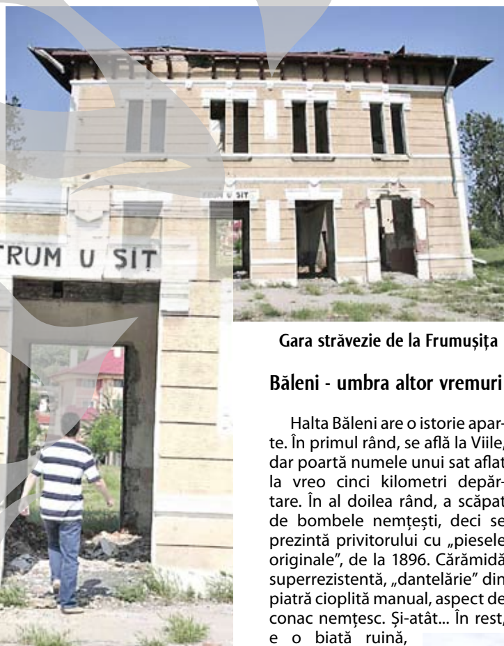
Gara străvezie de la Frumușița

Sătenii se crucesc atunci când îi întrebă de ce nu merg cu trenul. „Păi, de ce am merge cu trenul? Face o oră și jumătate până la Galați, iar microbuzul face jumătate de oră”, spun ei.