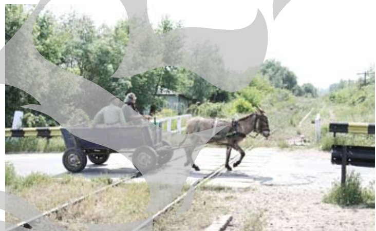
Întoarcere în timp...

Clădirea gării Frumușița a fost cândva o bijuterie. S-a ridi-