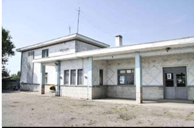
Foltești, una dintre puținele gări cu casierie