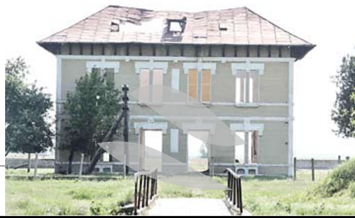
A fost cândva o bijuterie