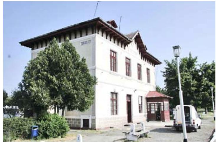
Tuluceștiul se încapățânează să reziste

Acum, gara Frumușița este o ruină în sine, cu damf de fecale și urină. S-a furat tot. Uși, geamuri, pardoseli, acoperiș... Se