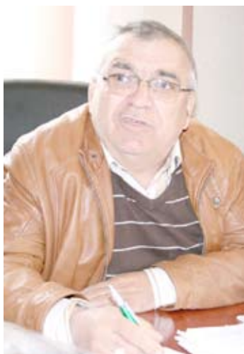
Primarul Hanță nu a aflat încă dacă funcționarii Primăriei sunt părtași la fraudă

Sătenii din Suceveni sunt foarte supărați pe Cooperativa de Credit „Belșugul” din Galați. Circa 100 de familii s-au pomenit, pe nepusă masă, că au de achitat credite către respectiva cooperativă, deși oamenii nu solicitaseră și nu primiseră niciun împrumut. Ba chiar vreo 30 de familii au descoperit că le-au dispărut din cont economiile de-o viață. De aici și până la izbucnirea unui ditamai scandal nu a fost decât un pas.