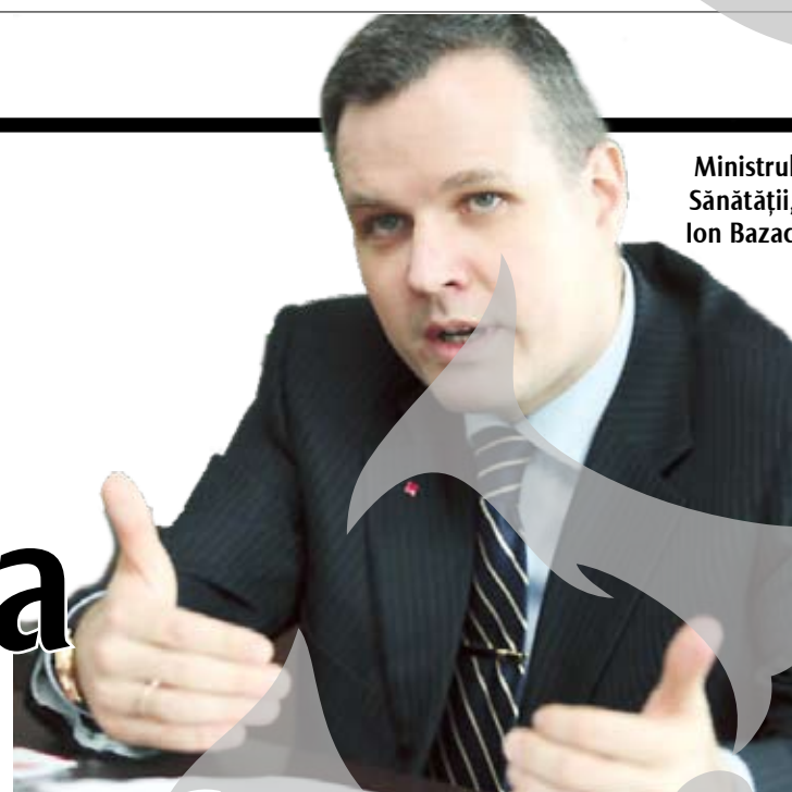
Ministrul Sănătății, Ion Bazac

În plus, femeia spune că a intrat în contact, în ultimele zile, cu 40 de persoane, a precizat minis-