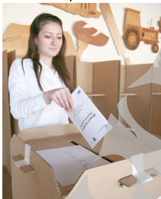
Prea puțini elevi au fost curioși să vadă cum este cu votul

≡ Asociația Pro Democrația a organizat, la Galați, simularea alegerilor europarlamentare cu elevii de liceu ≡ Chiar și aduși cu clasa și după o săptămână de promovare, prezența la urne a fost de doar 21,8 la sută! ≡ Cât de cool este să votezi?