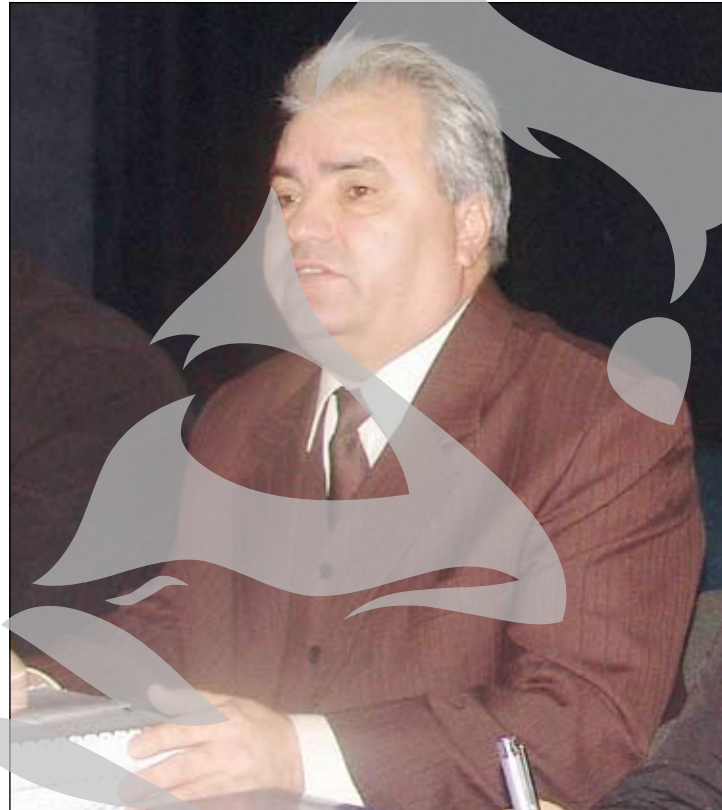
Dinu Gălcă, procurorul general al Parchetului de pe lângă Curtea de Apel Galați

- Că fenomene infracționale de genul celor amintite există, dar la Galați situația nu e scăpată de sub control, ca dovadă că i-am prins pe infractori. Nu e