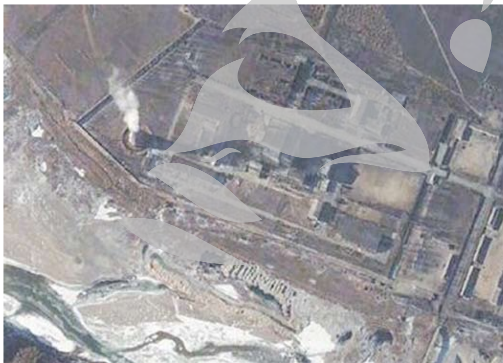
Phenianul anunța în aprilie că și-a repornit complexul de separare a plutoniului de la Yongbyon, dar, până în prezent, nu au existat indicii că uzina a fost repusă în funcțiune

Coreea de Nord a făcut mai multe teste de rachetă în Marea