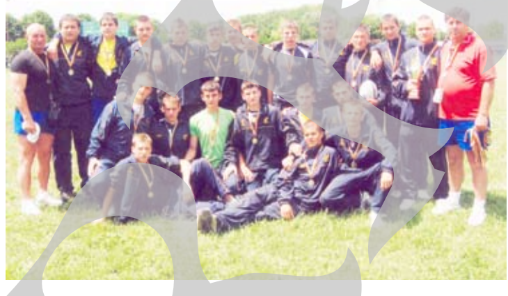
Medaliații cu bronz la "Naționalele" de rugby pentru juniorii III