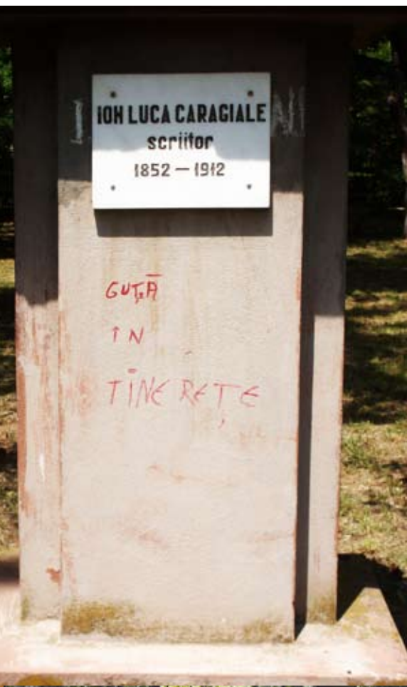
Caragiale n-ar rade la așa caval

Statui? Vedem o statuie din marmură neagră, ușor distrusă și nesemnată. O altă lucrare de artă, de la o tabără de sculptură, alcătuită din piese metalice cândva în mișcare, se odihnește ruginită în stratul principal de flori. La intrarea în grădină, două statui de piatră acoperite de mușchi și cu soclul ciobit sau mâncat de igrasie dau impresia că edilii au vrut cândva să umple parcul de statui, dar au trebuit să plece repede... Pe soclul lui Caragiale, cineva a scris: „Guță în tinerețe!” O fi presimțit ceva conu' lăncu, că a refuzat să fie