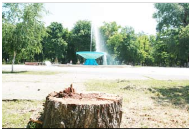
Apa curge, copacii se duc...