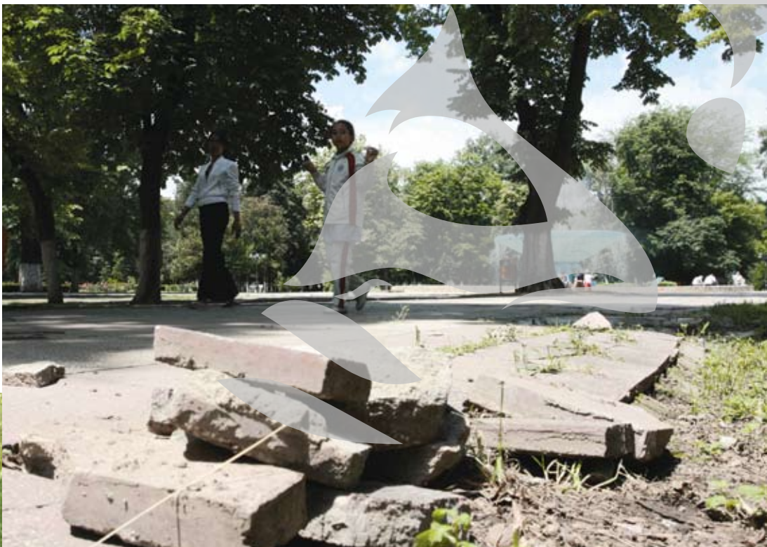
Pe aici au fost bombardamente?

Aleile principale, dalate acum câteva mandate, au crăpături sau chiar dale lipsă, acolo unde nu iese și iarba dintre ele. Aleile asfaltate sunt în unele locuri dămburi-dămburi, numai bune de antrenat pușcașii marini pen-