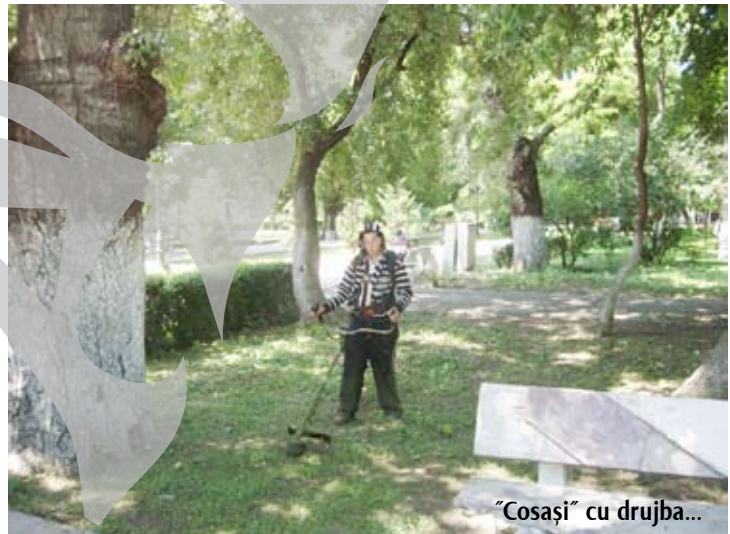
„Cosași” cu drujba...