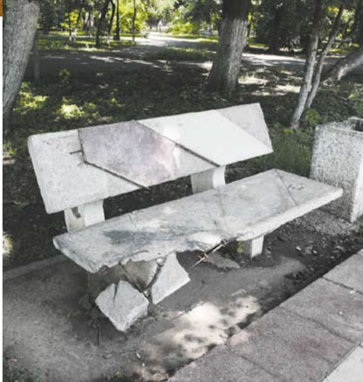
Până și piatra cedează!