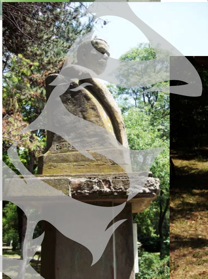
Tristețea lui Caragiale