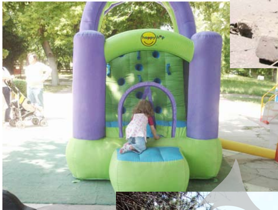
O realitate... gonflabilă