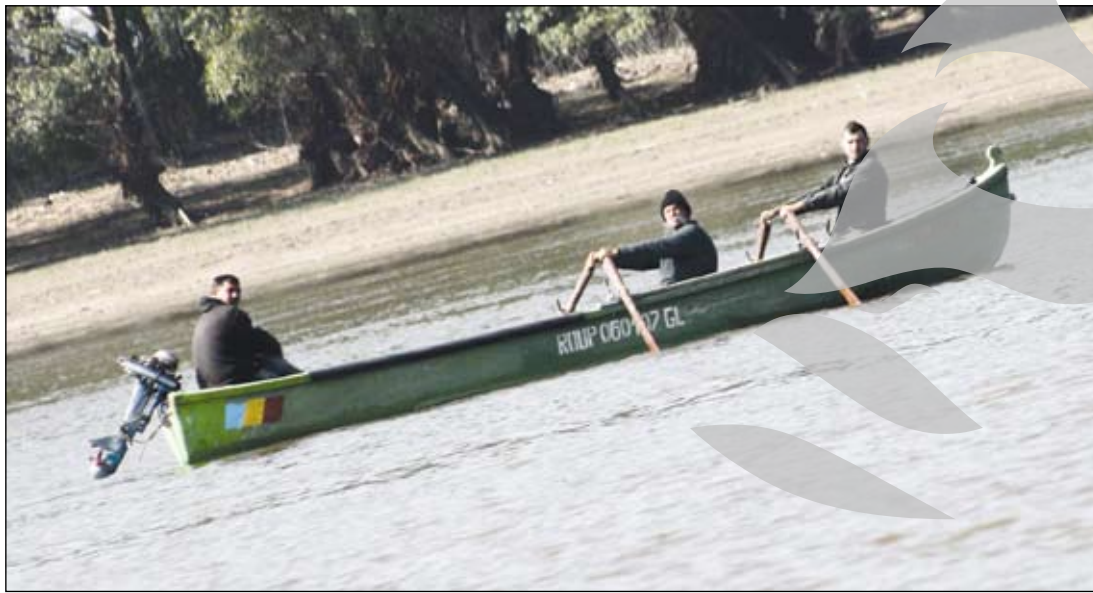
Din cauza "privatizării", putem vedea malul Dunării doar de pe apă...