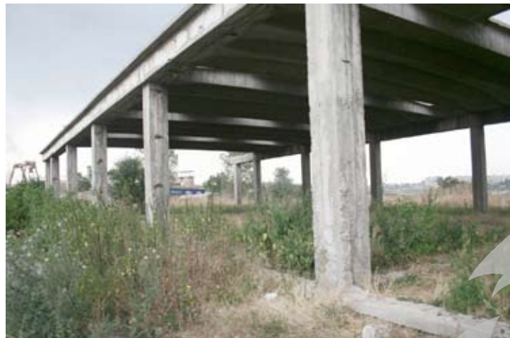
În fața zidurilor istorice tronează câteva monumente ale prostiei prezentului

stitui un punct de atracție pentru eventualii turiști. S-a propus preluarea acestor construcții în proprietate publică, urmând să se delimiteze zona, să fie amenajat un parc și chiar un centru expozițional. Mai e nevoie să spunem că nimic din toate acestea nu s-a făcut? Că presa trage cu regularitate semnale de alarmă cu privire la această zonă, iar autoritățile le ignoră? Că nu există nici măcar o idee, niciun proiect pentru reabilitarea acestei zone? Recent, în cadrul unei conferințe de presă, un politician anunța că nu s-a cerut niciun ban de la Ministerul Culturii. De către cine?