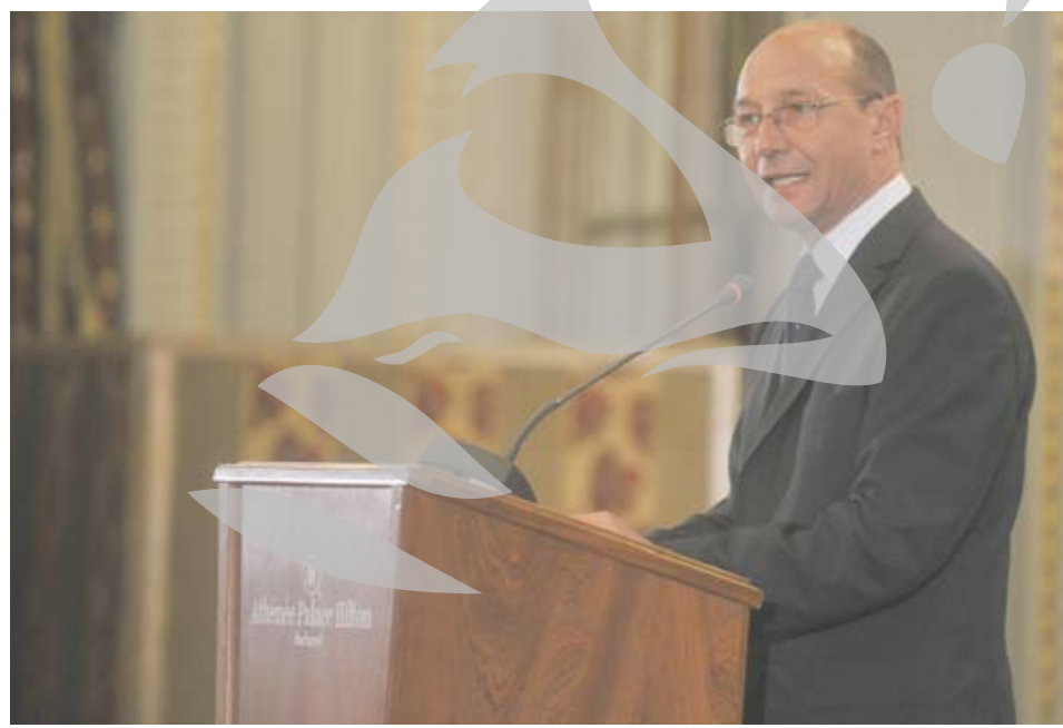
Șeful statului a participat la conferința "The Future of Social Change: 1989-2009: Visions and Perspectives after 20 Years of Transition".

oane, dintr-o populație totală de 21 de milioane. "Înseamnă că nu avem priorități în alocarea banilor publici. Originea risipei se află într-un comportament politic de natură populistă și în lipsa de transparență a stabilirii priorităților bugetare", a spus Băsescu. El a menționat că într-adevăr categoriile defavorizate, bătrânii, copiii, minoritățile, șomerii au nevoie de asistență socială, menționând însă că nu este posibil ca majoritatea populației să beneficieze de incluziune socială.