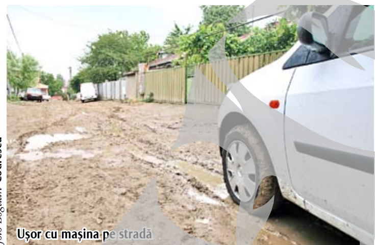
Ușor cu mașina pe stradă

O stradă pe care ai toate șansele să îți rupi picioarele sau să îți bagi nefericita mașină în service. Pentru că în cazul în care nu călărești o minune capabilă să bată drumurile forestiere sau să sară din prăpastie în povârnis, pe la vreo competiție sau alta de off-road, sigur ești un om mort.