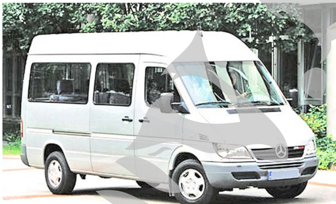
Mașină cu suspine

Apropo de acuzația că în acest furt ar fi implicați și polițiști de la Inspectoratul Județean de Poliție Galați - Serviciul Investigații Criminale