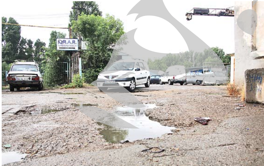
Prin gropi, de nevoie

Pe de altă parte, conducerea R.A.R. spune că a încercat să mute sediul instituției pe un teren adecvat, dar nu a găsit oferte nici la Primăria Galați, nici la primăriile din jurul municipiului: „Șefii de la București ne-au spus că banii există, numai noi să găsim terenul. În principiu, noi căutam un teren cu deschidere la șosea, iar așa ceva este imposibil de găsit la Galați. Am