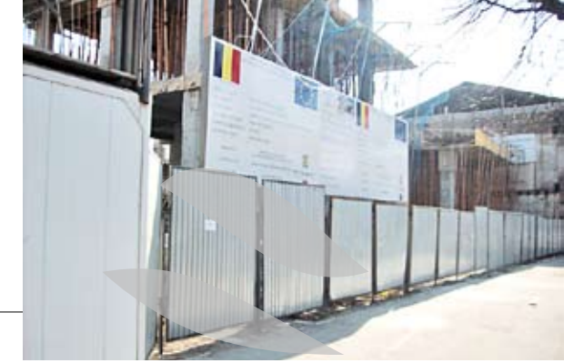
Un sfert din viitoarea clădire, în fața a trei zile hotărâtoare