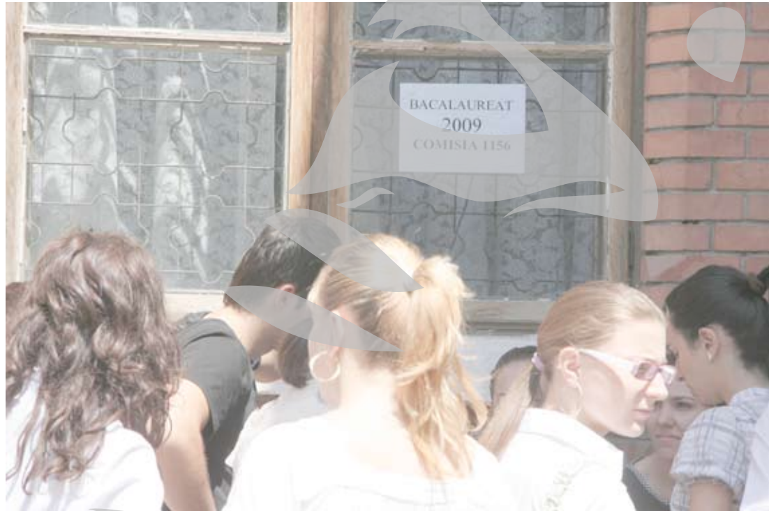
Candidații - așteptând să intre la prima probă

Ieri și astăzi, bacalaureatul a continuat cu a doua probă la oral, cea la limba modernă. Cei mai mulți candidați, peste 3.900, au ales să susțină proba la engleză, în jur de 1250 sunt testați la franceză, 28 s-au încumetat să-și demonstreze cunoștințele de germană, 6 au optat pentru italiană și doar 4 pentru limba rusă. Vineri, absolvenții de liceu intră la prima probă scrisă, cea la limba și literatura română.