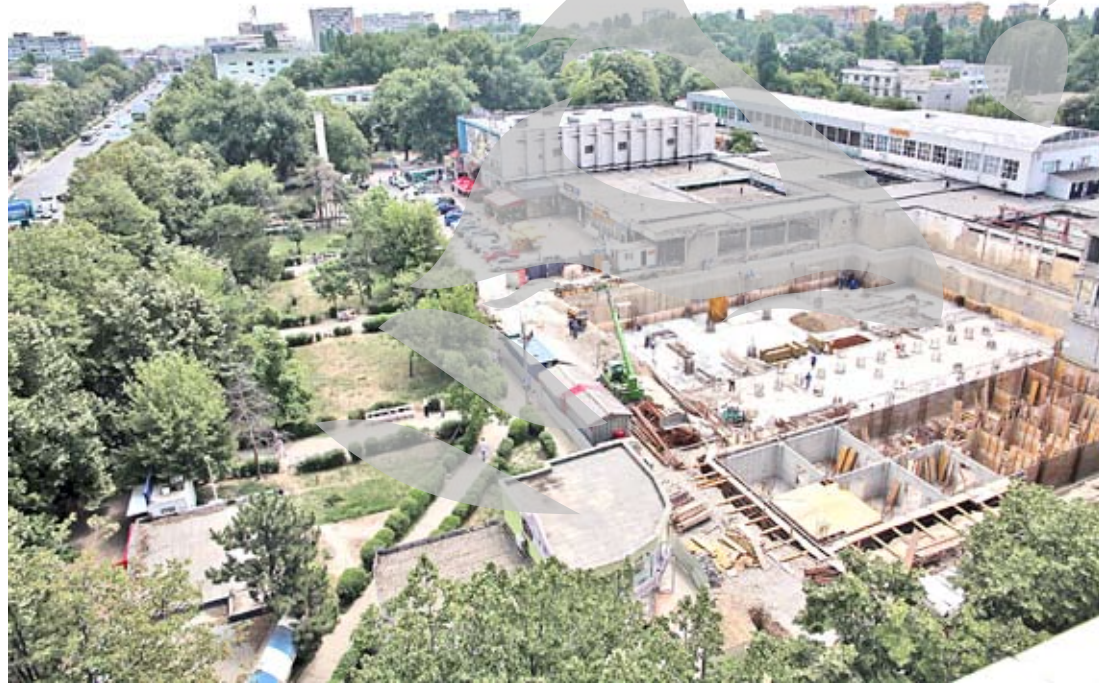
Fundațiile din planul secund vor găzdui și garajele subterane

Am apelat la proiectanții celor două imobile care se vor ridica în locul fostului magazin universal - unul dintre cele trei mari magazine din epoca comunistă, acum demolat. Arhitectul Dan Ujeucă, proiectantul imobilului din stânga, cel mai mare și mai înalt, ne-a spus că planurile sale prevăd să nu fie afectate nici strada, nici trotuarul și că verifică lucrările pentru a se și respecta acest lu-