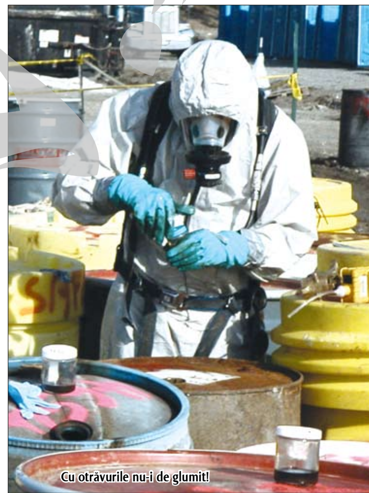
Cu otrăvurile nu-i de glumit!

≡ Bateriile auto, uleiurile uzate, resturile de solvenți și pesticide, filtrele de ulei și de motorină și ambalajele de produse periculoase trebuie predate acolo ≡ În caz contrar, amenda e de până la un miliard de lei vechi