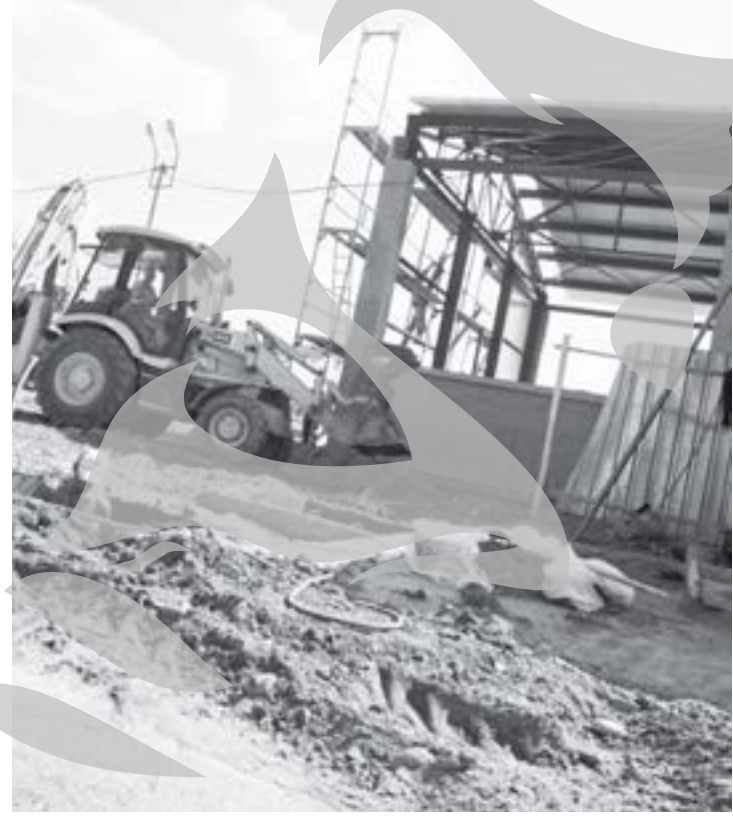
Miercuri se lucra de zor; nu se știe până când...

Din câte scrie și pe placa din fața șantierului, executant este SC UNICOM SA, iar termenul de execuție era iulie 2009. Data finală negociată cu responsabilii UE a rămas însă „30 și...” august, ne-a precizat primarul: „Într-o săptămână e gata. Acum e... ca la Verdun. Eu sunt adeptul