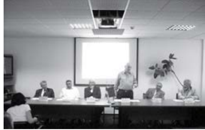
Primarul este nemulțumit de întârzierile de la Piața de Gros