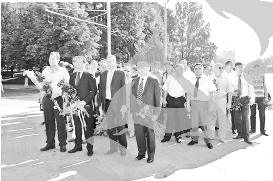
xul memorial Eternitatea. La ora 10.00, din Piața Marii Aduări Naționale din centrul Chișinăului a pornit un raliu automobilistic.

În urma violențelor postelectorale, a fost incendiată clădirea Parlamentului de la Chișinău. Deși arhivele păstrează copii, distrugerea Declarației de independență "reprezintă întreruperea procesului istoric".