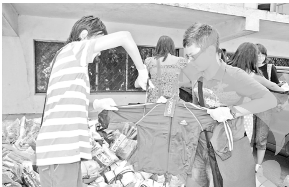
Copii ai distrus produse de firmă