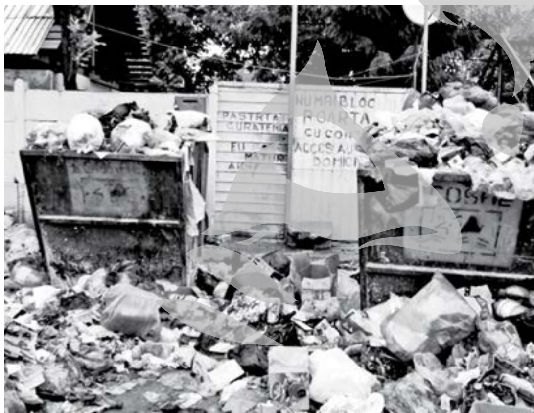
Punctul de colectare din Micro 17

Vinerea trecută ne-au sunat cititorii din Micro 39 sau din Țiglina II să ne întrebe de ce miroase orașul. Practic, un damf greu, de gunoi stătut, plutea din centru până în cartiere. Am întrebat și noi, însă părerile sunt diverse și un răspuns clar nu a reușit să ne dea nimeni. Se făceau presupuneri că, pe o pală de vânt, ar veni mirosul tocmai de la crescătoria de porci din Brăila sau că, din motive de lucrări ISPA, s-au descoperit canalizările gălățene și o parte din mizerie a fost dusă la containerele dintre blocuri. Sâmbătă și duminică am tot căutat explicații prin diferite locuri din oraș. Însă misterul „parfumului” care la începutul weekendului transformase „orașul cu miros de tei” în „orașul cu miros de gunoi” n-am reușit să-l dezlegăm. În schimb, ne-am lovit de alte realități la fel de urât mirositoare.