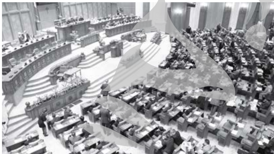
Birourile Permanente reunite ale Camerei Deputaților și Senatului au stabilit că atât prezentarea de către prim-ministru a legilor asupra cărora Guvernul își va asuma răspunderea, cât și discursul președintelui Traian Băsescu în fața plenului comun al Camerelor vor avea loc în aceeași zi

Lucrările Birourilor Permanente au fost marcate și de un incident, unei funcționare a Parlamentului făcându-i-se rău, cel mai probabil din cauza unei căderi de calciu, potrivit unei surse.