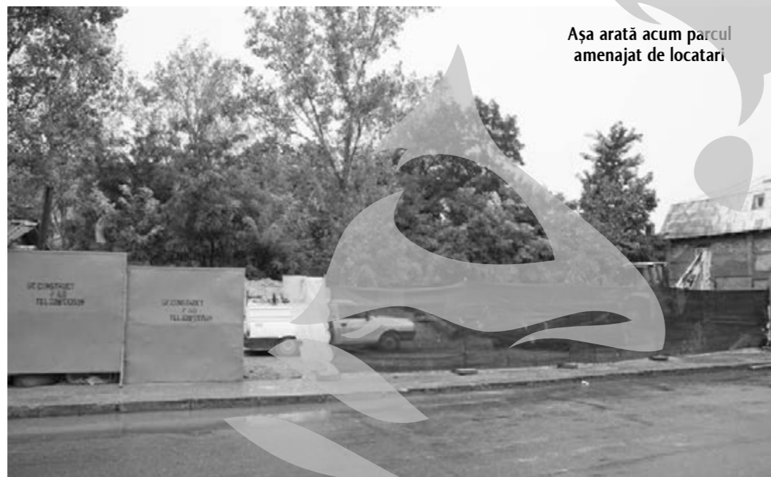
Așa arată acum parcul amenajat de locatari

Totodată, în nume personal, vă informez că pe 25 august a.c. m-am întors de la București cu acceleratul 10.571, care a sosit punctual la ora 20,18, numai că în fața gării nu era niciun autobuz al Transurb, doar taximetre și microbuze particulare. Primul mijloc de transport în comun pentru cei cu abonamente, a fost un microbuz al liniei 36, sosit câteva minute după gararea trenului. A urmat un 26 și abia după 15 minute un 22. În repetate rânduri,