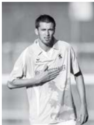
ce returul se va disputa la 24 noiembrie.

Adversara Unirii Urziceni din Grupa G a Ligii Campionilor, FC Sevilla, a învins, pe teren propriu, nou-promovata Real Zaragoza (scor 4-1), într-un meci din etapa a II-a a Primera Division. Campioana României va debuta la 16 septembrie, în deplasare, cu FC Sevilla, în timp