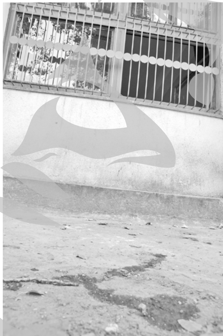
Sângele copiilor a rămas în curtea liceului

să-i trimitem”, ne spune mama băieților de 5 și 8 ani. Sunt alături și rudele fetelor de 7 ani, pentru că familia băiatului transferat la București a luat probabil calea Capitalei. Nici unii nu vor să li se facă poze, n-au nevoie de publicitate.