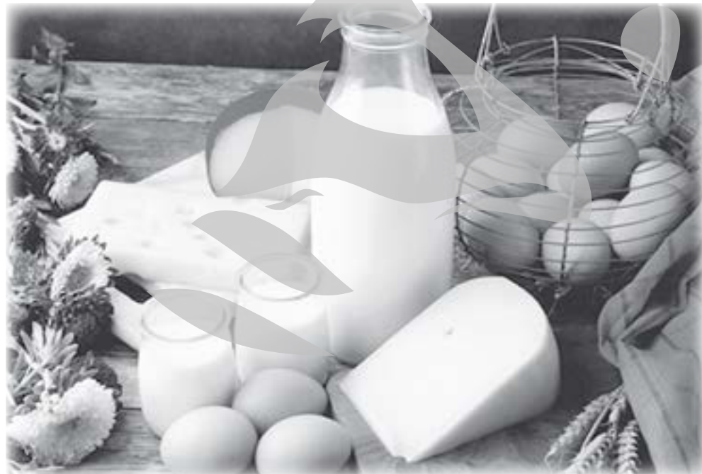
Multe dintre alimente pot provoca reacții alergice

Specialiștii spun că cel mai bun tratament al alergiei este evitarea alimentelor care o pro-