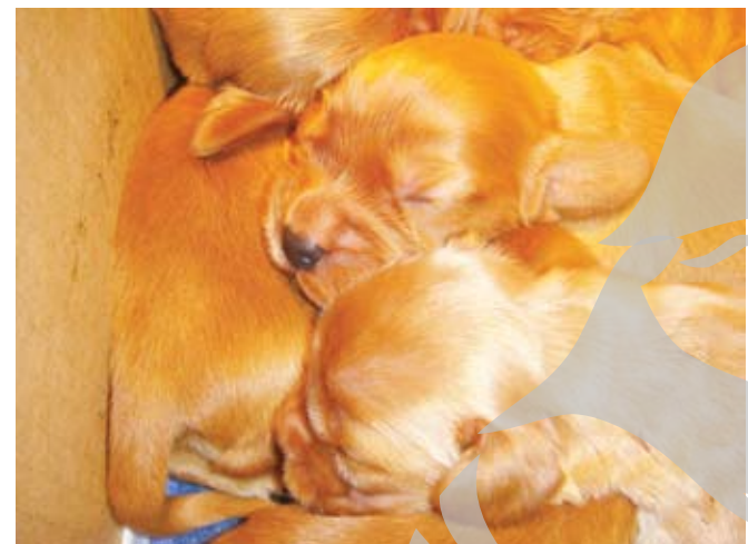
Dragoste de la primul lătrat

Sunt opt ghemotoace aurii de blăniță, cinci fete și trei băieți, din rasa cocker-spaniel, și au, pe lângă o mămică foarte iubitoare și grijulie, propriul blog http://cautamfamilie.blogspot.com . Cei opt bulgărași de aur roșcat drăgălași s-au născut la Galați, într-o noapte caldă de septembrie, acum zece zile. Abia intrați în lumea virtuală unde concurența e mare, cățelușii își petrec deocamdată aproape toată ziua dormind claie peste grămadă, la căldurică, iar în pauzele de nani, mănâncă pe rupte și mai plâng fiindcă n-au încă ochi. Peste o lună, însă, vor descoperi lumea în toată splendoarea ei. Cei opt pui visează să aibă o familie care să-i iubească, să aibă grijă de ei și să le ofere o viață frumoasă. V-ar plăcea să deveniți stăpânul unuia dintre pui? I-ați putea ajuta să-și găsească un cămin sau măcar o gazdă bună, simpatcă și iubitoare de căței? Dacă da, contactați-i cât mai curând pe adresa mail: heidi.spaniel@gmail.com.