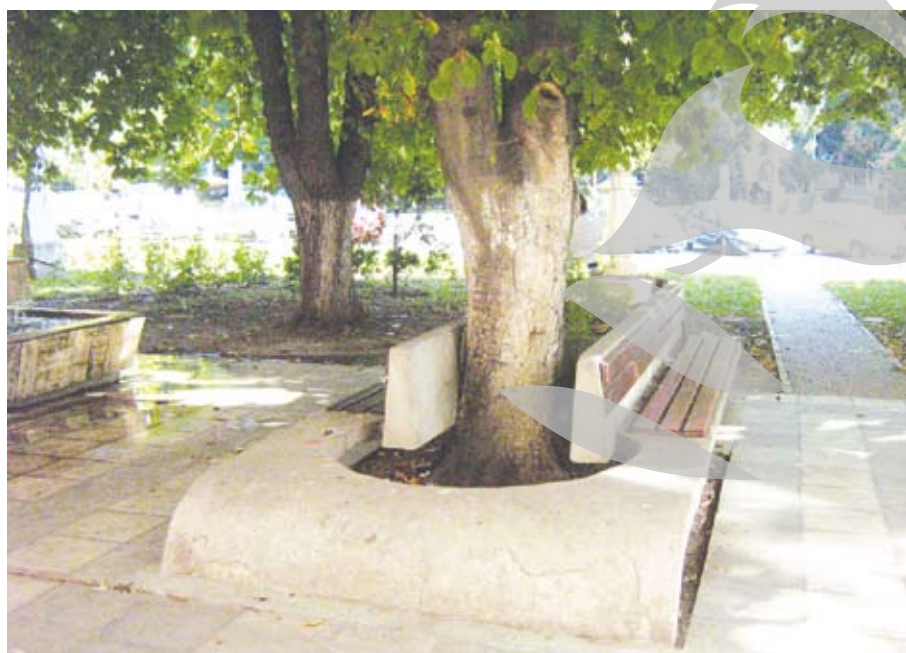
Zona care, susține doamna G.A., prinde viața la cele mai nepotrivate ore

Doamna G.A., o locatară a blocului L1 din Centru (zona Romarta Veche) ne-a sesizat la redacție faptul că pe băncile din fața scării în care locuiește își petrec timpul liber, până noaptea târziu, mai mulți tineri. „Fac mare gălăgie, țipă și spun cuvinte pe care eu nici nu îndrăznesc să le reproduc. Având probleme mari cu inima, trebuie să țin geamul deschis pentru că altfel simt că mă sufoc. În aceste condiții, abia dacă pot adormi după ora 1,00 noaptea, când pleacă ei. Și vin aici, cu gălăgie, de pe la ora 18.00. Și având în vedere starea mea, e tare greu”, ne povestește doamna. „La vârsta asta, unde să mă mai