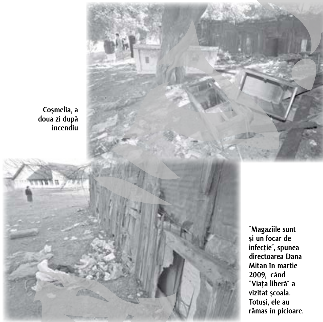
Coșmelia, a doua zi după incendiu

Cât privește povestea magaziiilor, se pare că acestea, posibile focare de infecție, ar fi trebuit demult puse la pământ, deoarece ele nu mai sunt funcționale de vreo cinci ani. În primăvara lui 2009 „Viața liberă” a mai scris despre Școala Nr. 1, în curtea căreia se adăposteau copiii străzii, atrași de adăpostul celor două coșmelii. Și atunci, fosta directoare susținea că Primăria ar trebui să le dărâ-