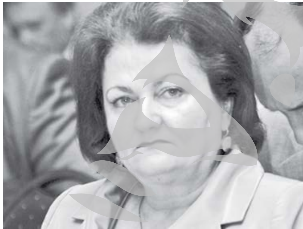
Președintele interimar al instanței supreme, Lidia Bărbulescu, a declarat ieri că judecătorii așteaptă măcar o formă incipientă a Pactului pe Justiție

în condițiile în care aceștia refuză constituirea birourilor electorale. Executivul poate adopta o ordonanță de urgență care să permită constituirea acestor structuri fără implicarea judecătorilor. Peste 6.000 de magistrați și-au încetat activitatea în ultimele trei săptămâni, nemulțumiți de legea unică de salarizare pentru care Executivul și-a asumat răspunderea în fața Parlamentului. În acest timp, termenele de judecată în zeci de mii de dosare au fost amânate. Luni trebuie să aibă loc tragerea la sorți pentru desemnarea în Biroul Electoral Central a cinci judecători de la Înalta Curte de Casație și Justiție. După acest pas, are loc tragerea la sorți pentru desemnarea judecătorilor care vor conduce birourile electorale de la nivelul circumscripțiilor.