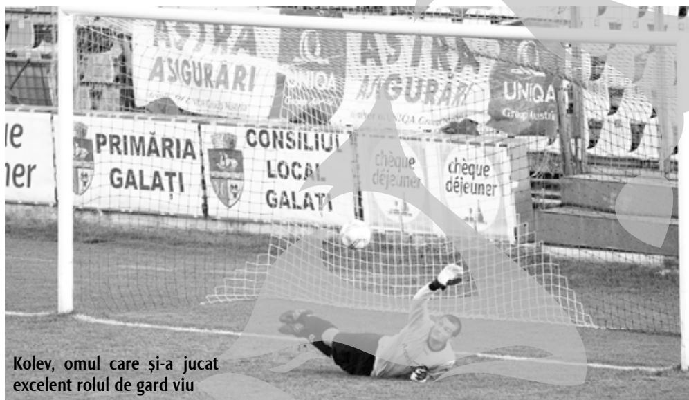
Kolev, omul care și-a jucat excelent rolul de gard viu

foto Florin Novac design@viata-libera.ro