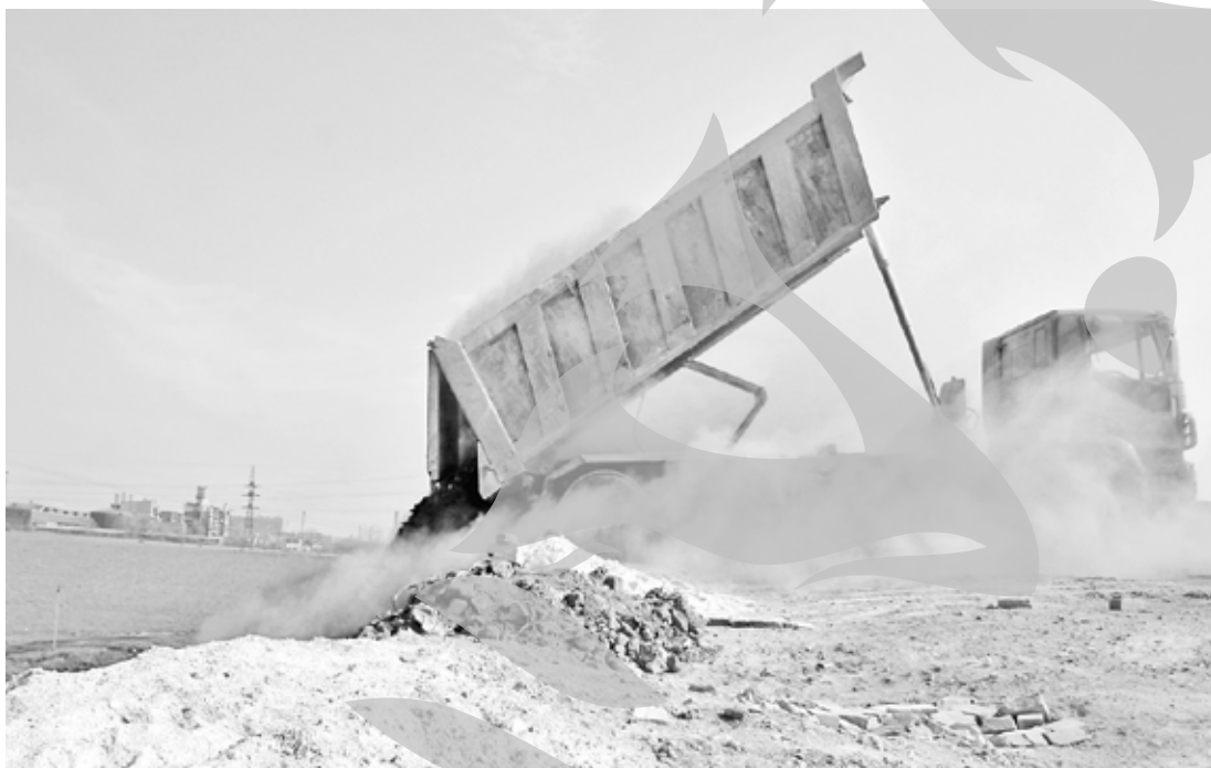
Aici sunt drumurile dumneavoastră! Viitoare...