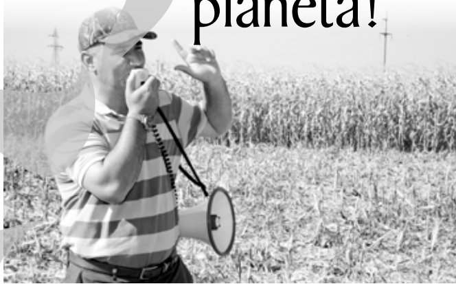
► Recoltare la scenă deschisă, după gustul și preferințele agricultorilor