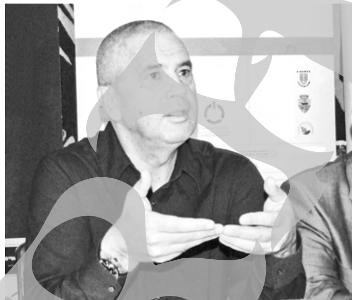
Ministrul Mediului spune că termenele n-au fost renegotiate

De teama infringementului, Ministerul Mediului va sprijini primăriile pentru închiderea gropilor de gunoi