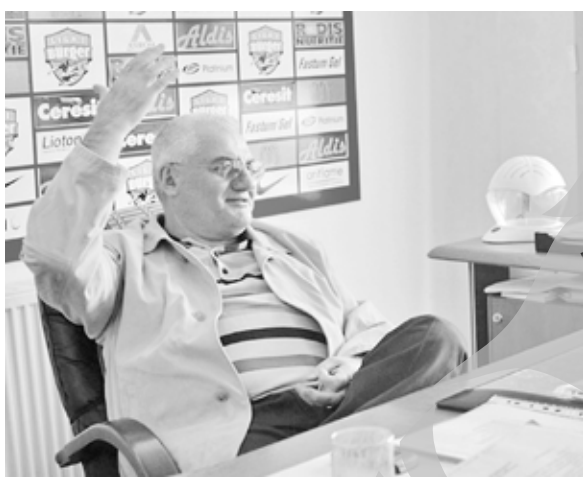
Dumitru Dragomir sau sămânța de scandal din fotbalul nostru...