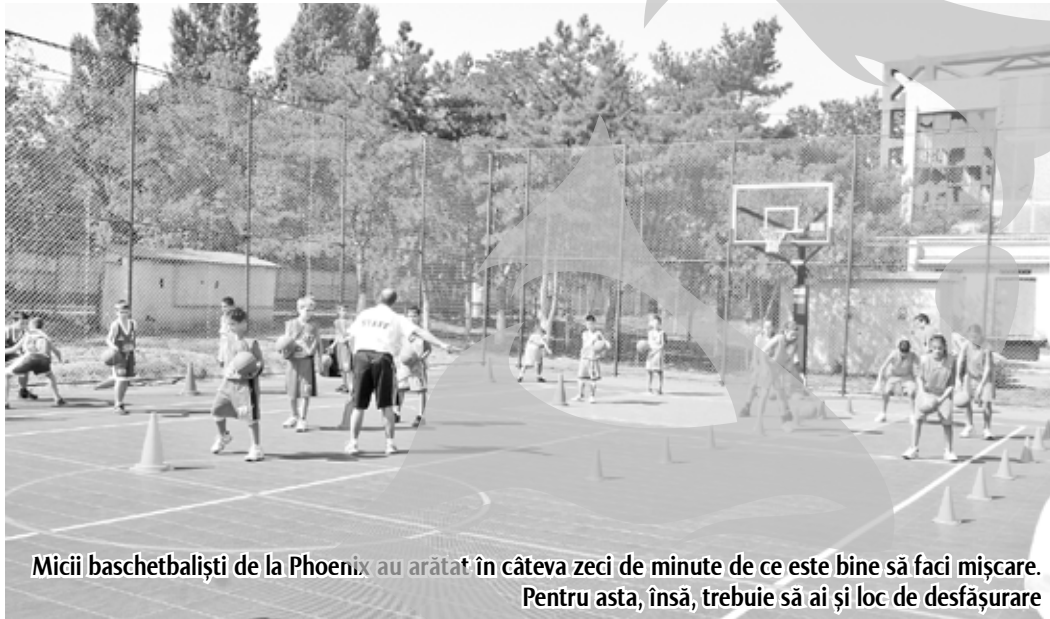
Micii baschetbaliști de la Phoenix au arătat în câteva zeci de minute de ce este bine să faci mișcare. Pentru asta, însă, trebuie să ai și loc de desfășurare

leri s-au și inaugurat suprafețele despre care ați citit recent în „Viața Liberă”. Oficialități, antrenori și profesori de educație fizi-