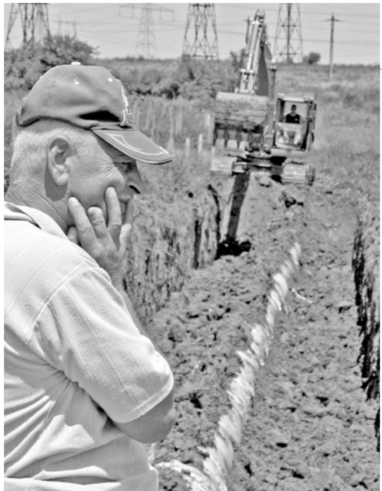
Și apa se duce pe... apa sămbetei?!

Ieri, la BVB Nimic în plus, nimic în minus