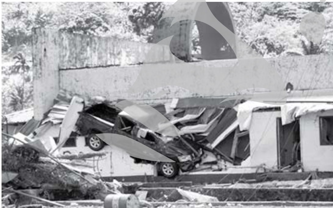
Zeci de persoane sunt date dispărute

Cutremurul a avut loc la ora locală 6:48, iar epicentrul a fost localizat la circa 200 kilometri sud-vest de Apia. Imediat a fost emisă o alertă de tsunami pentru zona Pacificului de Sud. Samoa, Noua Zeelandă și Hawaii au fost printre teritoriile vizate. Seismul a fost urmat de un tsunami 20 de minute mai târziu. Potrivit oficialilor, valul a atins 7,5 metri. Arhipelagul Samoa este format din statul independent Samoa, ce regrepează circa 219.000 locuitori, și Samoa Americană, care are 65.000 locuitori, teritoriu al Statelor Unite.