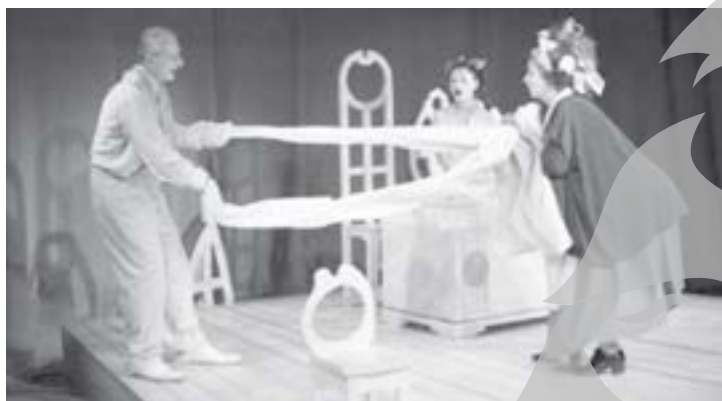
Spectacolul „Lecția” al celor de la Teatrul „I.L. Caragiale” din București e una dintre cele mai scumpe reprezentații

Anul acesta nu vor mai fi puse întreg Festivalul de Comedie. în vânzare abonamente pentru Spectatorii își vor putea achiziți-