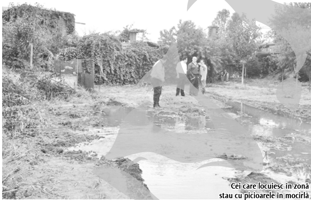
Cei care locuiesc în zonă stau cu picioarele în mocirlă

să pentru proiectul ISPA cu pricina este împânzită de astfel de țevi secundare montate de către cei din zonă și care se înțeapă în magistrala celor de la Combinat. Acestea se pot rupe oricând, dar, cum e de așteptat, nimeni nu vorbește acum despre asta. Discuțăm însă despre un furt, așa că în această situație poliștii ar trebui să verifice care este situația. Până acum, însă, păgubiții - în cauza de față cei de la ArcelorMittal - nu au înaintat o sesizare în baza căreia să înceapă cercetările, după cum ne-a