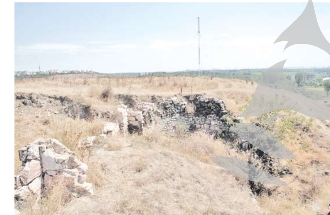
Trecutul așteaptă să fie descoperit la Barboși

Săpăturile arheologice de la castrul roman arată că în acest loc a existat mai întâi o cetate dacică, întărită cu un val de pământ. Datată undeva între sfârșitul secolului al II-lea, începutul primului secol înainte de Hristos, cetatea dacică a sfârșit în urma unui incendiu puternic.