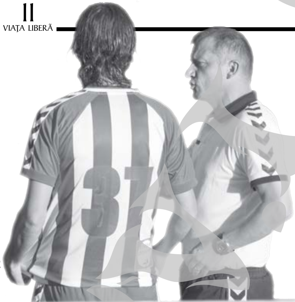
Dorinel și jucătorii săi n-au cum să evite subiectul banilor, deși mai importante par punctele și locurile din clasament

foto Florin Novac design@viata-libera.ro