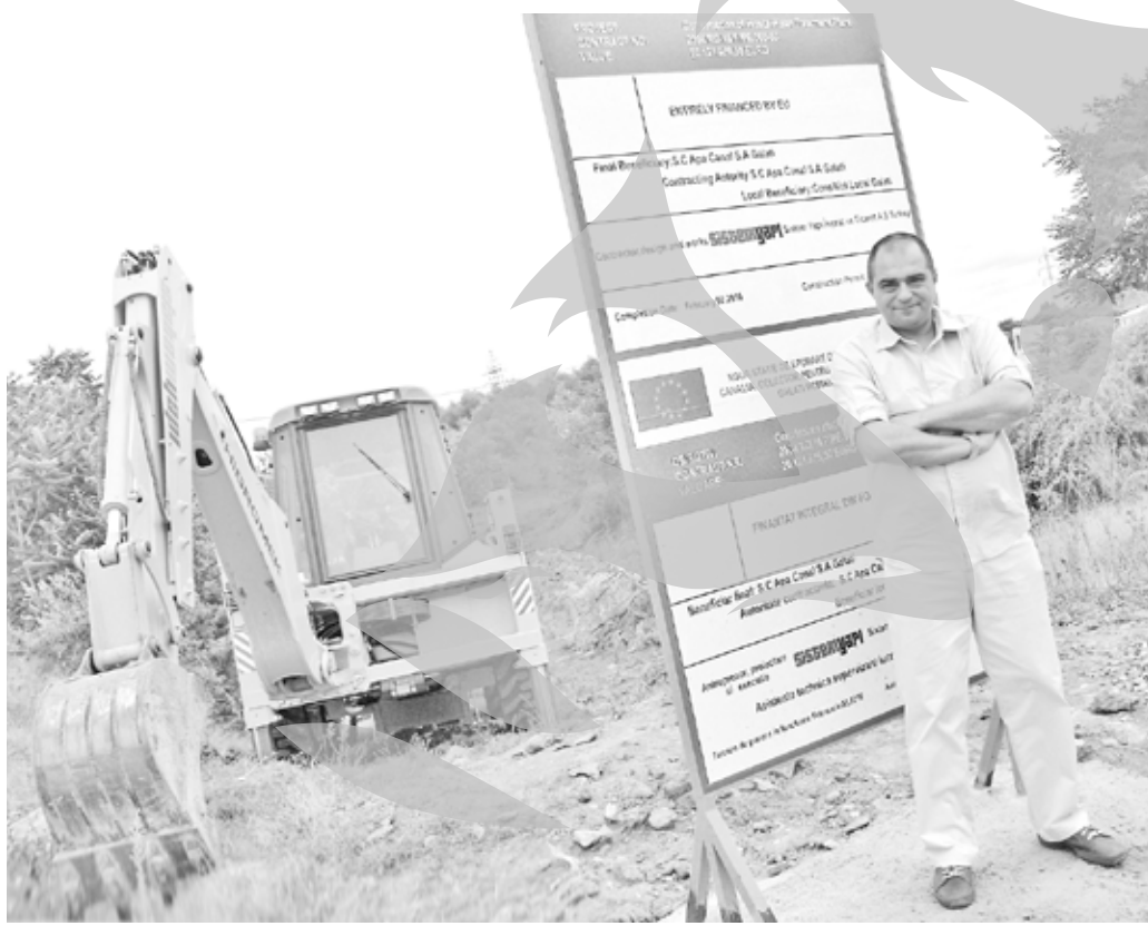
Viceprimarul, pe unul dintre șantierele ISPA