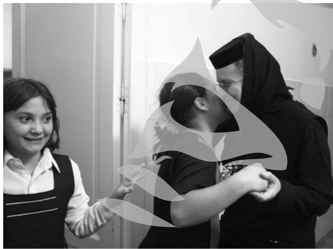
Îmbrățișare de maică

Nu mare ne-a fost mirarea când, deunăzi, în acest an de criză economică, am găsit gata ridicat în curtea actualului