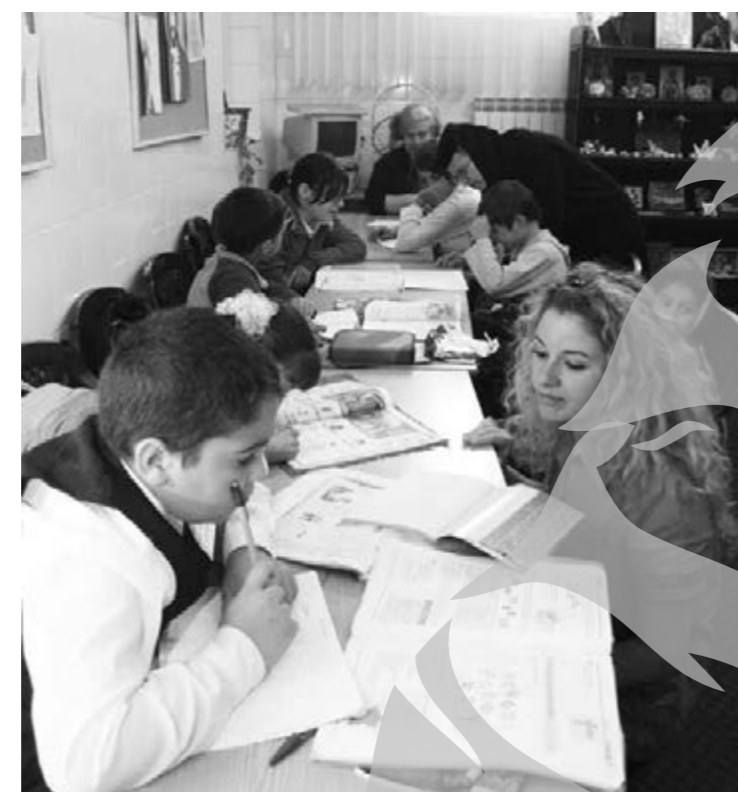
Acum e liniște

Alți 65 de copii primesc servicii "after school"