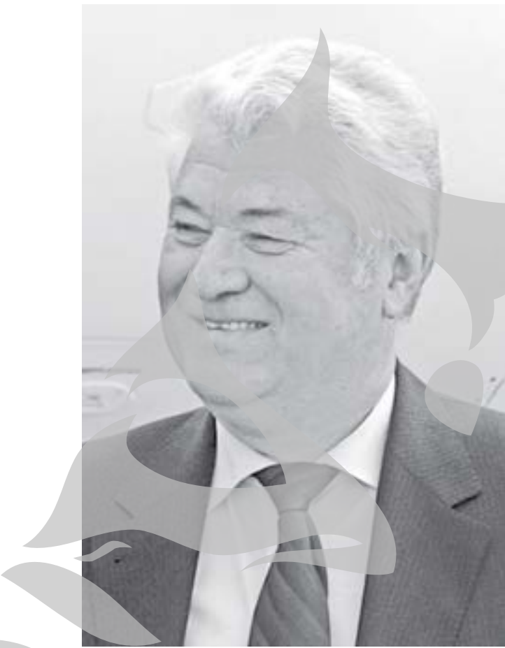
Liderul comuniștilor, Vladimir Voronin

Președintele Republicii Moldova este ales cu 61 de voturi, ceea ce reprezintă trei cincimi din numărul total de deputați din Parlament. Nicio forță politică de la Chișinău nu deține însă suficiente mandate pentru alegerea viitorului șef al statului. Alianța pentru Integrare Europeană are 53 de deputați, iar Partidul Comuniștilor 48. Astfel, coaliția liberal-democrată mai are nevoie de opt voturi, iar comuniștii de 13. Potrivit Constituției, alegerile pentru un nou președinte al țării se organizează în termen de