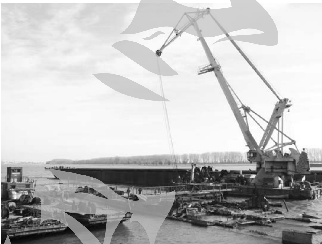
Operațiunile de ranfluare ale epavei sunt în întârziere

fără aplicarea unor penalități. Iată că și cele trei luni de prelungiri au trecut și mai este destul de lucru la epavă. „Ei lucrează acum la o nouă bucată din navă, dar cel mai probabil nu vor reuși