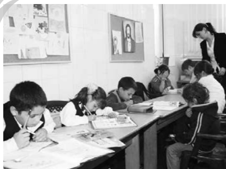
Se fac temele...