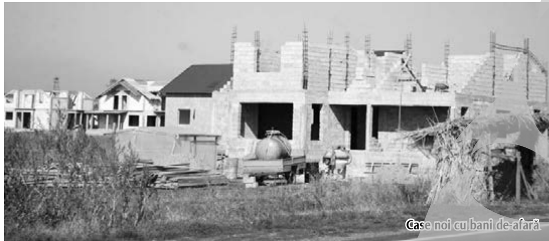
Case noi cu bani de-afară