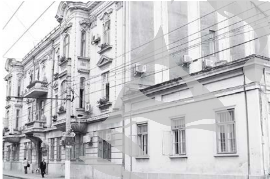
Primăria vrea să majoreze taxele

„Ideea îmi aparține și mi-a venit în urma scrisorilor primite de la cetățeni, care spun că în loc să avem treabă cu câinii comunitari, mai bine am vedea ce se întâmplă cu cei care au câini, cât vițierii, în apartamente și în urma cărora rămân pe scara blocului numai mierii. În ultimii doi ani am primit săptămânal câte două scrisori de acest gen, ne-a spus