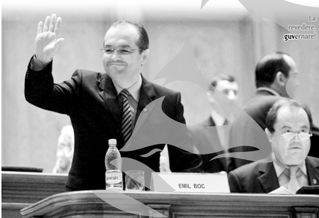
La revedere, guvernare!

Independent de consultările dintre președintele Traian Băsescu și partidele politice, au loc negocieri și între partidele parlamentare, fiecare încercând