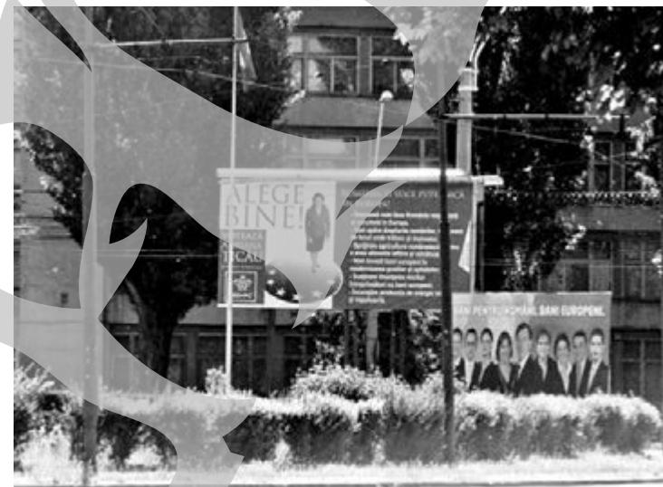
Una din zonele în care PD-L susține că sunt panouri electorale amplasate ilegal

„De această dată nu o să le mai meargă partidelor politice, nici altora și nici PSD-ului, să împânzească orașul cu afișe electorale”, a amenințat primarul, subliniind că nu va face discriminare și va sancționa partidele la orice abatere, chit că va fi vorba de partidul său!