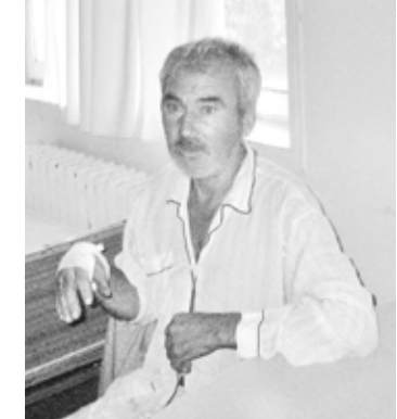
tului medico-legal al bărbatului internat, după care se vor lua măsurile care se impun”.

Potrivit purtătorului de cuvânt al Inspectoratului Poliției Județene Galați: „Oamenii legii i-au audiat pe cei doi băbăți, care însă nu au recunoscut că au pătruns în curtea victimei. Ambii sunt recidiviști. În acest moment ne aflăm în așteptarea certifica-