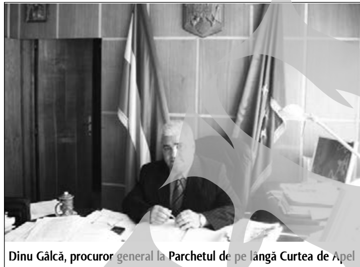
Dinu Gălcă, procuror general la Parchetul de pe lângă Curtea de Apel

Analiza activității din trimestrul III a procurorilor Parchetului de pe lângă Tribunalul Galați, precum și din unitățile subordonate de pe lângă judecătoriile Galați, Tecuci, Tg.Bujor și Liești a relevat, încă o dată, o realitate arhicunoscută. Numărul de cauze de soluționat este, de la an la an, tot mai mare, Galațiul fiind mereu pe primele locuri la acest capitol.