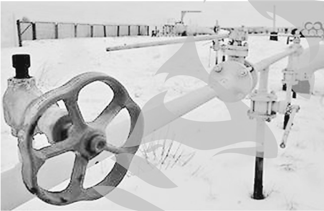
Suspendarea tranzitului petrolului rus, via Ucraina, este provizorie

unde țigeli este livrat cu vaporul în țările din zona mediteraneană. După ce alimentarea cu curent electric va fi restabilită, transportul petrolului va fi reluat. Cel mai târziu astăzi, au dat asigurări oficialii. Circa o cincime din livrările de petrol rus către Europa tranzițază Ucraina, potrivit experților ucraineni. Vestul fostei republici sovietice se confruntă cu un val de intemperii. Ploi abundente, ninsoare și rafale puternice de vânt au provocat întreruperea alimentării cu energie electrică în aproape 1.200 de localități, dintre care 700 în regiunea Lvov, cea mai grav afectată.