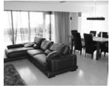
apartamente Faleză, blocuri noi și vile. 0722642700. (10/09/mr/11/NC-215288)

• Apartament mobilat sau nemobilat, 100 euro. 0752556879, 0236463737. (02/09/bc/21/NC-151257) • Apartamente 1 camera lux, Faleză, regim hotelier. 0744793223. (000975/NC-154734) • INCHIRIEM GARSONIERĂ ȘI APARTAMENT. 0236475479. (10/09/cs/08/NC-155764) • Inchiriez apartament. 0236471202, 0755.361242, 0722.317309. (10/09/cs/03/NC-187046) • INCHIRIEM GARSONIERĂ ȘI APARTAMENT. TELEFON: 0336886028, 0755979336. (10/09/cs/04/NC-187050) • Apartament mobilat /nemobilat. 0742634633. (10/09/bc/2/NC-213434) • P.f. inchiriez apartament 3 camere de comandat, etaj I, Mazepa II, zona bănci. Tel. 0722694001. (001795/NC-213701) • Inchiriez apartament două camere, mobilat, AC, CT, str. Portului. Tel. 0754665713. (007860/NC-213711) • Primesc în gazdă două fete angajate. 0768540641. (001918/NC-214399) • Inchiriez apartament două camere, Mazepa. 0729034335. (008063/NC-214483) • Primesc în gazdă 2 fete, Țiglina I, condiții bune. 0788415639. (002300/NC-215228) • Ofer spre închiriere sau vânzare