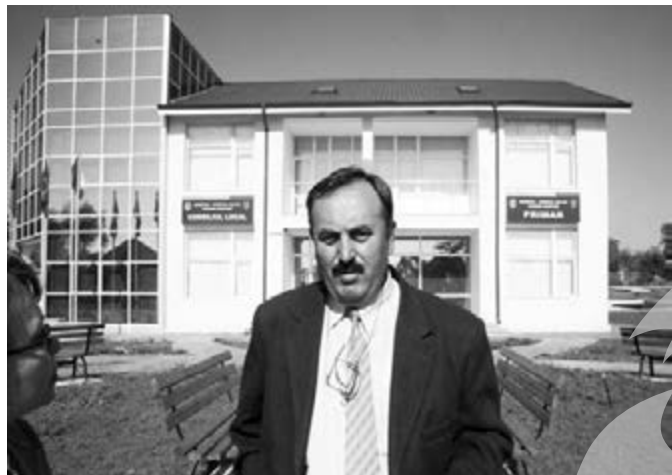
Primărie de trei stele europene

mijlocul camerei”, ne-a explicat viceprimarul.