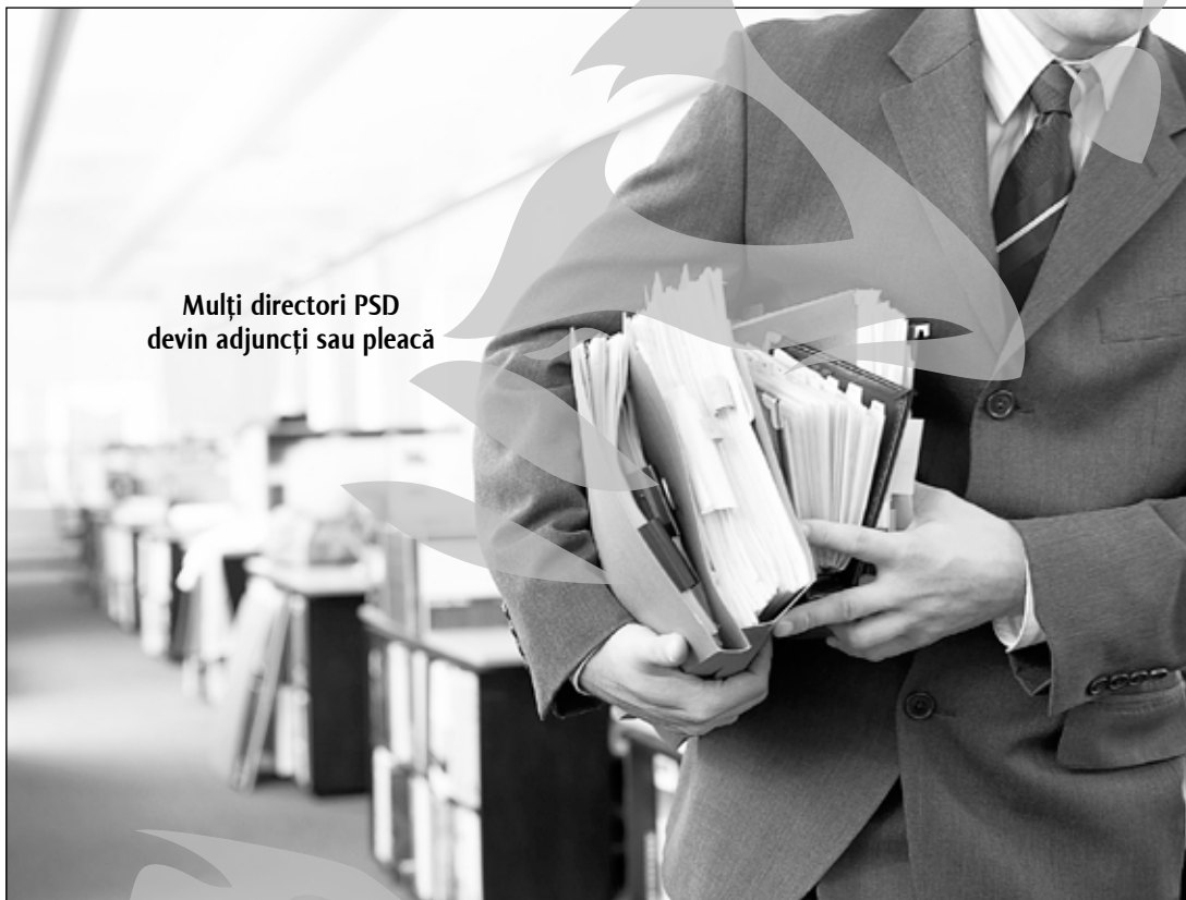
Mulți directori PSD devin adjuncți sau pleacă