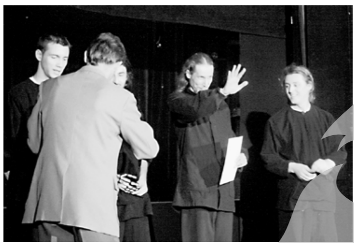
Tinerii actori din Botoșani, la finalul reprezentației