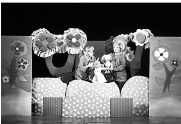
Spectacolul teatrului din Chișinău