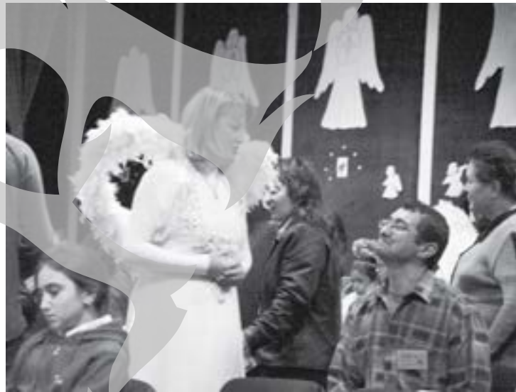
„Îngerii” le vorbesc gălățenilor