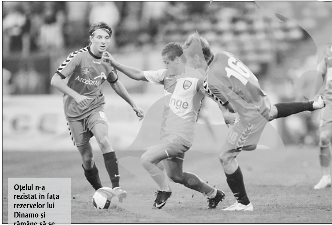
Oțelul n-a rezistat în fața rezervelor lui Dinamo și rămâne să se concentreze doar pe campionat

Și după pauză s-a păstrat senzația că Oțelul poate să combine mai mult la mijloc, dar prin intrarea lui Torje și Alexe, titulari de drept, Dinamo a inclinat tehcianului roș-alb-allele din meciul de campionat – nicăieri în fața lui Paraschiv nu s-a repetat! – iar performanța de a trece în sferturile de finală ale „Cupei României” s-a scurs odată cu ploaia săcâtoare din cartierul Ștefan cel Mare al Capitalei. Oțelul a lăsat mereu senzația că știe cum să-și trimită galonatul adversar la culcare, dar i-a lipsit practica. Cu teoria mergi până în faza națională a olimpiadei de chimie sau matematică, nu și în etapele superioare ale așa-zisei competiții KO.