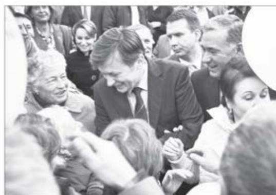
Ați vorbit de reducerea taxelor. Toată lumea spune însă că taxele nu se pot reduce tocmai din cauza FMI. Cum veți pune în aplicare aceste reduceri, fără să periclitați bugetul?

Cauza e strategia economică aplicată tot acest an de Traian Băsescu, cel care a condus guvernul, cel care a fost strategul anticriză al României.