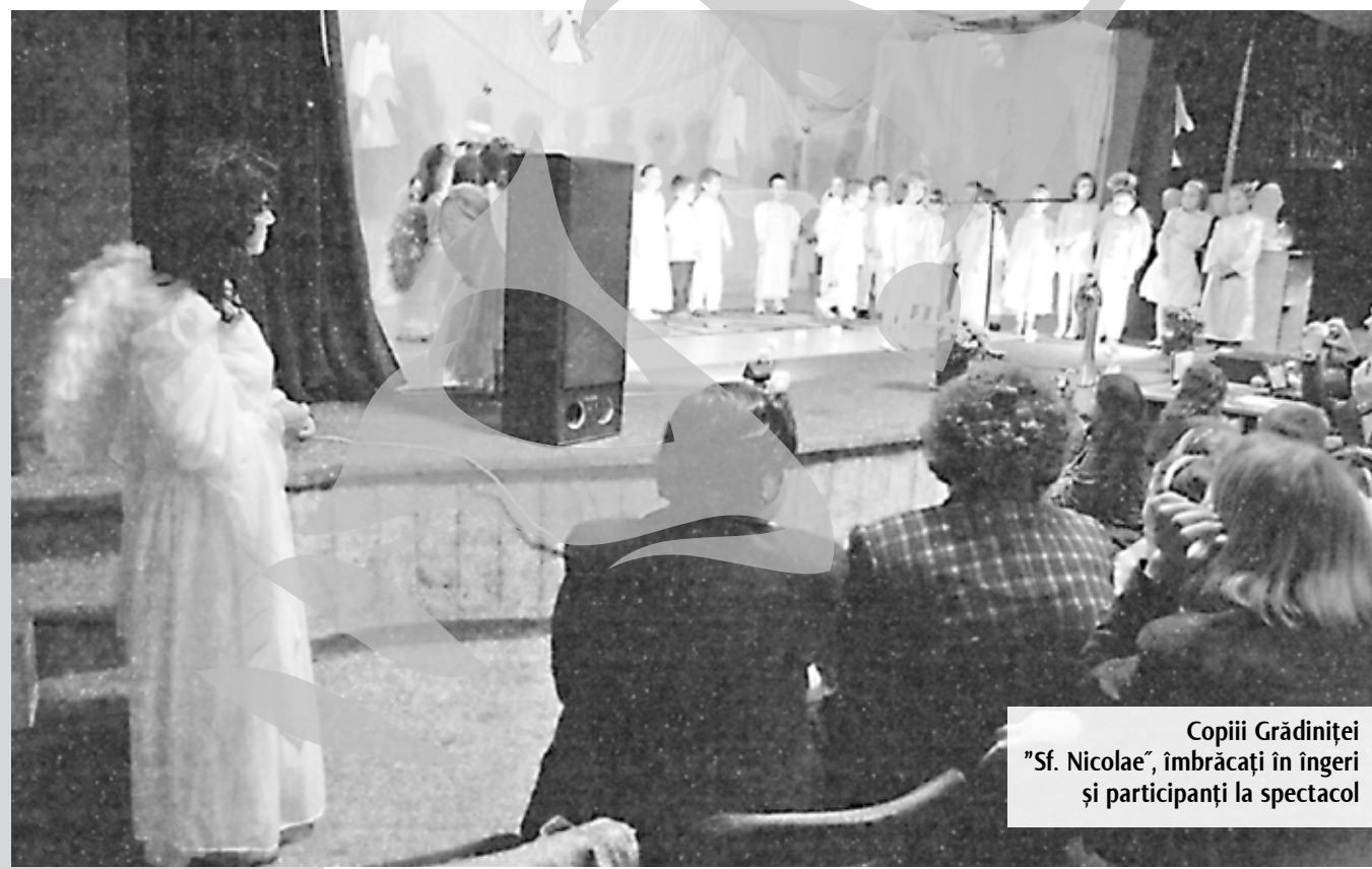
Copiii Grădiniței „Sf. Nicolae”, îmbrăcați în îngeri și participanți la spectacol

„MISA folosește copiii de grădiniță și școlă primară în spectacole gălățene? Misanii - dați în vileag de o fostă adeptă, care a avertizat „Viața liberă” și grădinițele participante la „Săptămâna îngerilor”? O săptămână întreagă de „îngereală”, cu copiii mici, aduși de părinți și educatori la sala SIDEX, din Tâgliba? MISA promovează „Săptămâna îngerilor”, dar și filmele porno în care joacă „îngerașele”? Bivolaru a tradus cărțile lui Jakob Lorber, recomandate de site-ul angelinspir.ro, care anunță „Săptămâna îngerilor” la Galați? Grădinița „Piticot” și-a retras copiii din spectacol? Organizatorul „Săptămânii îngerilor” neagă legăturile cu MISA? MISA - adică prostituție, filme porno, „Săptămâna îngerilor”, videoclipuri, dans la bară. Dar și copii?! Promovată pe site-ul MISA, „Săptămâna îngerilor” se întâmplă în 2009 și la Galați, exact în această perioadă. Participanții - în primul rând copii preșcolari și de clasele I-IV, învățați de cadrele didactice să cânte „Înger, îngerașul meu” pe ritmuri de rock'n'roll și aplaudați de părinții neștiutori, chemați, pare-se, la un fel de serbare