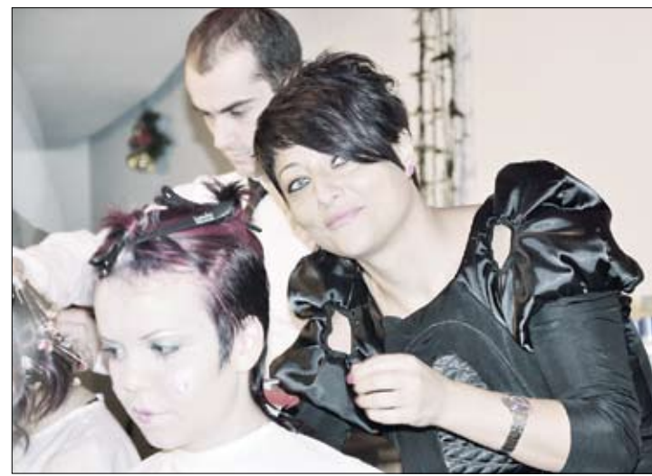
Anul viitor se vor purta tunsorile nonconformiste

„Dadaismul coboară din literatură în saloanele de coafură”