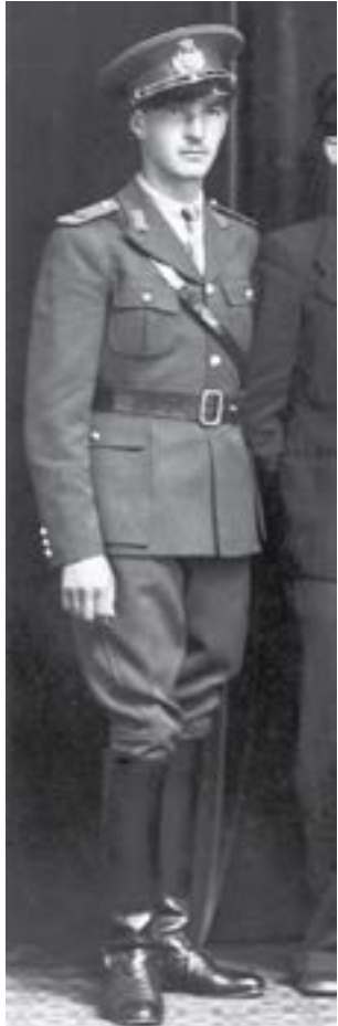
Generalul Brezeanu nu are încă epoleți...