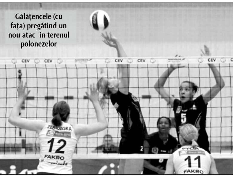
Gălățencele (cu față) pregătind un nou atac în terenul polonezelor