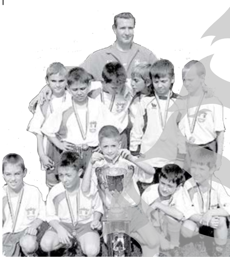
În fotografie - câștigătorii zonei de la Techirghiol, care vor reprezenta fotbalul juvenil gălățean la turneul final