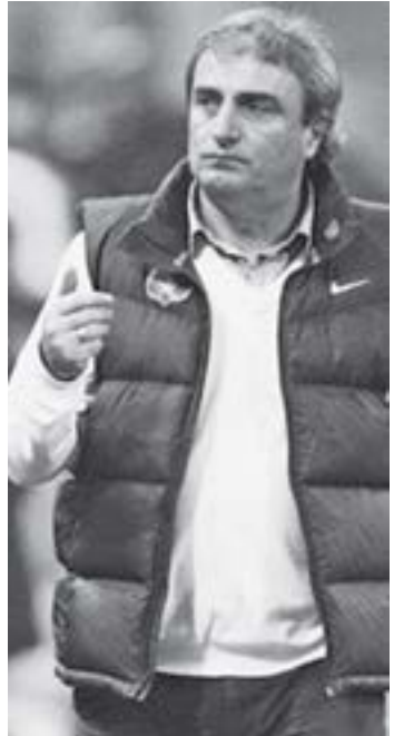
Diego Maradona, suspendat de FIFA, nu poate participa la tragerea la sorți de mâine, deși presa locală a scris că el ar putea merge în calitate de consultant TV.