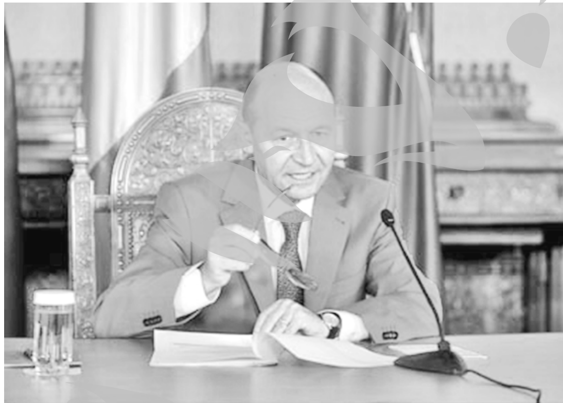
Traian Băsescu a promulgat legea care abilităază Guvernul demis să trimită bugetul Parlamentului

și legea responsabilității fiscale. Senatorul PD-L Iulian Urban a propus în plenul Senatului un amendament care a fost înșușit de toate grupurile politice, în care se prevede că, prin derogare de la prevederile alin. 3 din lege, în situații extraordinare a căror reglementare nu poate fi amânată, Guvernul demis poate iniția proiecte de lege pentru ratificarea unor tratate internaționale și proiecte de lege privind bugetul de stat și bugetul asigurărilor sociale de stat, precum și proiectul legii responsabilității fiscale.