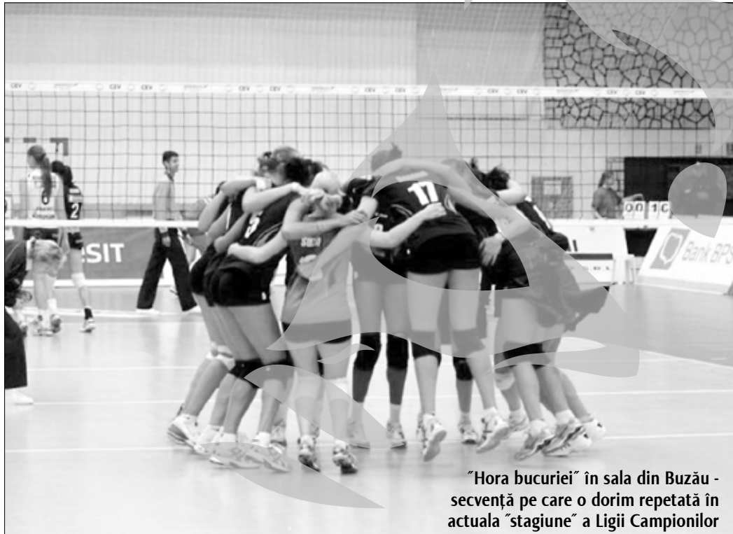
„Hora bucuriei” în sala din Buzău - secvență pe care o dorim repetată în actuala „stagionă” a Ligii Campionilor

Antrenorul echipei din Galați, Zoran Terzici , a declarat că formația sa are șanse să meargă mai departe în această competiție. „Fiecare meci este dificil, și cu atât mai mult cel