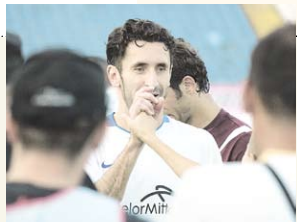
design@viata-libera.ro

Adresa redacției: str. Domnească nr. 68 TEL 460 620, FAX 471 028 redactie@viata-libera.ro