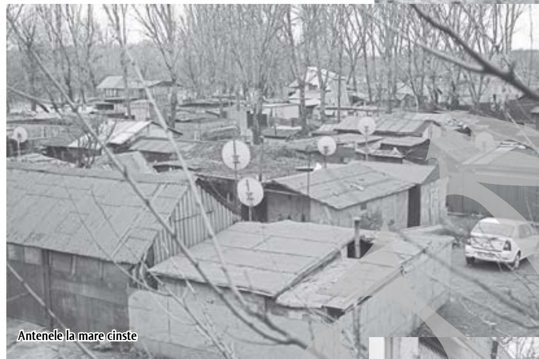
Antenele la mare cinste

ti cu ușurință aceia care ar trebui să fie preocupați de una singură, concentrate în câteva sute de metri pătrați noroioși.