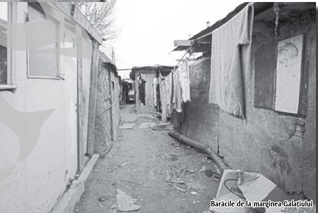
Barăcile de la marginea Galațiului