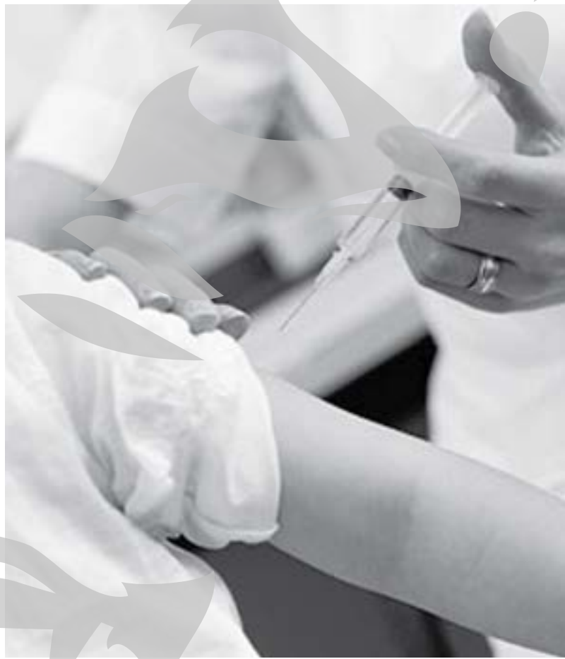
Vaccinări pentru orice eventualitate

Daily Mail amintește că în august la liniile de diagnosticare lucrau inclusiv adolescenți de 16 ani.