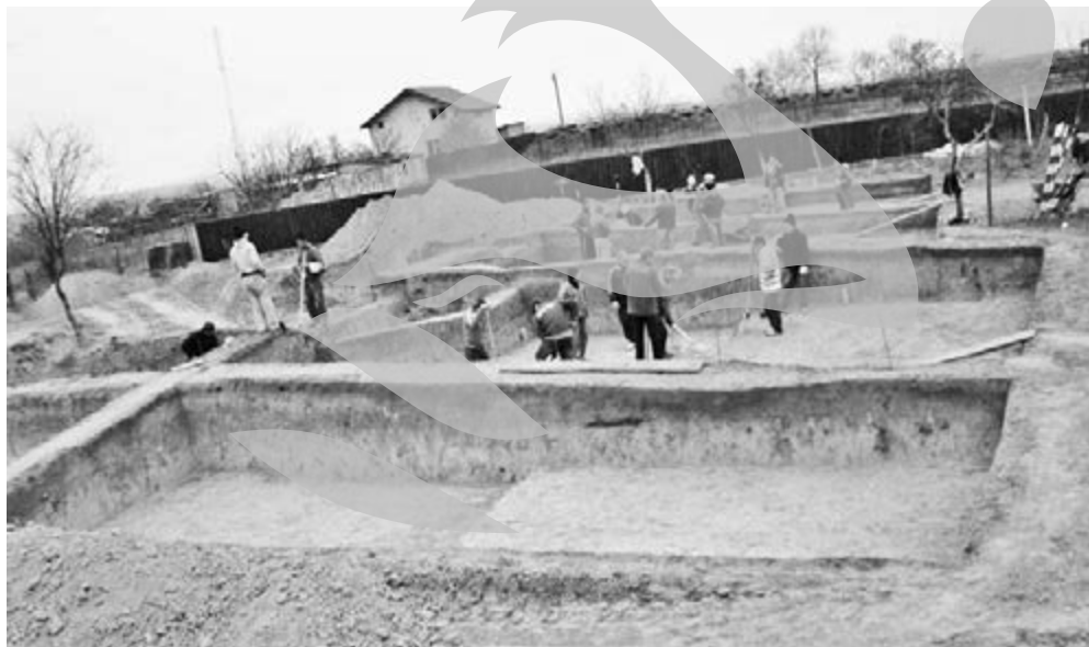
Săpătura la mormântul principal

Din cele 12 morminte, datele ca fiind de la sfârșitul perioadei