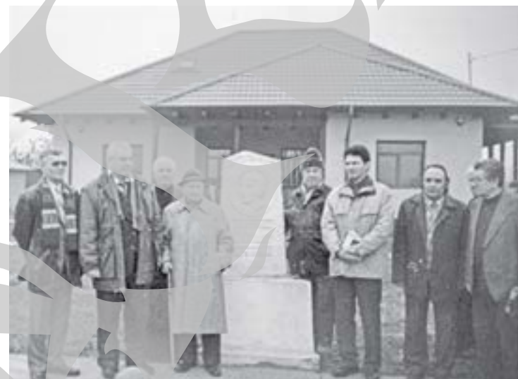
Oaspeți la Casa Memorială "Bengescu" Ivesti

De nouă ani, în luna decembrie, în preajma zilei de naștere (8 decembrie 1876) a scriitoarei Hortensia Papadat-Bengescu, Societatea Scriitorilor „C. Negri” și Revista Porto-Franco îi aduc un omagiu româncerei. Anul