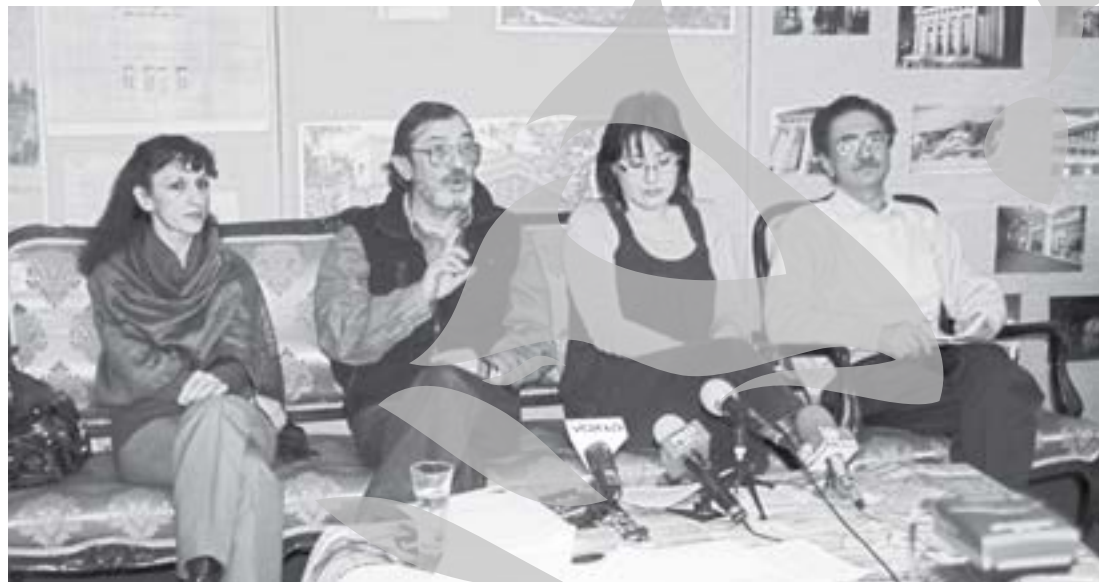
Conducerea Teatrului Dramatic spune că a făcut tot ce se putea face în condițiile lipsurilor financiare