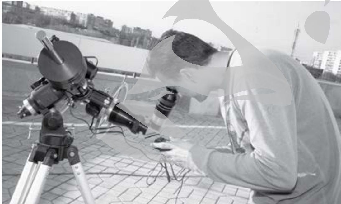
Există și telescop pentru observarea activităților solare

Alături de Planetariu se află Observatorul Astronomic, unic în România prin acoperișul retractabil cu care este dotat, prin