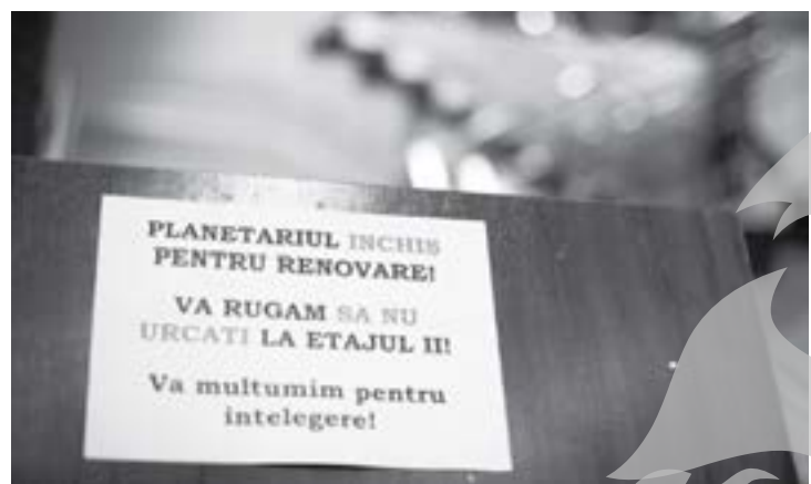
Deocamdată însă... accesul este interzis vizitatorilor