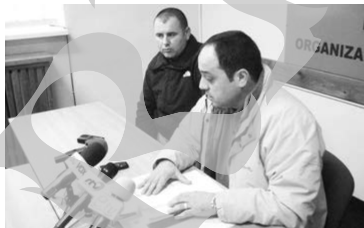
Azilantul (stânga imaginii) se jură că este complet sincer

► Ion Macarenco e indignat că basarabienii sunt acuzați de fraudare