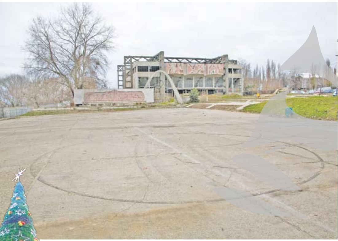
Platoul pe care va fi amenajat patinoarul