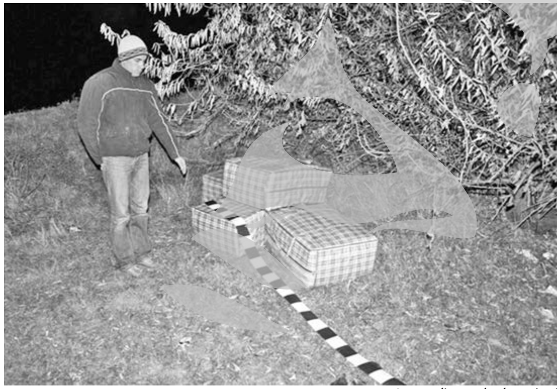
O parte dintre coletele cu țigări

operațiunea „Isaccea”, pentru strângerea de probe împotriva contrabandiștilor. Frontiera Galați a realizat flagrantul la mijlocul săptămânii trecute, în apropierea graniței, în zona sectorului Isaccea. Acela a fost momentul în care au fost prinși trei tulcenii, care transportau cu un microbuz 70.145 de pachete de țigări. Majoritatea țigărilor - 60.000 de pachete - „Plugarul”