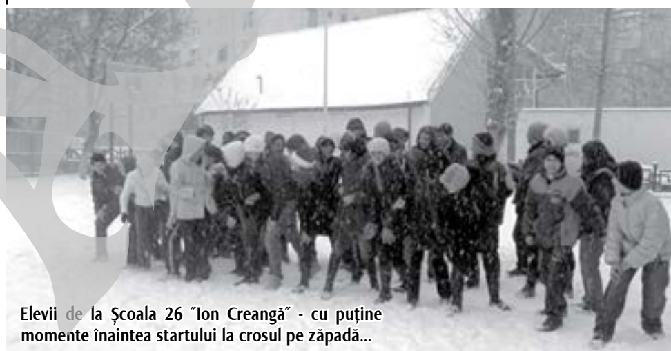
Elevii de la Școala 26 „Ion Creangă” - cu puține momente înaintea startului la crosul pe zăpadă...