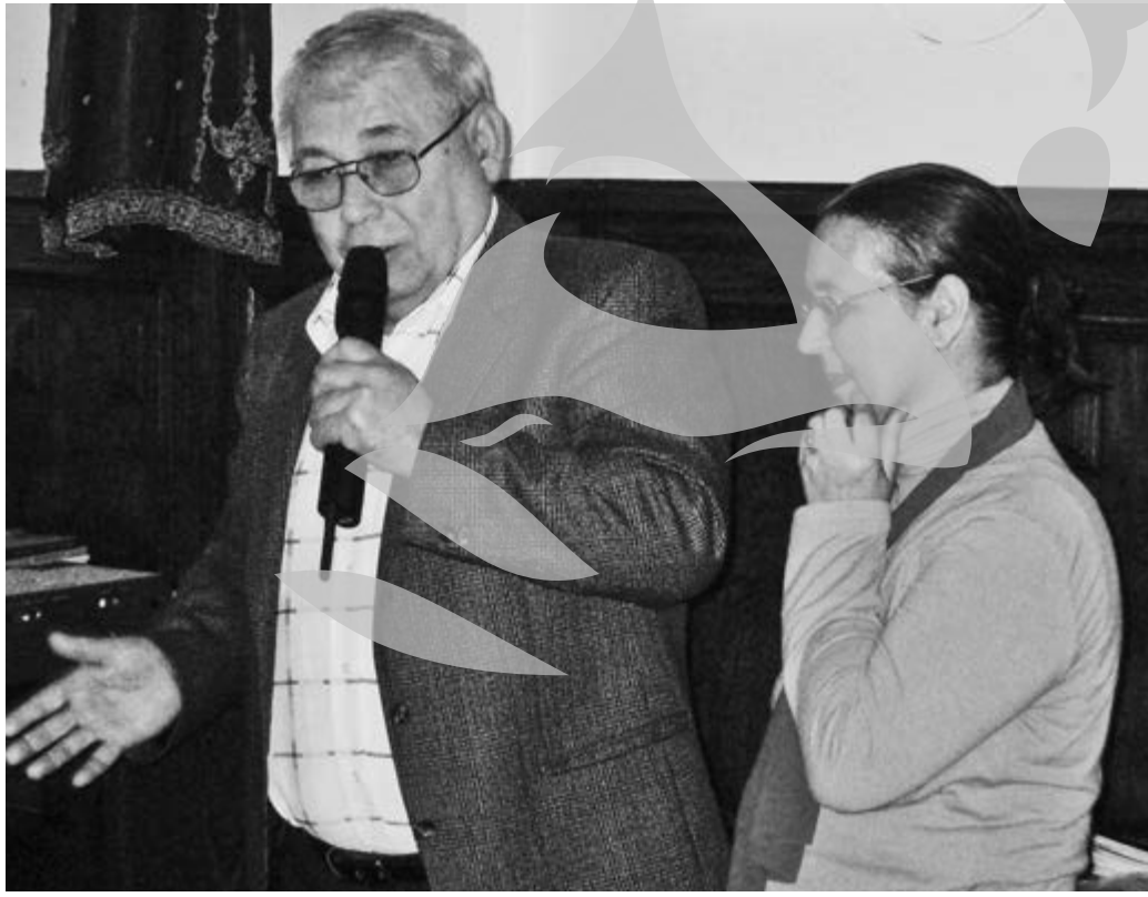
DI Fazant a cerut deja un loc de veci

În timp ce, de exemplu, Cimitirul Israelit s-a păstrat bine până azi, cel turcesc, din nordul Cimitirului „Eternitatea”, a fost desființat în timp: „De la gardul tipografiei vechi, la 50 - 60 de metri, spre strada Coșbuc, cândva acolo era o clădire în care trăia o familie de musulmani. În 1982 au demolat-o, au fost mutați la bloc. Acolo, după tradiție, ne duceam morții, în pijamale, îi spălam și apoi îi duceam să-i îngropăm alături. Și acum mai e o pancartă pe care scrie: «Parcelă turci - 192 de morminte»». Dar nu știu dacă mai există vreo cinci morminte, pentru că s-au vândut locurile. Acolo a fost îngropat tatăl meu, mama mea... Erau și monumente vechi de sute de ani acolo... N-am fost ajutați de nimeni. Să primim 50 - 100 de metri: <<Aici îngropați-vă morții!>>. Noi trebuie să ne îngropăm morții în ziua când au murit, de când răsare soarele