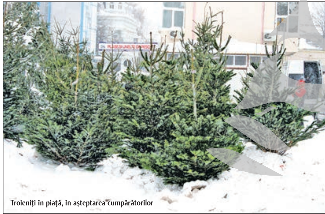
Troieniți în piață, în așteptarea cumpărătorilor

S cump! Anul trecut parcă era mai ieftin?! Acesta ar putea fi primul verdict al gălățeanului cu multă criză în portofel și în buzunare, cu perspective sumbre în suflet și dorința de a avea sărbători tradiționale, ca la bunica/mama acasă. Deși mai e ceva vreme până la Crăciun, oferta verde de sezon e deja pregătită. În Piața din Micro 19, un mănunchi mare de vâsc costă numai un leu. Te poți pupa fericit sub el, cu toată familia, convins că Anul Nou va fi cu noroc. În florării mai cu ștaif sau mai de cartier, aranjamentele cu brad, globulețe și lumânări de Crăciun sunt și ele gata. Dar asta nu înseamnă că nu te poți descurca și singur, cu puțină îndemănare și un strop de imaginație, să-ți faci propriul aranjament. Materie primă au florării din Țiglina I: crengi de brad expuse la vânzare. Dar mai sigur ar fi să apelezi la oferta de conifere din Piața Mare. Crengi, crenguțe, ramuri de brad și chiar brazi naturali mai