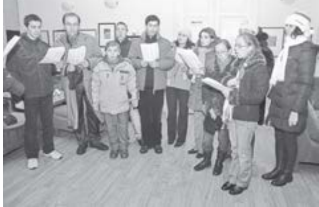
Colindători de la ASCOR