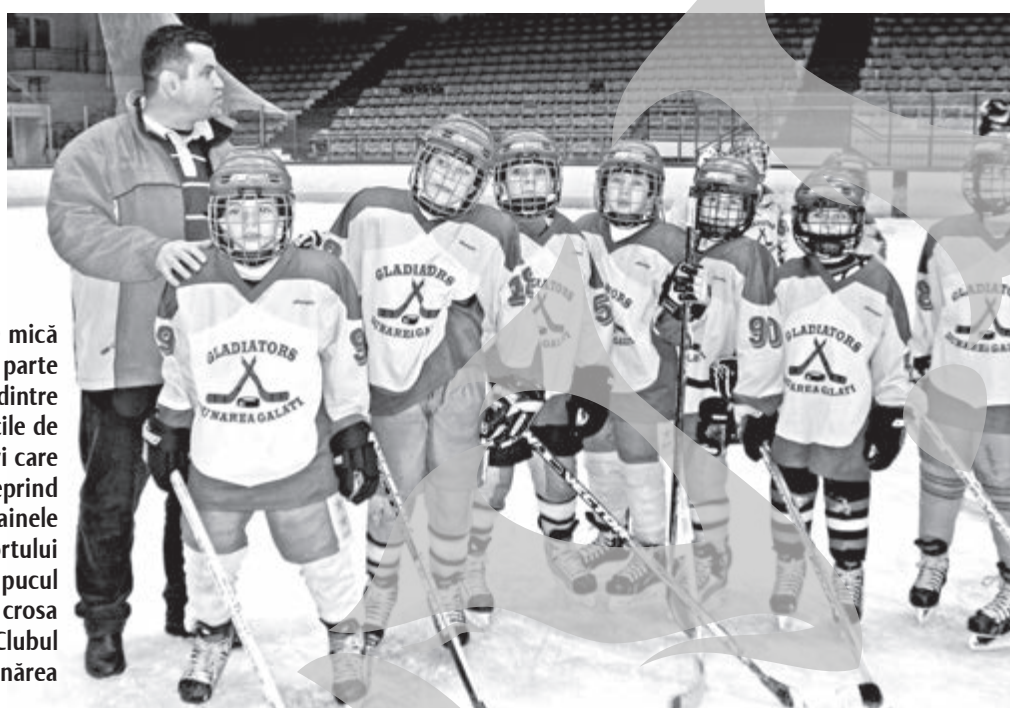
O mică parte dintre zecile de tineri care deprind tainele sportului cu pucul și crosa la Clubul Dunărea

Puzderie de copii îmbrăcați și echipați frumos, în culori vesele, s-au aflat pe luciul gheții Patinoarului Artificial din Galați. Cinci echipe de prichindei de la București și Galați s-au întrecut în prima ediție a "Memorialului Stelian Rusu" la hochei pe gheață. S-a jucat conform regulamentului pentru cei mai mici sportivi (copii între 6 și 10 ani), pe trei sferturi de teren, pe durata a două reprize a câte 20 de minute. După disputate aprige, în care s-a plâns de ciudă, dar s-a și chiuit de bucurie, clăsamentul final a fost următorul: 1. Gladiatori Dunărea Galați, 2. Olimpia București, 3. Triumf București, 4. Dunărea II, 5. Dunărea (fete).