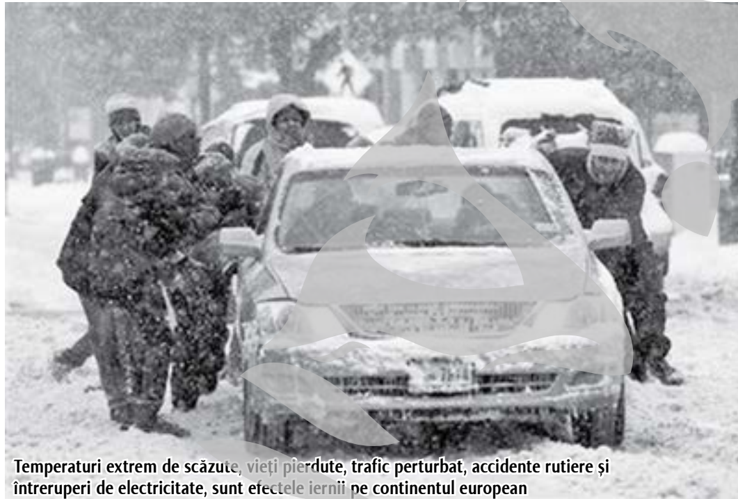
Temperaturi extrem de scăzute, vieți pierdute, trafic perturbat, accidente rutiere și întreruperi de electricitate, sunt efectele iernii pe continentul european

În Marea Britanie, operatorul BAA a avertizat în legătură cu riscul unor întâzieri și anulări de curse pe Heathrow. Reprezentanții aeroportului din Manchester au anunțat că