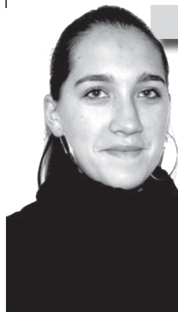
Ancheta noastră de sfârșit de an