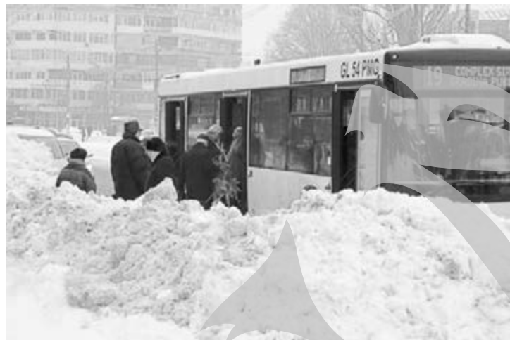
Urcatul în autobuz a devenit foarte dificil

fost strânsă? Așa s-ar elibera intersecțiile, s-ar evita și „îngroparea” în zăpadă a mașinilor, dar și formarea de parapeți de zăpadă de-a lungul străzilor, inclusiv în zonele cu trecere de pietoni sau în stațiile de autobuz (precum