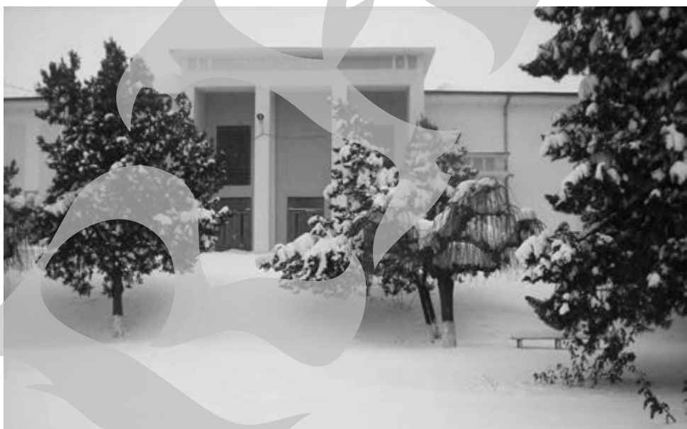
Luată cu asalt de zăpezi, Casa de Cultură „Ion Creangă” din Berești își cheamă în ajutor colindele

De consemnat cu prioritate: lumea din târg, după ce iarna s-a zburlit spre noi, a redescoperit stația CFR și călătoria cu trenul. Ieri, piața din Berești a fost moartă, nu l-a lipsit decât o lumânare aprinsă, înfiptă în zăpadă. Doar „Satana” (fiindu-mi, în linii mari, prieten, nu-i public numele) și-a ocupat locul la tarabă, oferindu-le amatorilor de alcool marfa sa inconfundabilă – rachiu „tras” de două ori, basarabeanul care respiră mai mult pe malul Chinei decât în Republica Moldova și vreo două țărânci cu capitalis-