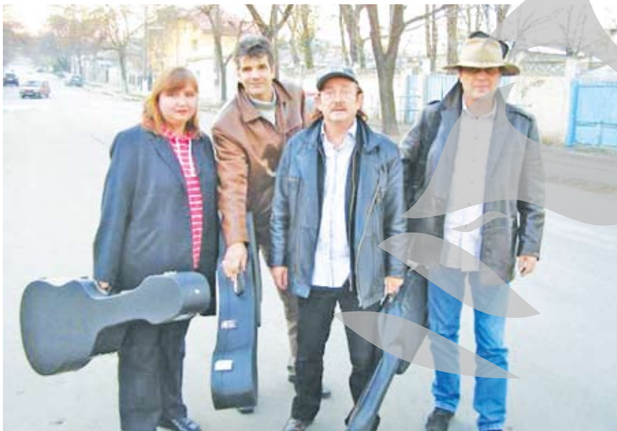
Patru dintre cei cinci membri ai formației

an întreg - și primii cititori care vor cumpăra ziarul de la chioșcuri vor primi, în ajun de Sărbători, CD-ul „Colinde pe Strada Mare”. Dacă sufletul tău știe „Colindul gutuiei din geam”, și fredonează deja un „Colind pentru mama mea”, pregătindu-se de împodobit bradul, atunci trebuie să ai acest CD.