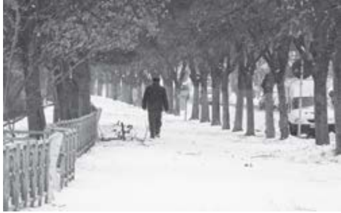
La capătul acestui tunel apar primii ghiocci