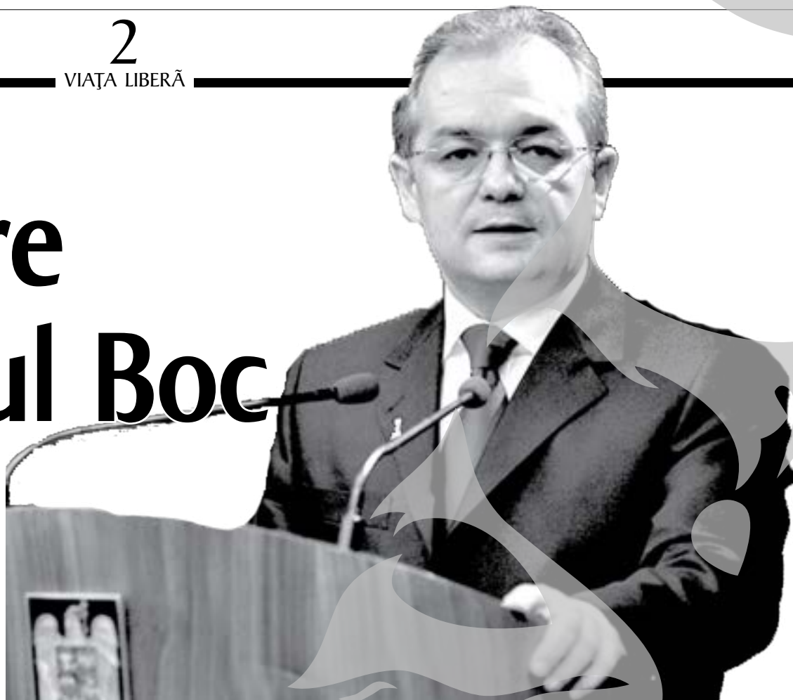
Premierul Emil Boc și-a anunțat echipa

Audierile miniștrilor desemnați se vor desfășura mâine, urmând ca viitorul Cabinet să fie votat miercuri în plenum Parlamentului, potrivit unor