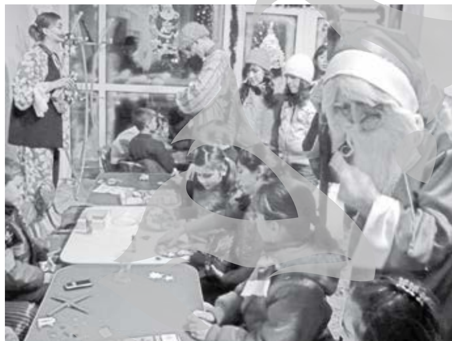
Text și foto: Maria Stanciu

Târziu în noapte, când darurile din acea zi au ajuns la destinatari, Moșul a plecat să se odihnească