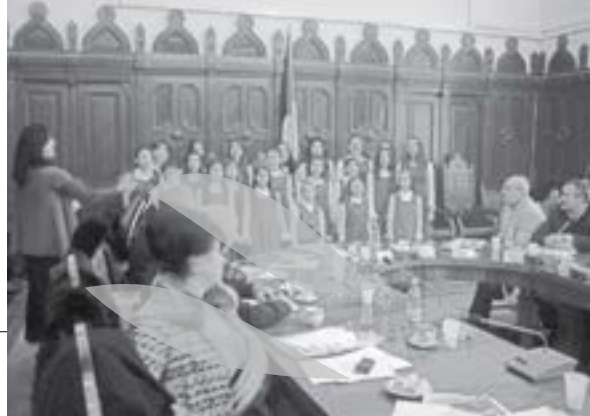
Afară ninge, înăuntru au venit colindătorii