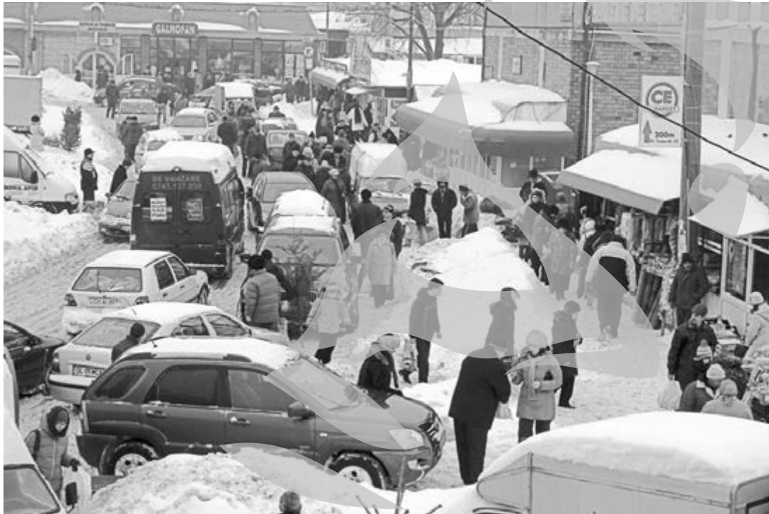
Toată lumea vrea să ajungă în piață