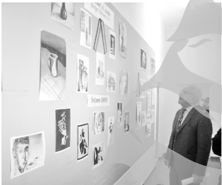
Expoziția cu lucrările de grafică

Concurs on-line între penitenciare: poezie, proză, grafică Premiile înlăți, pe secțiuni, s-au dus la penitenciarele Botoșani și Iași Un juriu mai mult sau mai puțin... liber