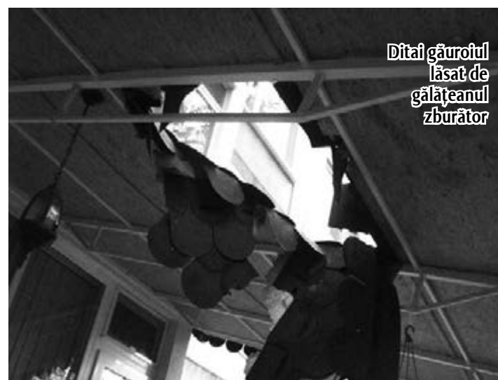
Ditai găurotul lăsat de gălățeanul zburător

„În țara lui Traian Vuia, un domn a inventat zborul fără motor de la înălțime mare, cu aterizare lină. A reușit, căzând de la etajul patru, să se aleagă numai cu o vânătăie la nivelul unei pleoape. Acest succes se datorează unui paradox. Unui oximoron, s-ar spune științific. Beția îți salvează viața. Probabil dacă se agita mai tare, conștient de ce se întâmplă, ateriza mai prost.