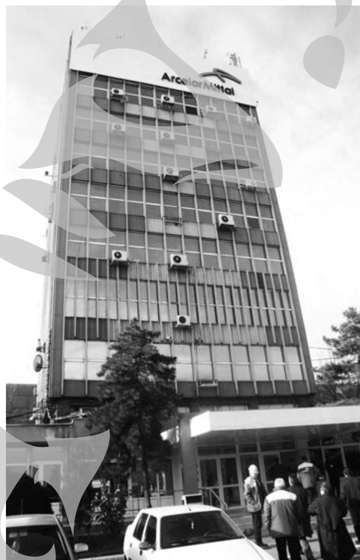
2009, cel mai greu an pentru siderurgie de la cel de-Al Doilea Război Mondial

Rămăsesem parcă la asigurări, la promisiunile șefilor Combinatului că nu vor închide capacități. Nefericite promisiuni tocmai în luna aprilie! Asta pentru că, la doar câteva zile după discuția cu Videanu, conducerea organizează o conferință de presă în care anunță închiderea tuturor bateriilor de cocsificare.