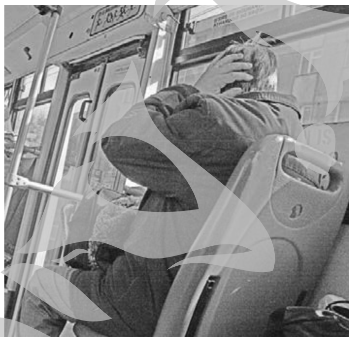
Pensionarilor le rămâne plăcerea de a se plimba gratis cu autobuzul

cetățenilor cu pensii mici. Astfel, în 2009, persoanele cu pensii de până în 300 de lei au beneficiat de abonament gratuit la transportul urban de călătorii pe o linie. Cum pensiile minime au fost majorate de la 300 la 350 de lei, și Consiliul Local Galați a decis ca această facilitate să se aplice celor cu pensii de până la 350 de lei pe lună. Aceeași măsură se aplică și în cazul pensionarilor de invaliditate care nu beneficiază de facilități în baza Legii nr. 448/2006 și HCL nr. 126/2007.