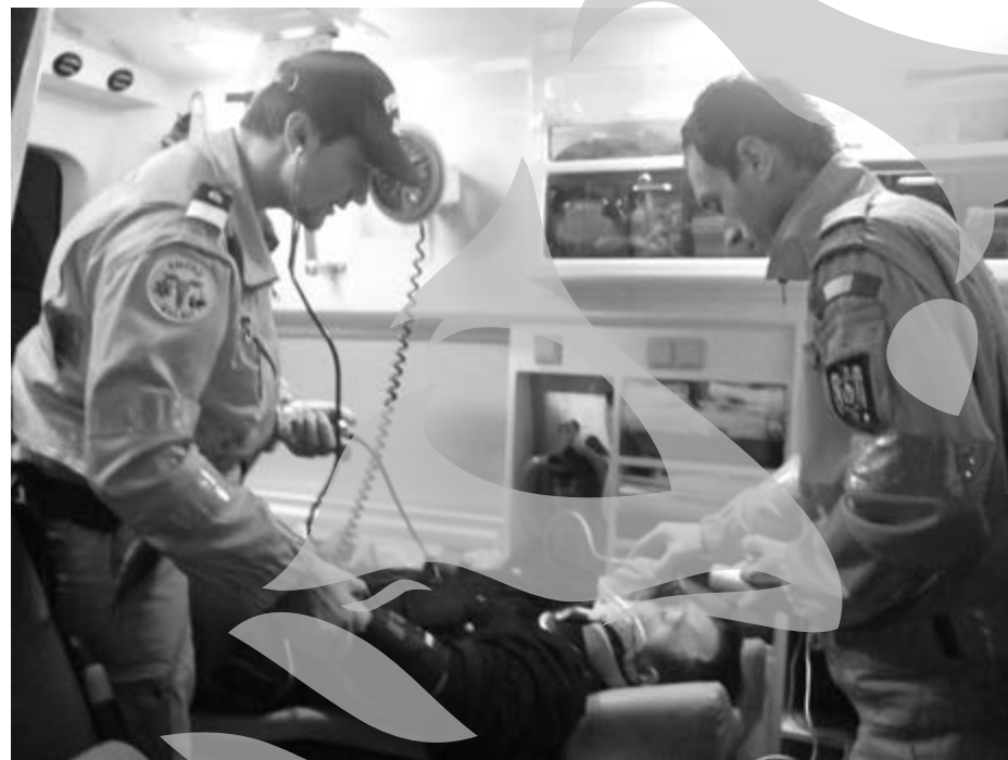
Serviciile de urgență au făcut totul pentru salvarea pacienților