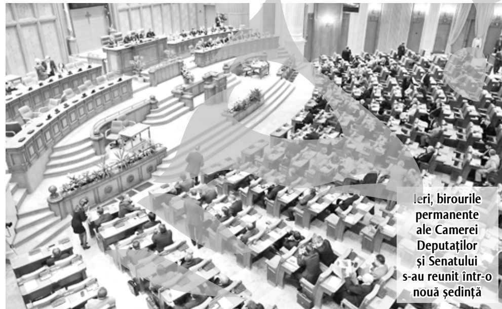
Ieri, birourile permanente ale Camerei Deputaților și Senatului s-au reunit într-o nouă ședință

Guvernul a adoptat OUG propusă de MJ pentru deblocarea Registrului Comerțului. Competența de soluționare a cererilor de înregistrare în Registrul Comerțului aparține directorului