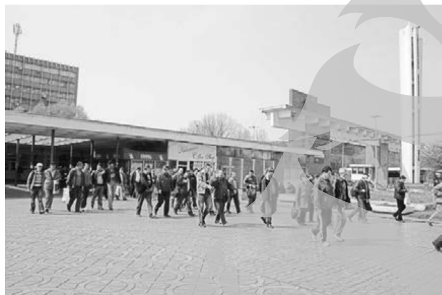
Mulți dintre siderurgiști au ales plecările voluntare

Vizita anunțată de către Scântei nu a avut loc, așa cum era de altfel de așteptat în plin an electoral. Probabil că acum, când Traian Băsescu este absolut sigur pe încă un mandat și nicio renumărare de voturi nu-l mai poate clinti, la Cotroceni s-a pus de un ceai și se așteaptă un oaspete londonez la ora cinci.