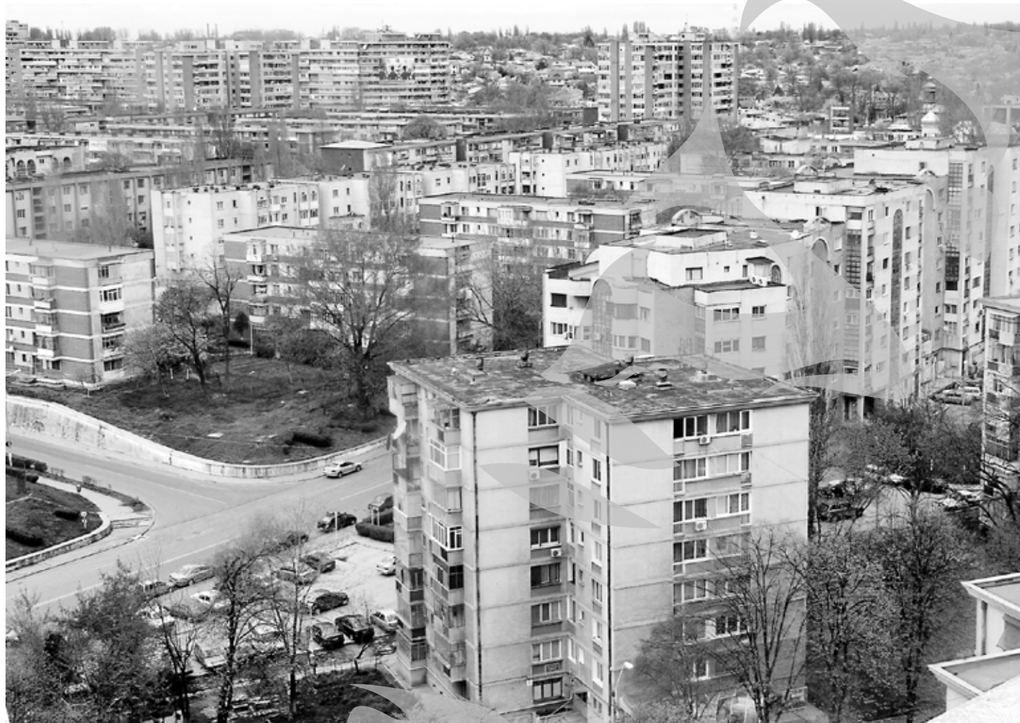
Unora le este dor inclusiv de blocurile gălățene

Dar astea sunt fenomene trecătoare, în istoria noastră și a