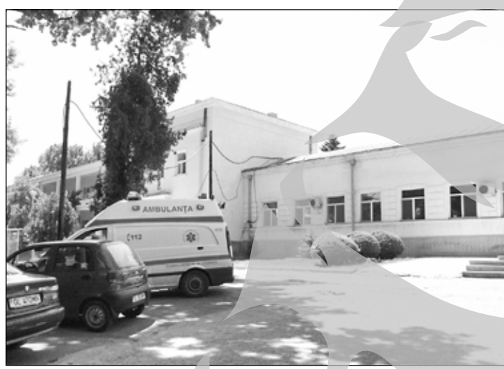
Curtea Spitalului TBC