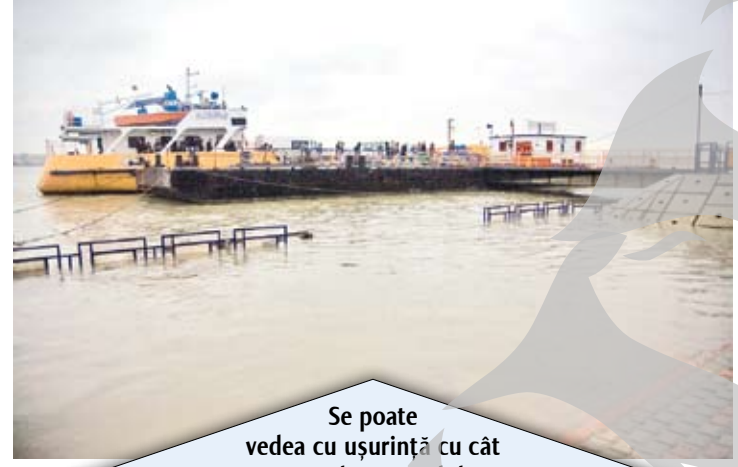
Se poate vedea cu ușurință cu cât a crescut Dunărea la punctul de Trecere Bac

În schimb, lucrările ISPA, lăsate în voia ploii, au creat un adevărat rău de noroi care se scurge la vale, către Dunăre, dând bătaie de cap șoferilor. Mai rău decât noroiul de pe jos este însă traficul în zonă, având în vedere că pentru a urca pe Faleza Superioară, de la Bac, se circulă pe un singur fir (din cauza acelororași lucrări ISPA), iar șoferii grăbiți trec chiar și pe trotuarele din zonă.