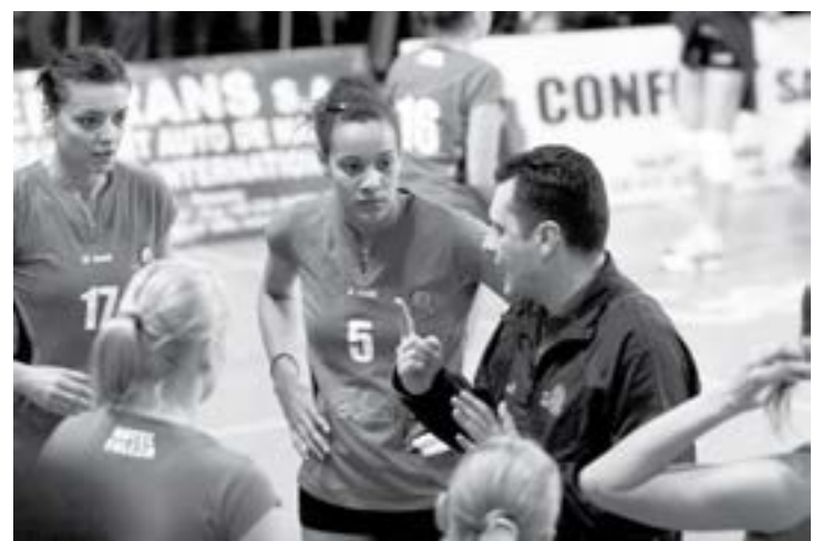
Sfaturile antrenorului Terzici sunt ascultate cu cea mai mare atenție de jucătoare

declarație: „În perspectiva jocului cu Novara, nu cred că a fost binevenit un meci de cinci seturi în compania formației Tomis (n.n. 3-2 pentru Galați). Mai ales că în ultimele șase zile am disputat trei partide. Dar asta e viața, am intrat în horă, trebuie să jucăm până la capăt. Ca să înțeleagă toată lumea, CSU Metal este calificată în faza următoare a Ligii Campionilor. Doar dacă nu se joacă corect în Grupa B, noi mai putem pierde calificarea. Cu toate că, în proporție de 99 la sută, suntem calificată, mergem la Buzău să învingem Asystel! Italienele sunt, în acest moment, o echipă de bătu, încă nu se află în cea mai bună formă sportivă! Din păcate, Gomez nu