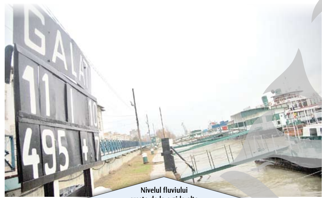
Nivelul fluviului crește de la o zi la alta

Maria Mândiță mariam@viata-libera.ro