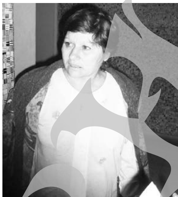
Și bătută, și fără porc

O femeie de 54 de ani din Jorăști a fost tare lipsită de noroc în dragoste, cel puțin până acum. După ce soțul i-a murit,