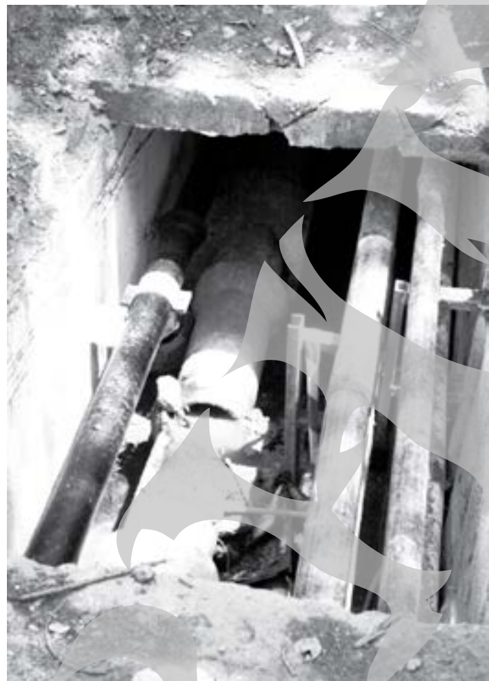
Conductele vechi trebuie reabilitate pentru a se reduce pierderile de agent termic

Primarul Dumitru Nicolae intenționează să contracteze un împrumut bancar pentru a continua o serie de investiții majore Una dintre lucrările necesare: modernizarea conductelor de termoficare Din cauza conductelor vechi, peste 60 la sută din agentul termic produs se pierde până la caloriferul gălățeanului