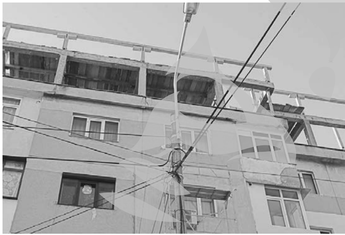
Mansarda, în construcție de un an și jumătate