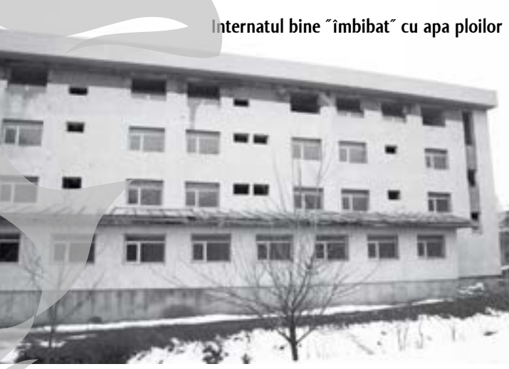
Internatul bine "îmbibat" cu apa ploilor

În materie de bilete de tratament balnear Anul 2009, mai sărac decât 2008