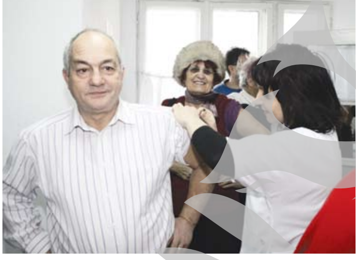
Pacienții care au respectat programul centrului de vaccinare n-au avut de așteptat mai mult de câteva minute

În ultimele zile, la nivelul DJSP nu s-a înregistrat nici o nouă confirmare a vreunui caz de infecție cu gripă nouă, potrivit dr. Boldea. S-au stabilit, însă, două noi suspiciuni, în cazul unui tânăr de 18 ani și al unei femei de 68 de ani. Ambii sunt internați în prezent la Spitalul de Boli Infecțioase „Sfânta Paraschiva”, iar starea lor generală este bună.