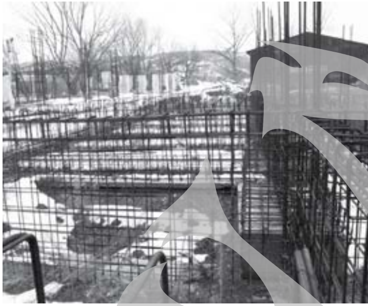
Fundația atelierelor acoperită de zăpadă

Nici în anul 2010 nu se știe dacă se vor aloca fonduri pentru continuarea lucrărilor. Deja la firma care realizează campusul s-au acumulat datorii de 250.000 de lei. Anul trecut, dacă s-ar fi continuat finanțarea, întreaga investiție a fost estimată la 9,2 milioane de lei. Acum, după ce lucrările au fost lăsate de izbeliște și clădirile s-au deteriorat simțitor, prețul va crește, neîndoindu-ne. Bani risipiți aiurea din buzunarele noastre. Și nici măcar nu avem satisfacția că am putea trage pe cineva la răspundere.