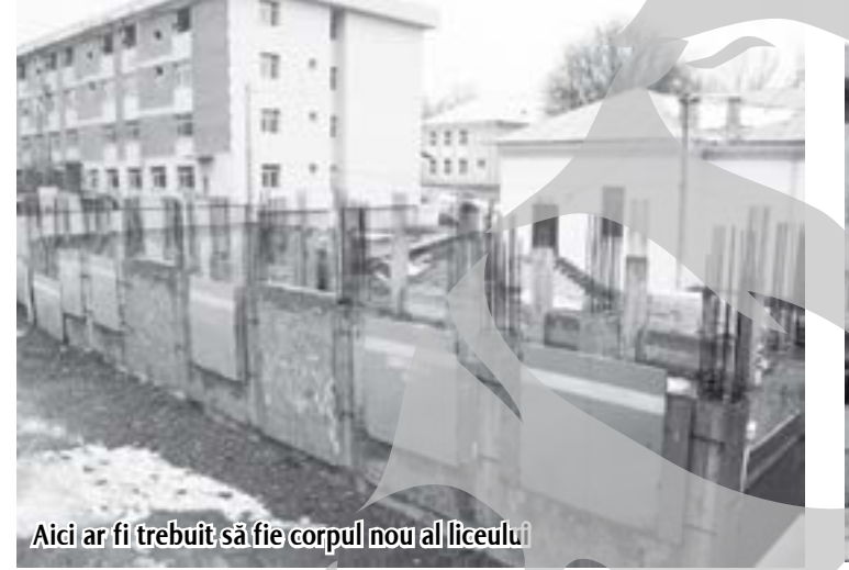
Aici ar fi trebuit să fie corpul nou al liceului

Etajul superior al internatului este plin de șiroaiele de apă. Ploaia s-a infiltrat în ziduri, făcând adevărate ravagii. Asta pentru că