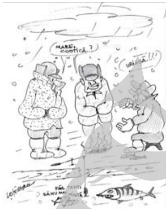
Desene de G. Ștefănescu