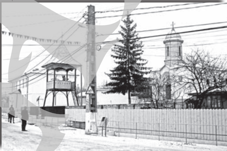
Clopotnița din Rădești, construită după proiectul lui Ioan O. Porumb. I-a adăugat o piață, două poduri din beton armat, amenajarea centrului civic al comunei, un sediu de Poliție fără pereche în județul Galați...