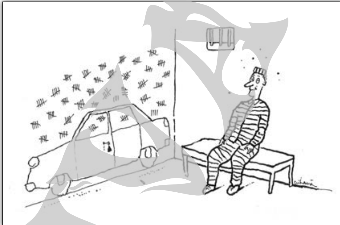
Desen de Fl. Crihană