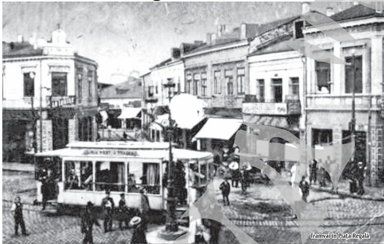
Tramvai în Piața Regală