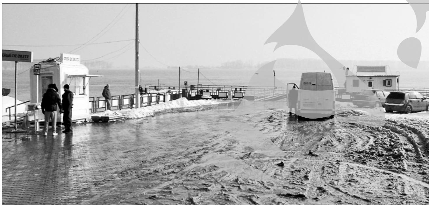
Trecerea cu bacul nu se scumpește

Pentru cei care nu au mai trecut demult cu bacul, spre Tulcea (I.C.Brătianu), vă reamintim că pentru autovehicul „normal” se încasează o taxă de 18 lei, iar pentru pasageri, câte 1,5 lei. Pentru autovehiculele de mare tonaj, taxa este stabilită în funcție de tonaj, dar și de încărcătură. Astfel, pentru cele cu masă între 2-4 tone, taxa este de 30 de lei, pentru cele cu greutate între 8 și 10 tone – 40 de lei, iar pentru cele de 20 de tone – 44 de lei. La aceste prețuri se adaugă câte 10