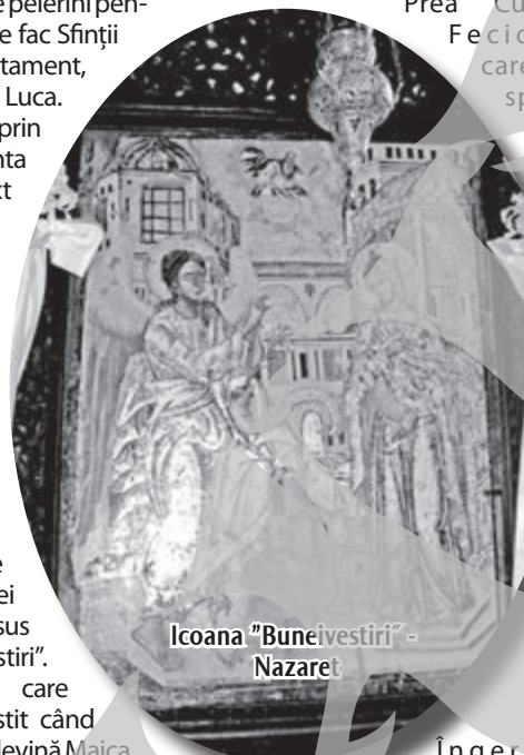
Icoana „Bunei Vestiri” - Nazaret

femei și binecuvântat este rodul pântecelui tău...” (Luca 1,28)... Și continuă Îngerul Domnului: „Iată vei lua în pântec și vei naște Fiu și vei chema numele Lui Iisus” (Luca 1, 35). Tot Îngerul Domnului a fost cel care a alungat nedumerirea Prea Curatei Fecioare care îi spune