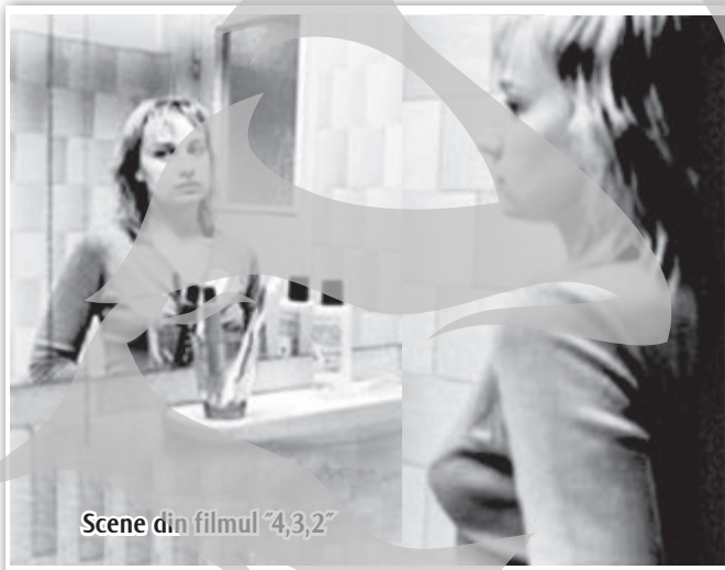
Scene din filmul "4,3,2"

suplimentară, prietena își învinge repulsia și se oferă să se "sacrifice" în locul ei. După "sacrificiul" pe altarul "prieteniei", se face avortul și totul se termină cu bine (sau aparent bine). Regizorul este foarte apreciat, laudat, și premiat, publicul încântat și mândru că încă un român a intrat într-un club select al unor recorduri selecte. Pe cine va pedepsi Dumnezeu? Evident, pe Ceaușescu. El în lad, iar fătul avortat la pubelă, pentru că au obstrucționat amorul liber, adică curvia. (Termenul „desfrânare” pare mai blând dar este generic. Din rațiuni medicale, spirituale etc. oamenii se înfrânează de la mâncare, băutură, sex, bărfă, hoție, minciună etc. Opusul este desfrânarea) Ceilalți protagoniști, inclusiv publicul care a aplaudat, ar trebui să meargă în Rai deoarece, potrivit noului relativism (analfabe-