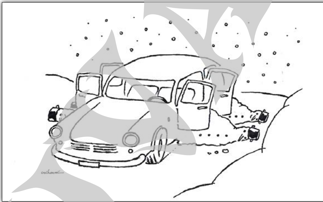
Desen de Fl. Crihană

Notă: la 30 ianuarie 1852, în zori, se naște Ion, fiul lui Luca Caragiali și al Ecaterinei, și se botează la 7 februarie, în biserica din satul Haimanale, jud. Prahova (satul a primit numele Ion Luca Caragiale). În zorii zilei de 9/22 iunie 1912, moare subit, la Berlin.