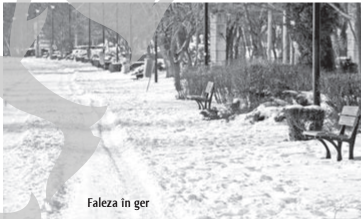
Faleza în ger

kilometru mai târziu nu mai simțeam defel frigul, dar organele interne îmi pulsau și mă dureau ca dracu'... nu aveam de gând să mă opresc, ba chiar am accelerat și pentru câteva mo-