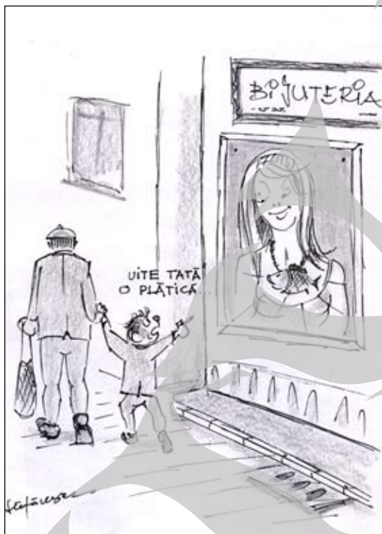
Desene de G. Șteierănescu