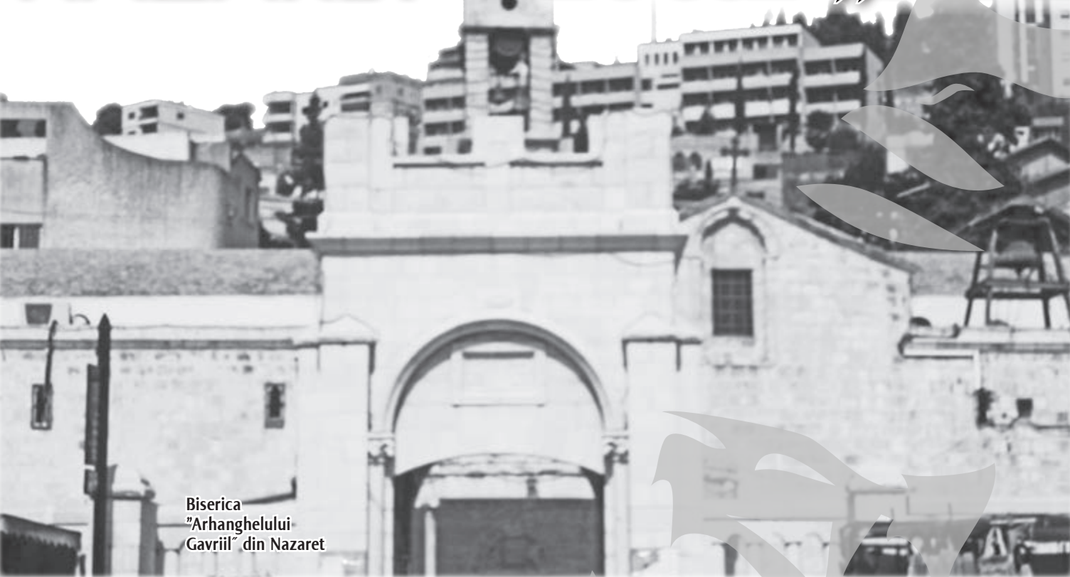
Biserica „Arhanghelului Gavriil” din Nazaret