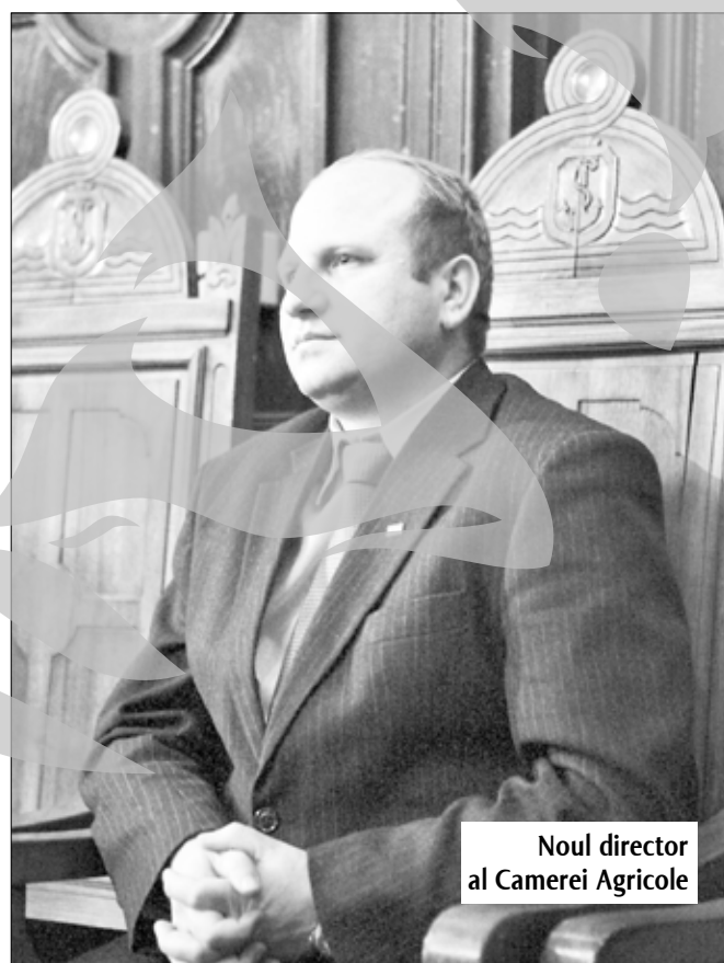
Noul director al Camerei Agricole