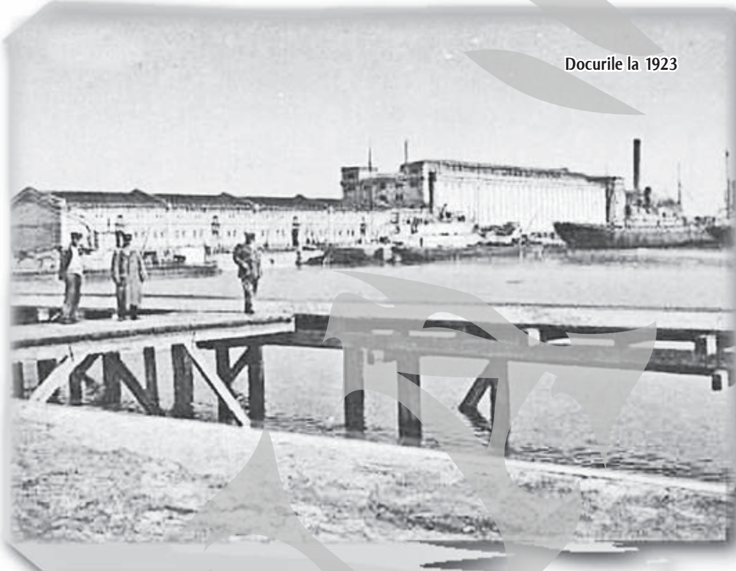
Docurile la 1923