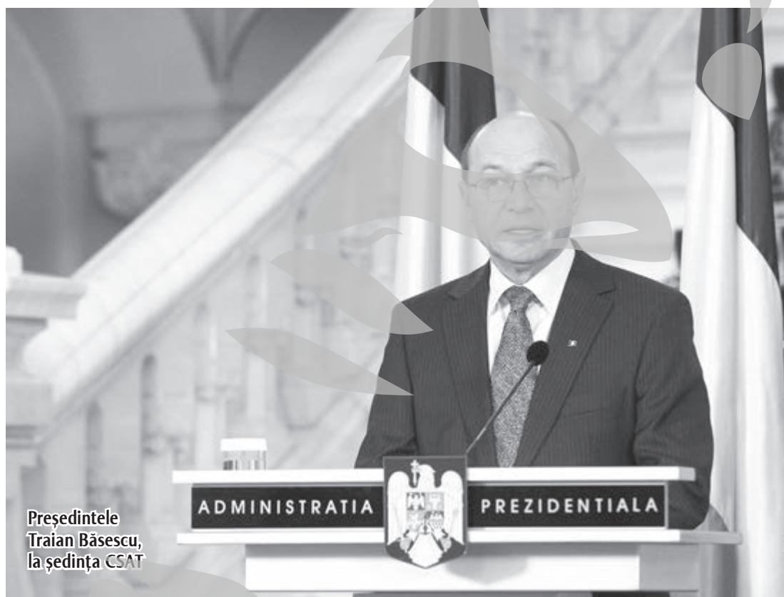
Președintele Traian Băsescu, la ședința CSAT

Președintele Traian Băsescu a declarat, ieri, după ședința CSAT, că pe teritoriul României vor fi amplasați interceptori tereștri, ca parte componentă a sistemului antirachetă și că, potrivit calendarului convenit cu partea americană, sistemul va fi operațional pe teritoriul țării noastre începând cu anul 2015.