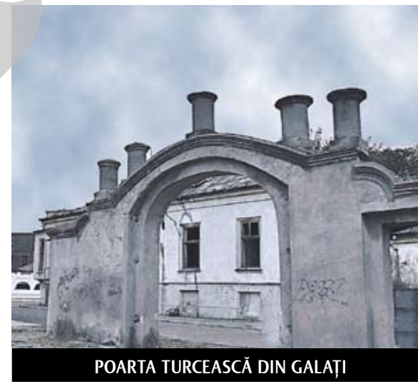
POARTA TURCEASCĂ DIN GALAȚI

Ce-a fost mai întâi, oul sau găina? Sau ce-a fost mai întâi, elevul tâmpit - vorba președintelui Băsescu - sau proful blazat? În fond, am mai spus-o: se întoarce bumerangul și profesorii care i-au trecut clasa pe Băsescu și pe Boc, dascăli, acum, alții duși într-o lume mai bună, au "produs" făcătorii de legi de azi, cei care le îngheață pensile și taie salariul cadrelor didactice! Iar profesorii de azi produc viitorii legiuitori, care vor tăia poate și mai mult! Vă îndoiți că au fost clementi și le-au dat prea ușor unor viitori politicieni notă de trecere, în speranța că plozii respectivi vor avea bun-simț să stea în banca sau în barca lor, cu puțintica lor carte prinsă-n neuronii? Păi uitai-vă că, recent, Academia Română, aia care ne tot schimbă limba scrisă doar ca să-și merite leafia, voia să-l facă pe președintele republicii academician! Probabil că Academia n-a uitat vremea când era de bun-simț s-o ridici pe Tovarășa la rang de academician!