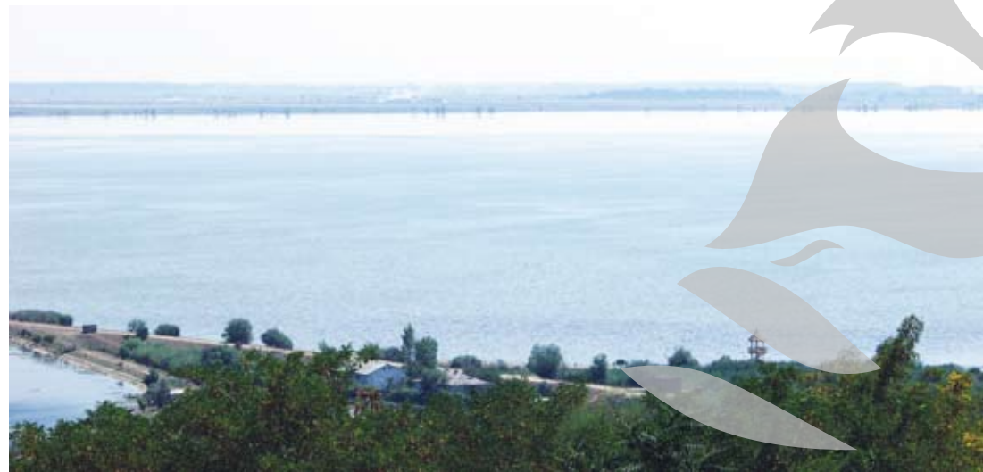
Pe lângă Brateș, cu sacii plini de pește