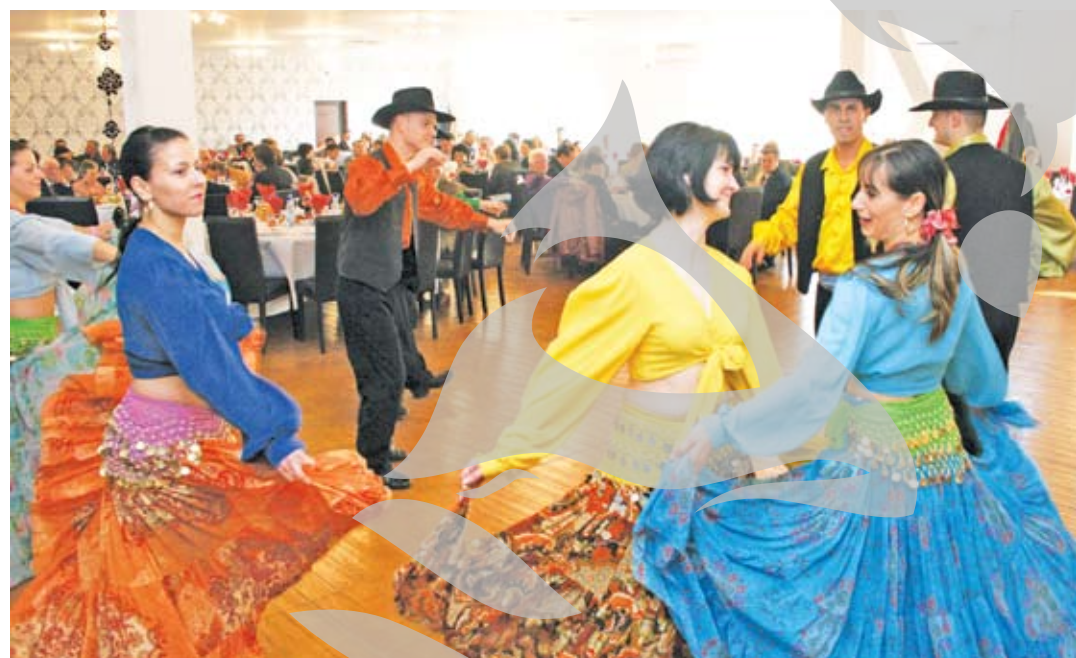
Pescari și vânători, la dans

De aici încolo nimic nu le-a mai stat în cale celor care s-au aflat sâmbătă la marea petrece-