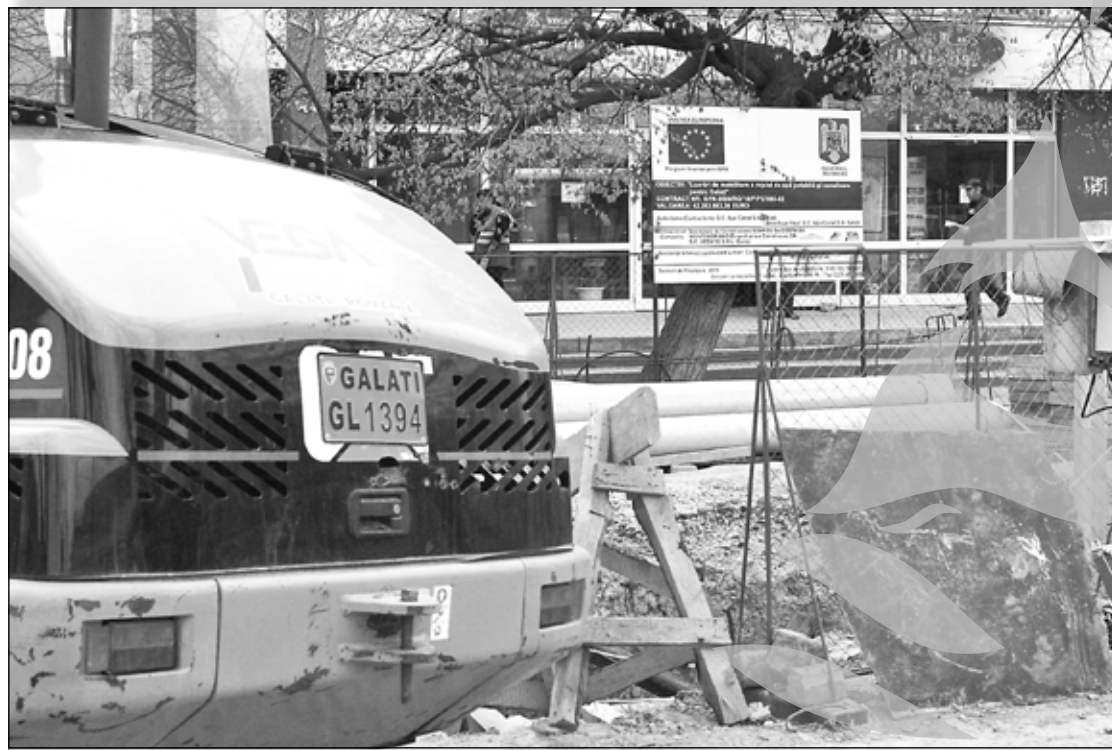
Lucrările derulate prin programul ISPA vor afecta serios traficul rutier în acest an