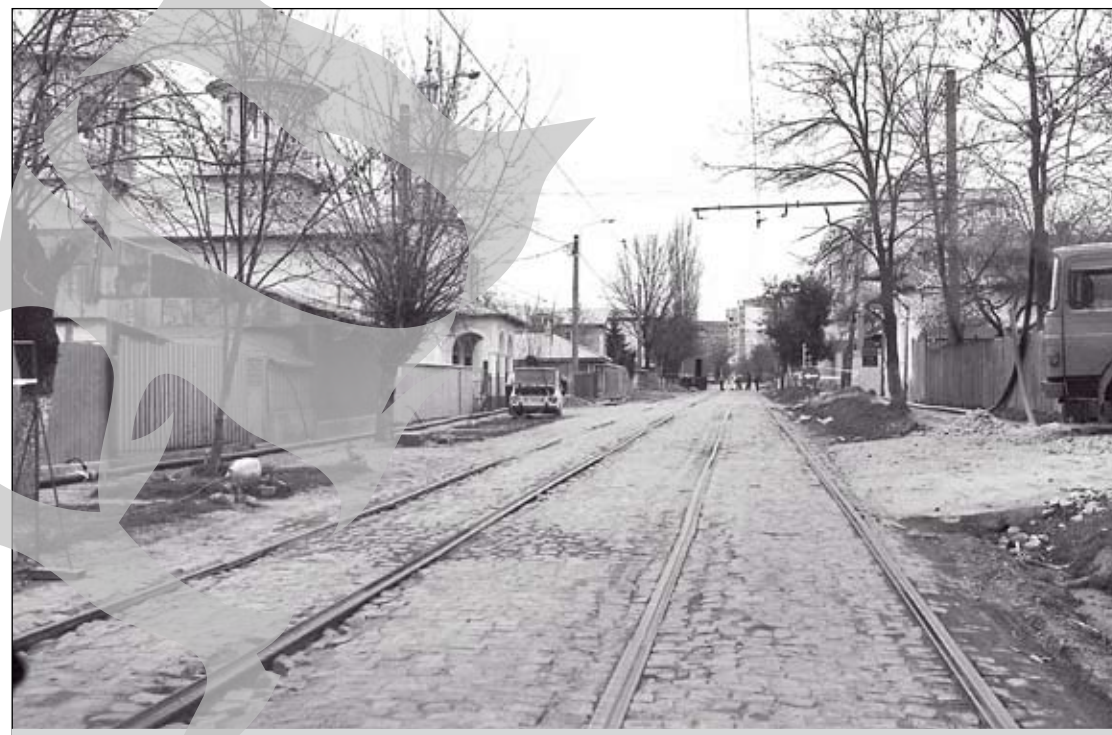
Pe strada Frunzei, lucrările trebuiau începute de la 1 aprilie. Păcăleală!