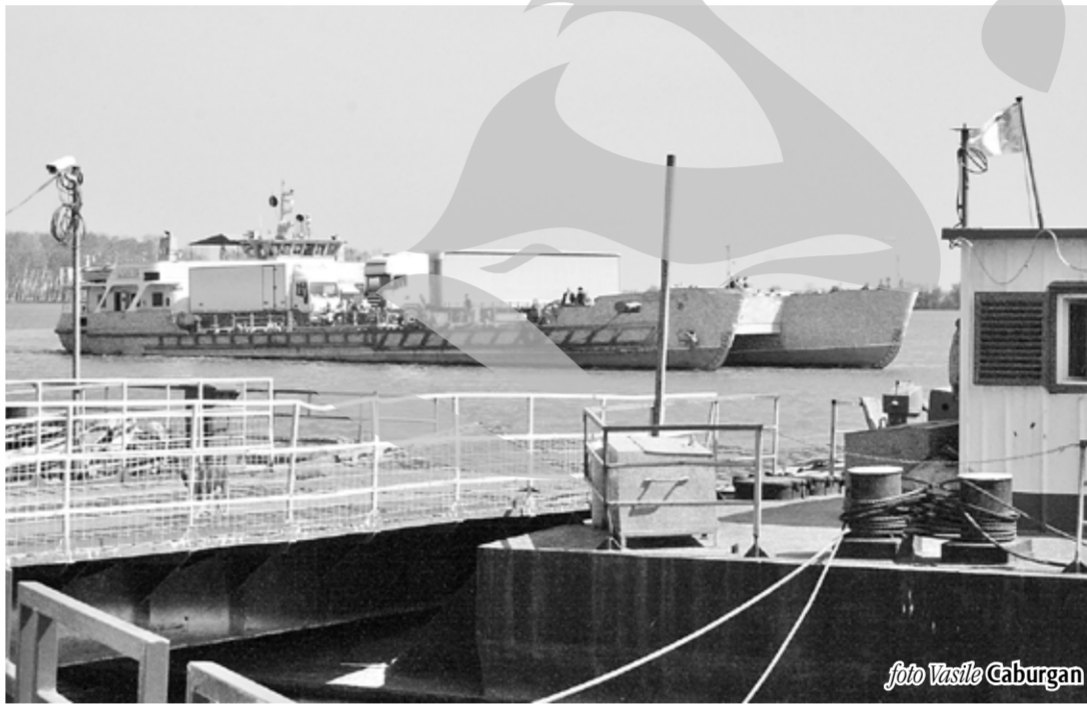
Bacul gălățean, încărcat cu mașini

Astfel, lipsesc acum din "magazie" următoarele "obiecte": flota noastră nu mai există, decât în poze; industria alimentară cu marile ei combinate de porci, bovine și păsări este prădăută aproape integral; industria de camioane și de tractoare, eliminată și scriptic și faptic; industria de apărare a trecut acum de la armată la civili și se profilează pe fabricarea de pineze, cleme și bidoane; industria minieră este lichidată în proporție de 70 la sută, iar minerii cu care te mândreai au fost trimiși la cules ciuperci și flori de pădure. În cei 20 de ani de gestiune frauduloasă, ținută fără evidență, de gestionarii: Ilescu, Constantinescu, Bănescu, Roman, Stolojan, Văcăroiu, Ciorbea, Radu Vasile, Isărescu, Năstase și Tăriceanu, a dispărut și peste 25 la sută din pădurea română; în agricultură, pământul a fost fărâmițat în parcele și împărțit la cca opt milioane de țărani, distrugându-se în prima fază CAP-urile, iar acum sunt în ultima fază de lichidare și IAS-urile. Nu mai vezi pe ogoarele patriei tractoarele și combinele fabricate la noi în țară, acum vezi în număr mare, mii de cai, măgari și chiar oameni, trăgând la plug ca în evul mediu.