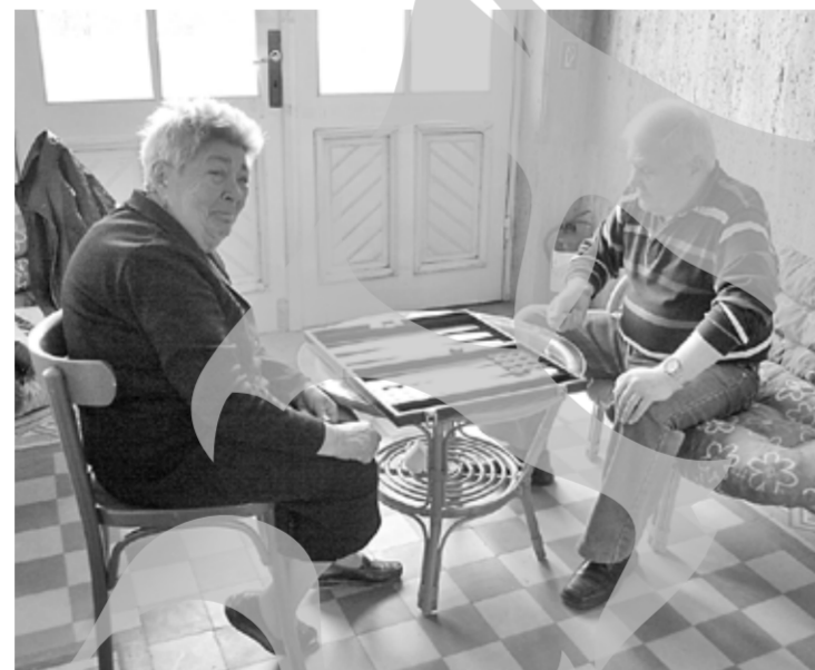
Un loc pentru relaxarea pensionarilor

Trebuie să mai amintim că în fiecare zi de joi se organizează concursuri de dans cu perechi, numai primele trei perechi