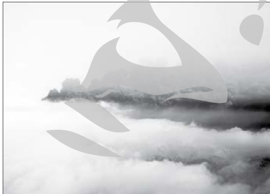
Ieri, la ora 15.00, s-au redeschis alte opt aeroporturi

Întrebat dacă există posibilitatea ca, în această săptămână sau cea viitoare, să mai apară asemenea probleme, directorul Administrației Naționale de Meteorologie, Ion Sandu, a arătat că dacă norul emite în continuare, o parte din emisie va traversa Europa.