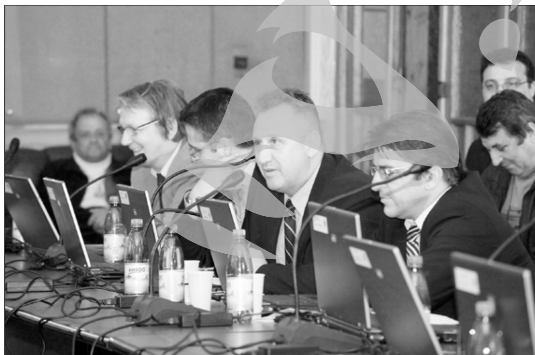
Grupul PDL a votat pentru sediul nou al partidului

Consilierii democrat liberali au devenit ținta ironiilor atunci când s-a spus la vot atribuirea în folosință gratuită, organizației județene a PDL Galați a suprafeței de 500 mp, amplasată pe Bulevardul Marii Uniri, pentru construirea sediului partidului. Consilierul PC Gheorghe Bugeag s-a grăbit să întrebe dacă transmiterea se face pe toată durata partidului sau a construcției. În contractul de transmitere în folosință gratuită a terenului, se specifica în mod clar că e vorba de durata existenței