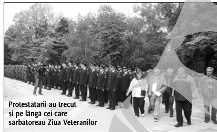
Protestatarii au trecut și pe lângă cei care sărbătoreau Ziua Veteranilor

Nu a fost chiar așa, însă ieri, la ora 10.00, în fața sediului Casei Județene de Pensii, prima instituție ce urma să fie pichetată joi, nu se aflau decât vreo doi-trei pensionari. În schimb, forțele