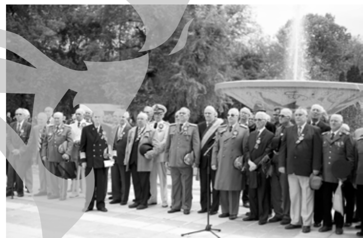
Veteranii au rămas tot mai puțini

ACEST ARTICOL AR PUTEA ANUNȚA SCĂDEREA PREȚURILOR LA ELECTROCASNICE CU 15% ASTA NUMAI DACĂ VEȚI CUMPĂRA DE LA SIMON'S ELECTRODISCOUNT GALERIA REAL!