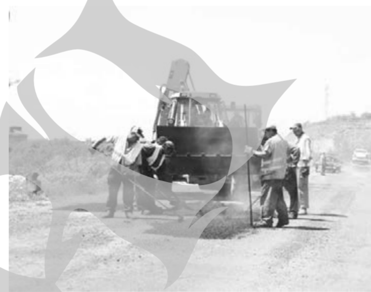
„De ce se frezează un drum secundar, aproape neumbat?”

Tot de la directorul Ecosal am aflat că de ieri a început cărpeala pe bulevardul Coșbuc și strada Saturn (extrem de „bine” frezată, de vreo săptămână și ceva), iar de astăzi începe asfaltarea gropilor de pe strada Cuza (cea din spatele blocului Cristal, o stradă extrem de intens circulată, dar care, din cauza frezării, a fost un adevărat coșmar pentru șoferii în ultimele două săptămâni). „Toată lumea se plânge că frezăm și lăsăm neastupate gropile. Este vorba despre tehnologia de lucru: stația unde se prepară