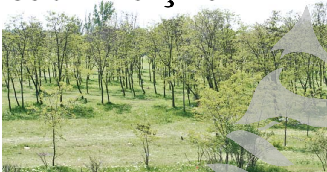
Nu vă lăsați impresionați de verde; prin iarbă încă mai este gunoi, însă nu la fel de mult ca în alți ani