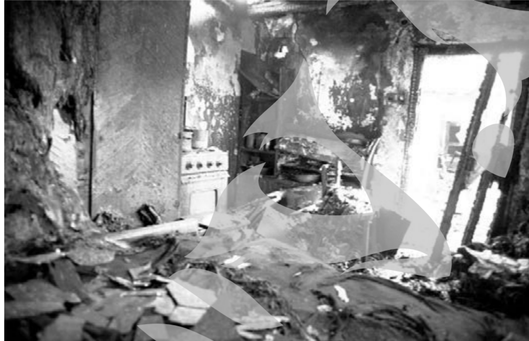
Casa de la 242