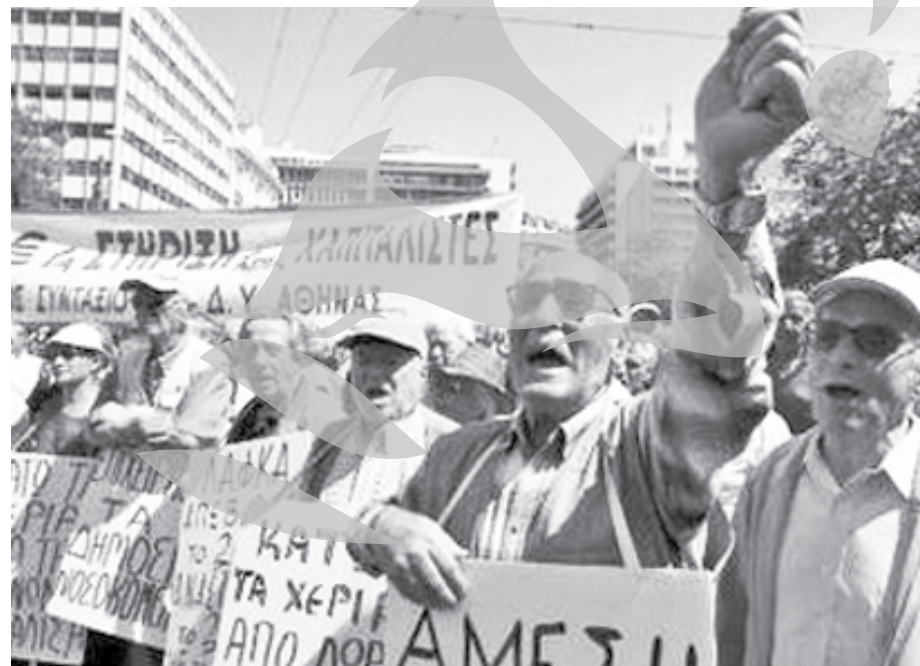
Și pensionarii au ieșit în stradă

(375.000 de membri) și Confederația generală a muncitorilor eleni (circa 1 milion de membri), susțin declanșarea unei greve generale astăzi, ca formă de protest față de planul adoptat duminică de autoritățile de la Atena, în schimbul unui sprijin financiar de 110 miliarde de euro din partea Uniunii Europene și a FMI. Funcționarii publici sunt cei mai afectați de planul menit să scoată Grecia din criza cu care se confruntă. Aceste măsuri dure prevăd neacordarea a două salarii din cele 14 ale funcționarilor publici și a două pensii din 14 tuturor pensionarilor, compensate cu prime pentru persoanele cu venituri mici. Ca semn de protest față de aceste măsuri de austeritate, spitalele, școlile și birourile administrației financiare vor fi închise sau vor lucra cu personal redus. Liniile aeriene vor fi întrerupte. Sectorul privat, inclusiv presa, va fi afectat.