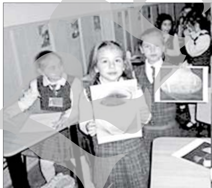
Elevii școlii „Miron Costin” au învățat să respecte urmele istoriei

Săptămâna trecută, o parte dintre elevii Școlii 12 „Miron Costin” au petrecut câteva zile neobișnuite în compania muzeografilor din județul Neamț. Instituția lor de învățământ este partenerul unui proiect realizat de Muzeul de Istorie Roman, din județul Neamț. Conceput pentru a dezvolta arie de cunoaștere și de înțelegere a patrimoniului cultural la vârsta copilăriei, proiectul „Creație și inovație în cultu-