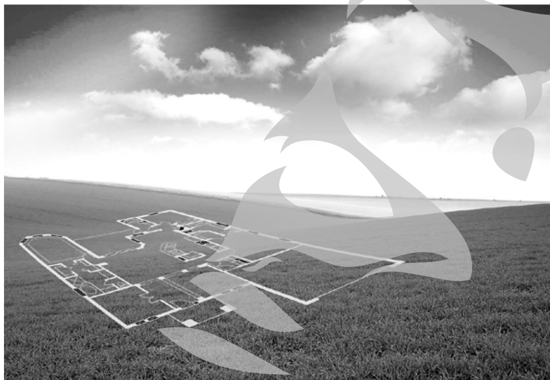
Visând la construirea unei case

Vizita la bancă se încheie destul de repede, majoritatea unităților scuzându-se că „normele de creditare pe acest program sunt în lucru”. De fapt, nu există interes real din partea băncilor pen-