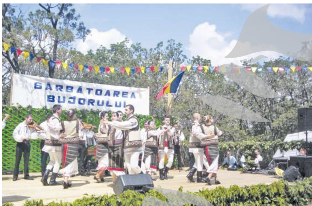
Scena, ca o revărsare de frumusețe. Mulți au stat pe bănci până la "trasul cortinei"...