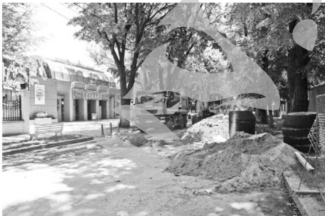
Strada, blocată de lucrările ISPA