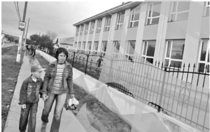
Moderna școală gimnazială "Elena Doamna"

Una dintre cele mai tinere comune ale județului, Cuza Vodă, a avut parte, la finele săptămânii trecute, de o dublă inaugurare: Primărie și o școală nouă. Cei peste 3.000 de locuitori ai comunei Cuza Vodă au un sediu modern în care va funcționa Primăria, dar și o școală de nivel european, la capitolul dotări. Noua primărie se întinde pe o suprafață de peste 150 de metri pătrați și reunește Casa Căsătoririlor, Biroul Agricol, Biroul pentru Situații de Urgență etc. Tot în comuna Cuza Vodă a fost inaugurată