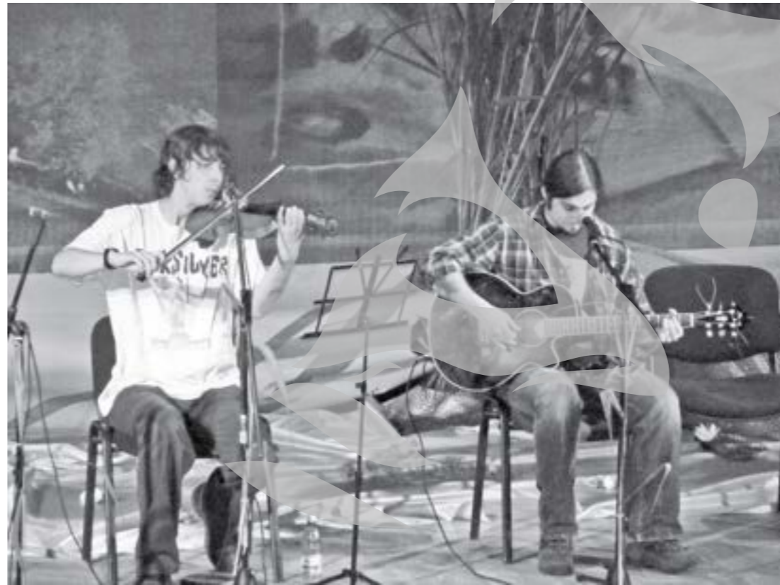
Grupul „Proiectul Tivodar” din București, câștigătorul Marelui Premiu