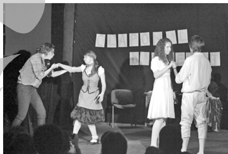
Machiaje, costume, dezinvoltură - tinerii au avut tot arsenalul unui spectacol reușit

Doi dintre cei 12 protagoniști au terminat deja liceul, iar ceilalți zece sunt toți colegi în aceeași clasă (Filologie, a XI-a), la Colegiul Național „Mihail Kogălniceanu”. Ei sunt „Pe dos”, o trupă de tineri care, cel puțin în ultimele șase luni, și-au investit timpul și energia în această pasiune. Avanspremiera de la