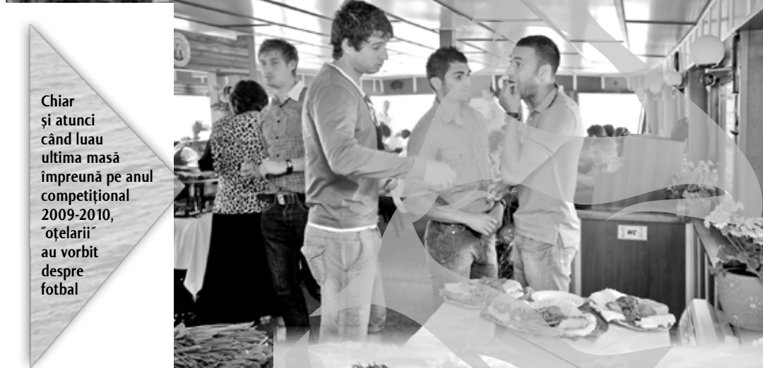
Chiar și atunci când luau ultima masă împreună pe anul competițional 2009-2010, "oțelarii" au vorbit despre fotbal