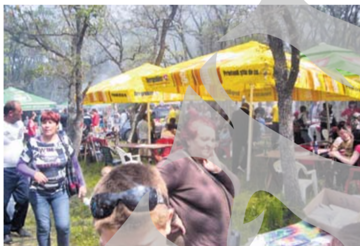
La tot pasul, în perimetrul zero, tentații culinare specifice petrecerilor la iarbă verde