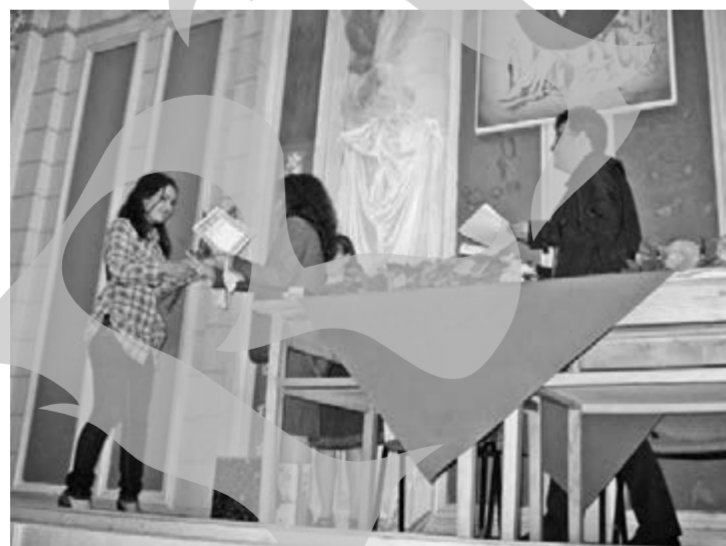
O mențiune pentru lucrarea elevei din Galați